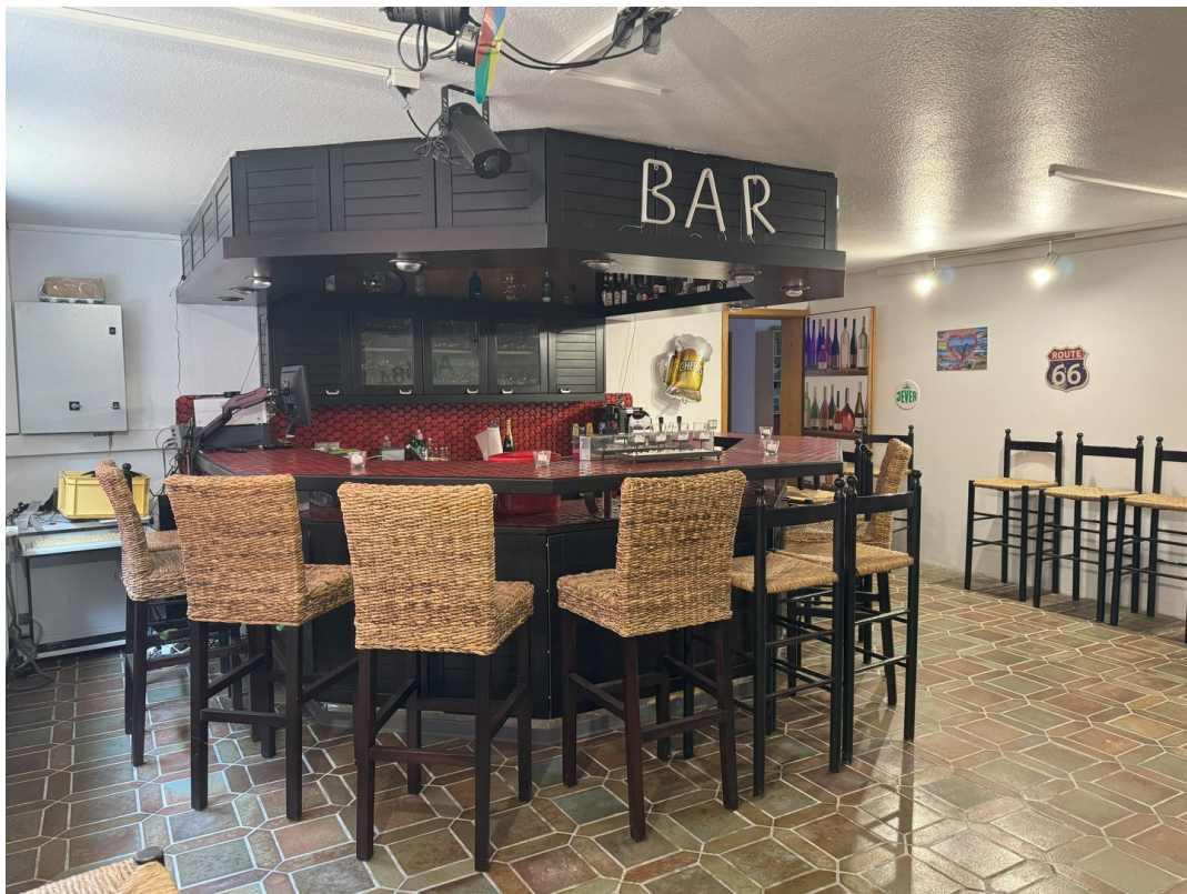
vor der Party