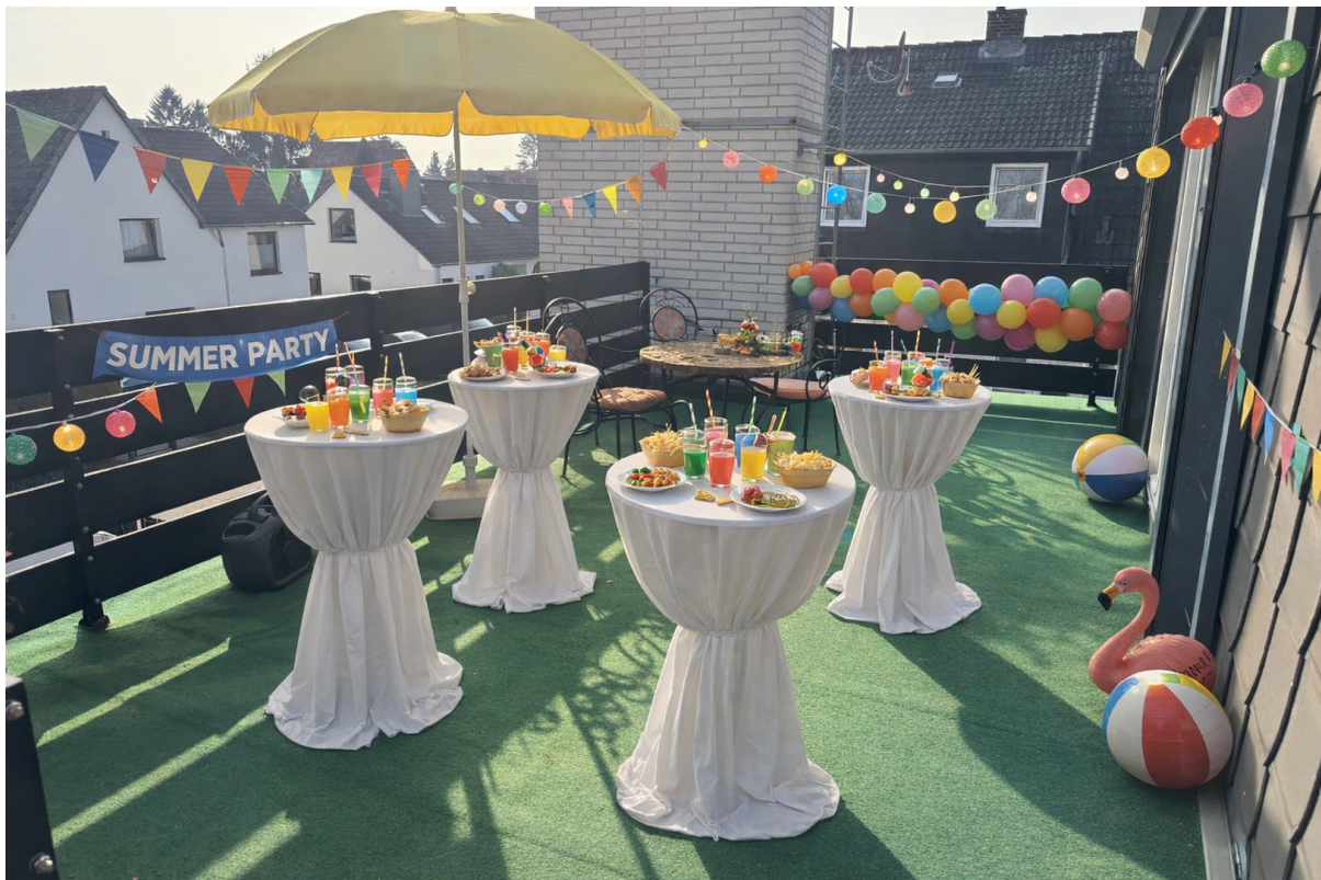
Party auf der Dachterrasse