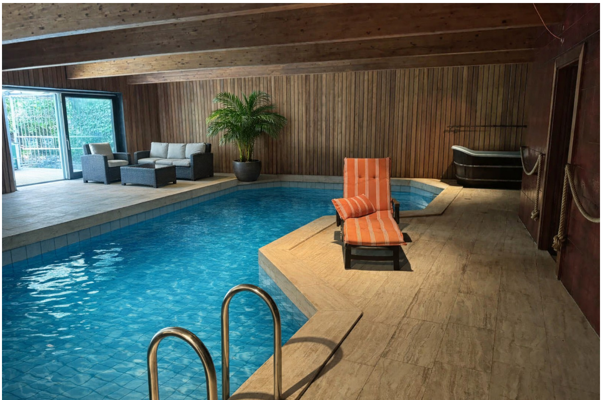
KI-Bild! muss saniert werden