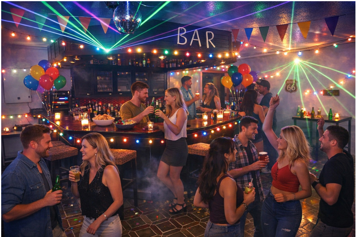
Bar mit KI-Menschen