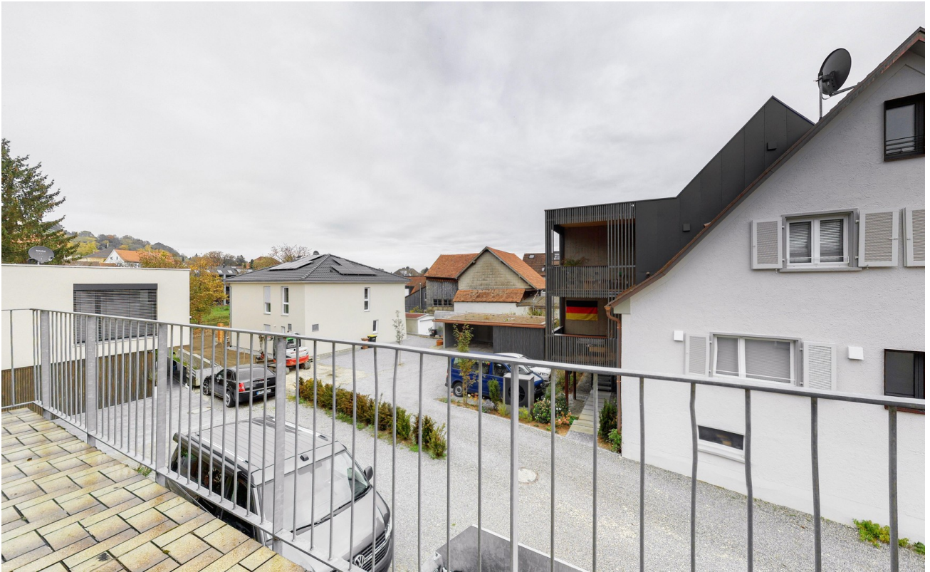
Aussicht vom Balkon