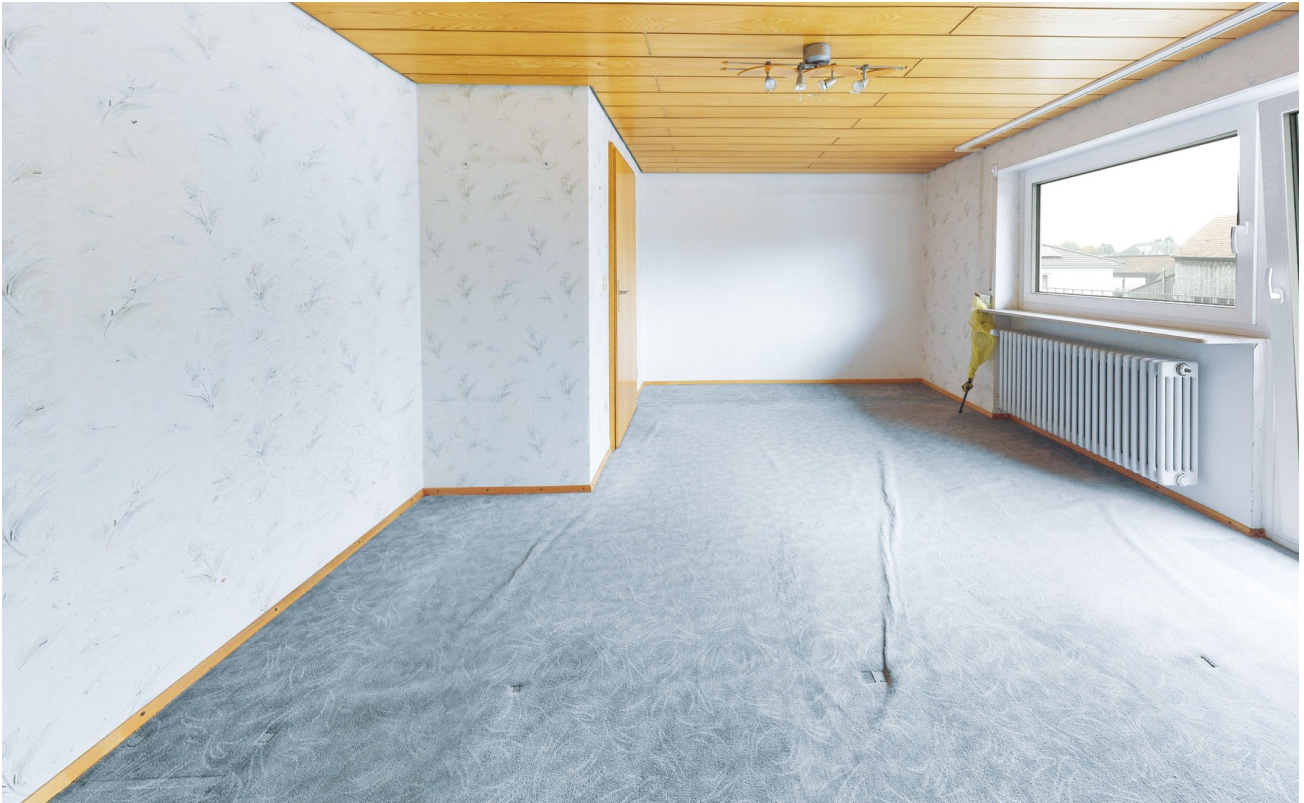
Zimmer im OG