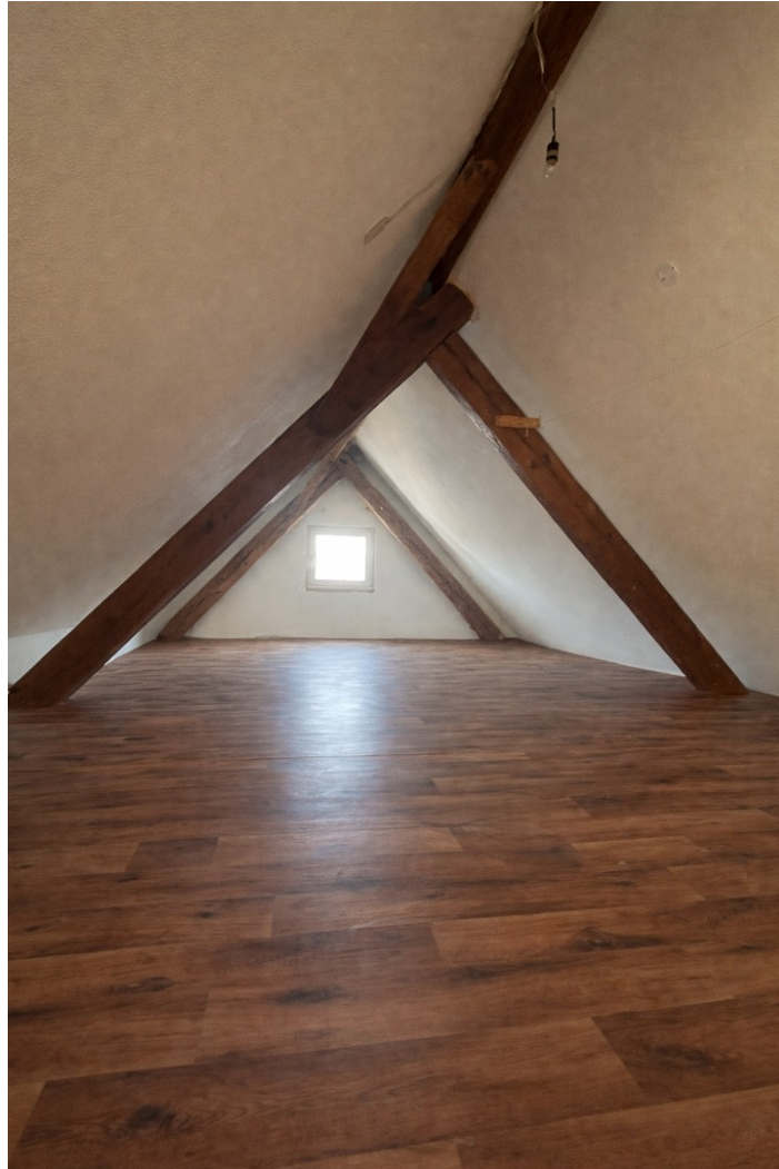
Galerie im Dachspitz