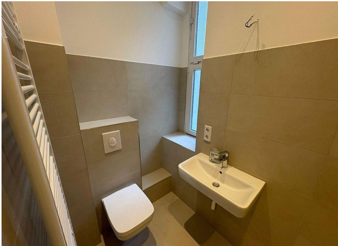
Badezimmer Ansicht 1