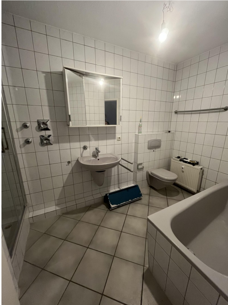
Bad m. Dusche, WC u. Wanne