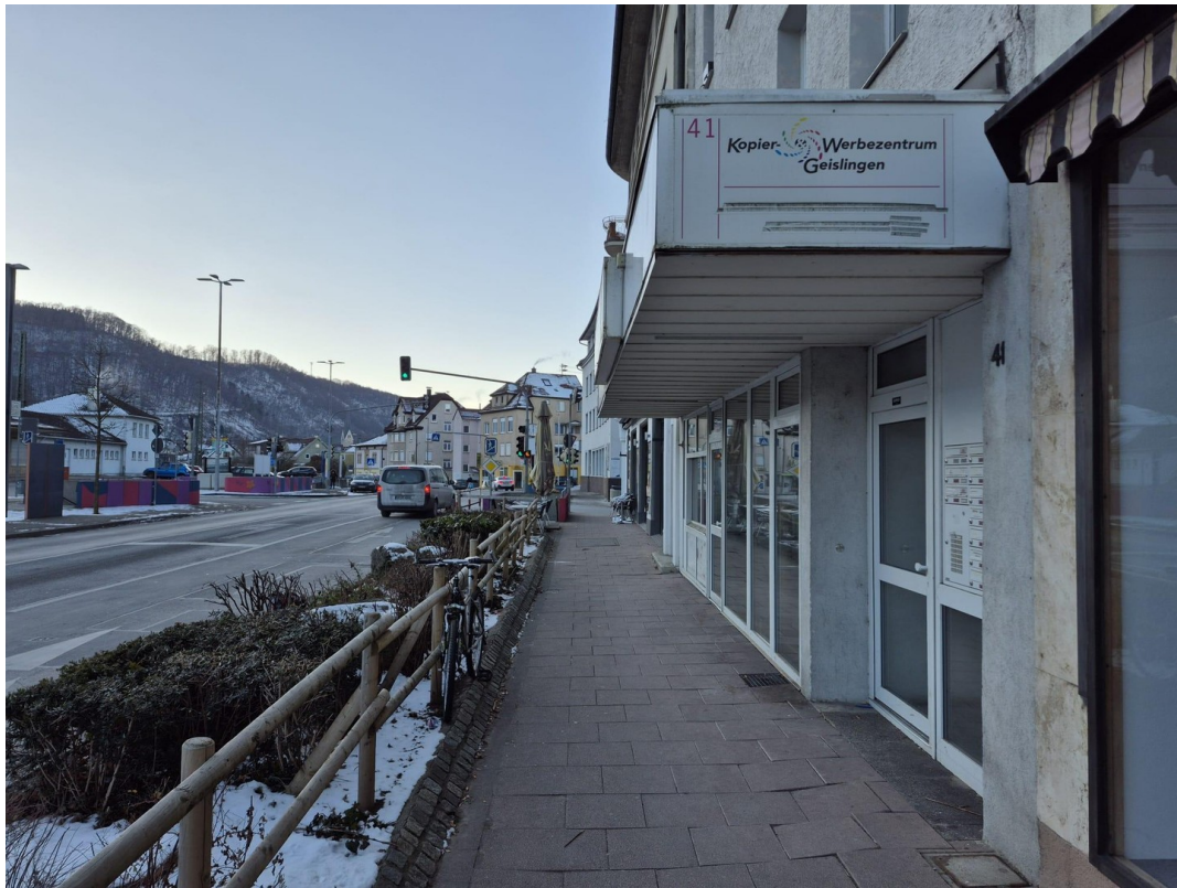
Zugang in der Bahnhofstraße