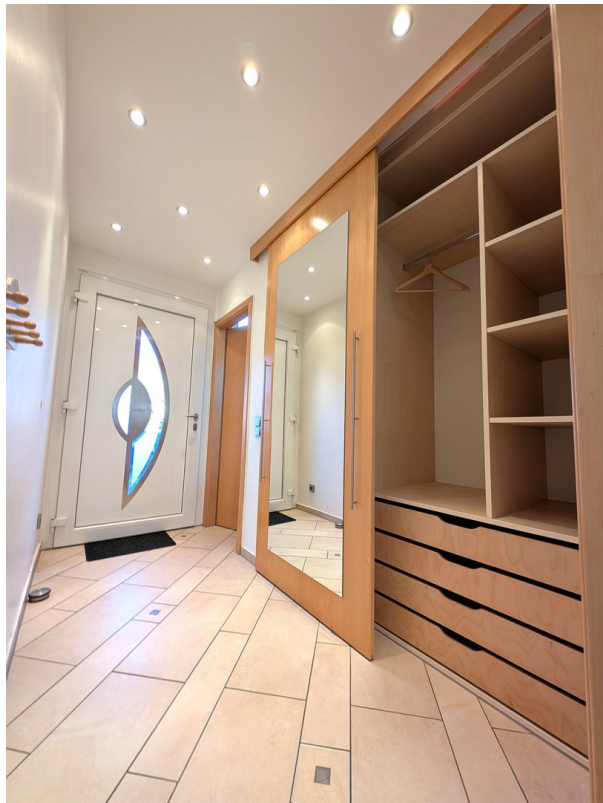
Flur mit Einbauschränk