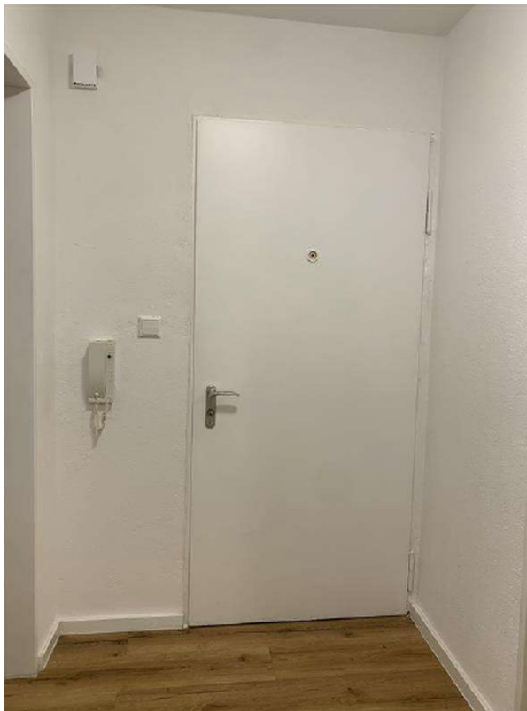
Diele / Eingangsbereich