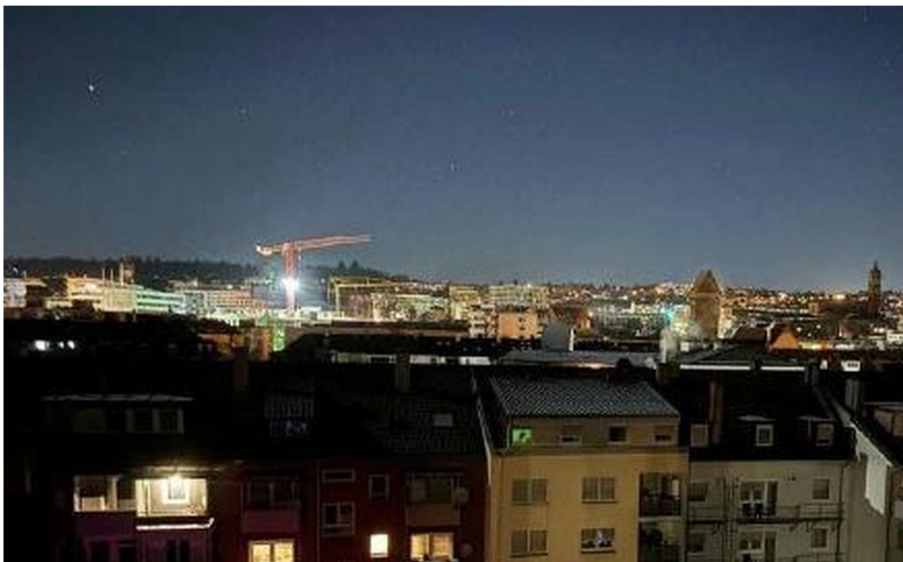
Aussicht bei Nacht