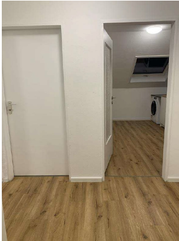
Diele / Flur