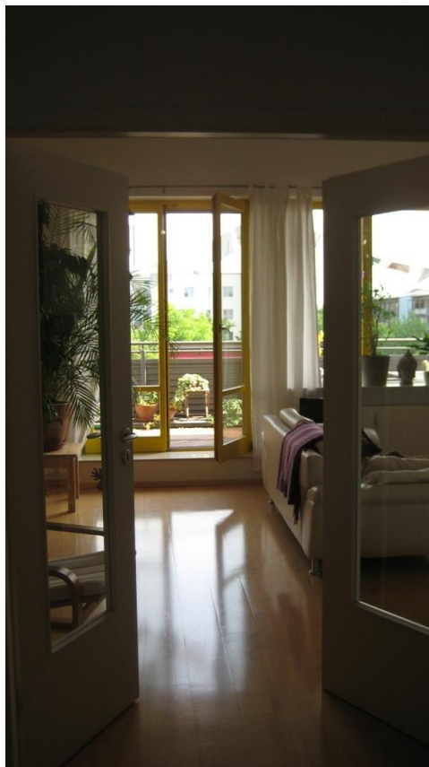
Blick in Wohnzimmer