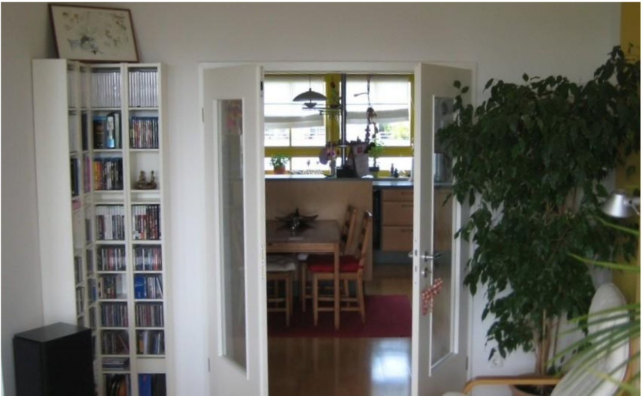
Blick Richtung Küche