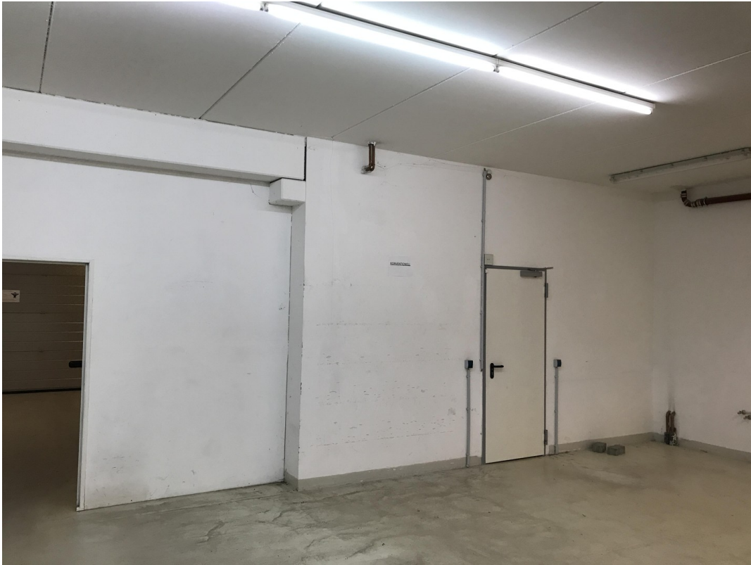
WERKSTATT / HALLE