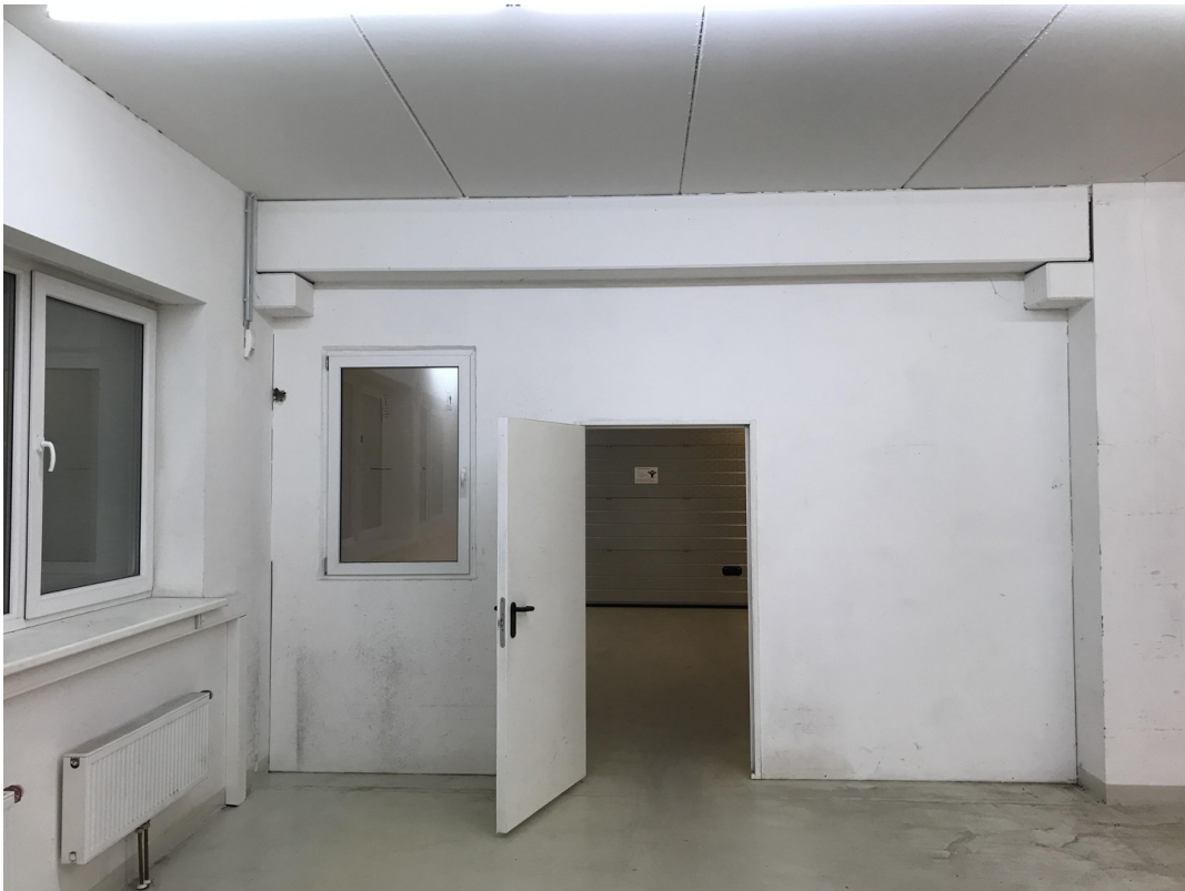
WERKSTATT / HALLE