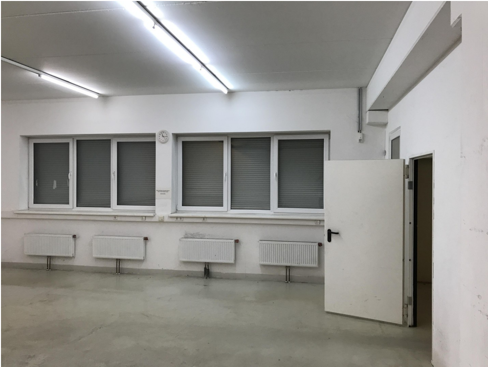
WERKSTATT / FENSTER