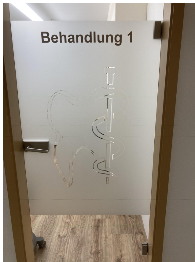
Eingang Behandlungszimmer 1