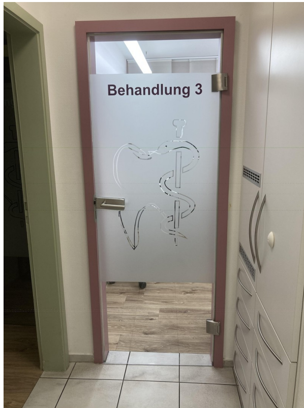
Eingang Behandlungszimmer 3