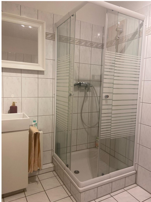
Dusche im Badezimmer