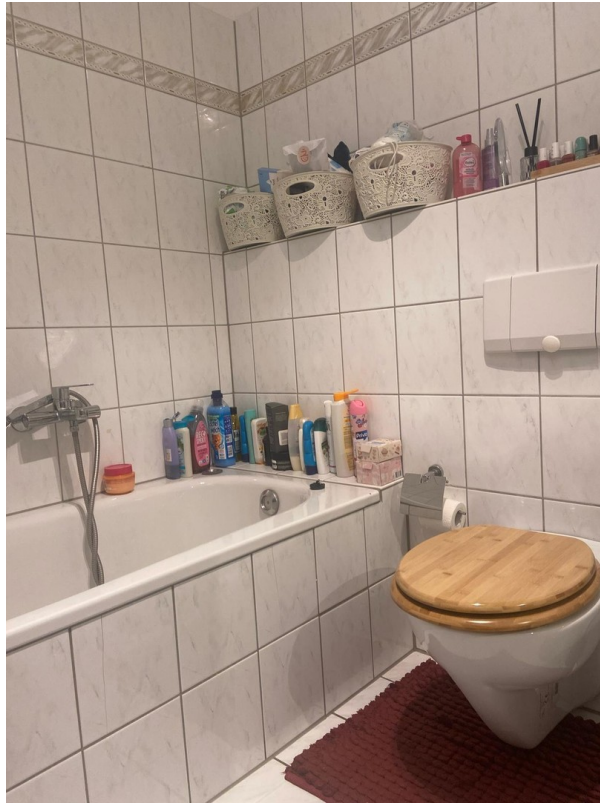
Badewanne im Badezimmer