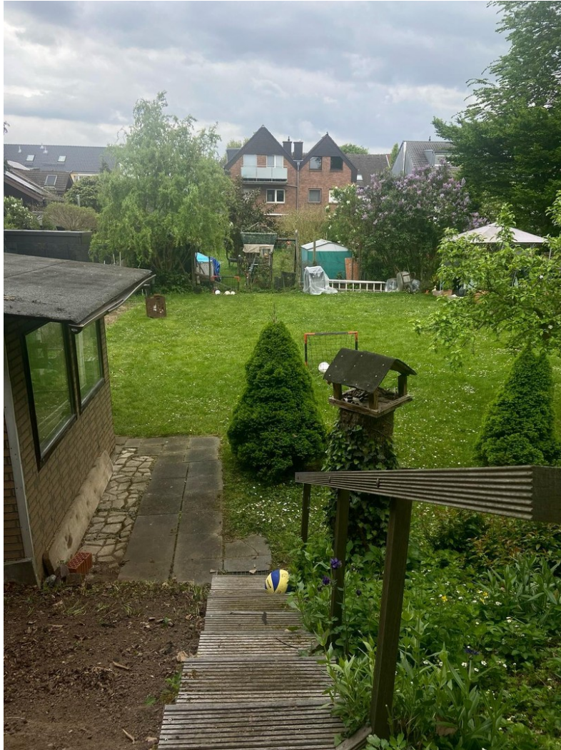
Direkter Zugang zum Garten