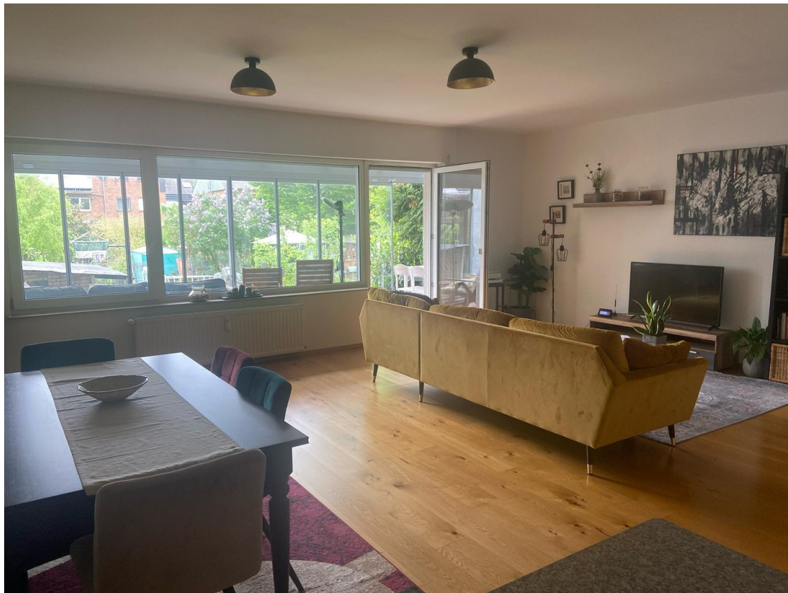
Blick in den Wohn-/Essbereich