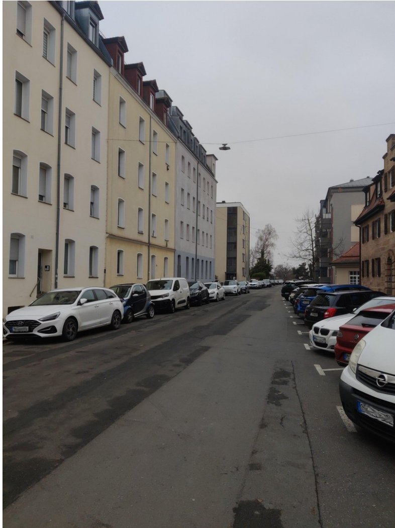
Straße Richtung Stadtpark