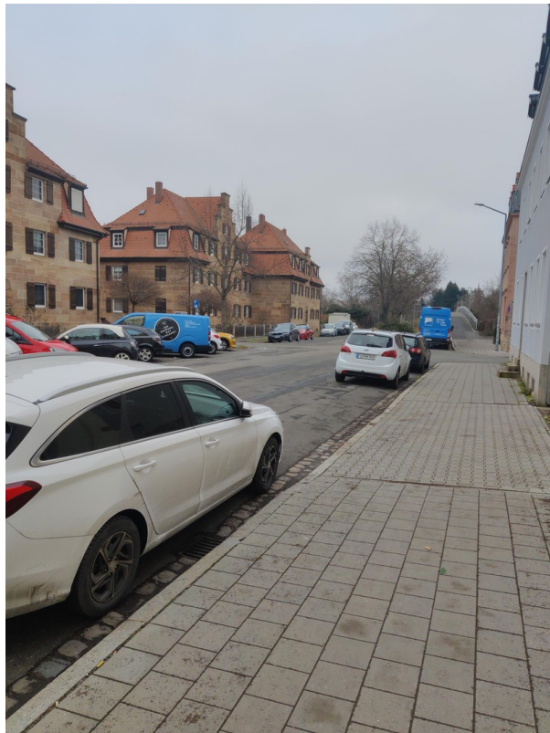
Straße Richtung Heubrücke