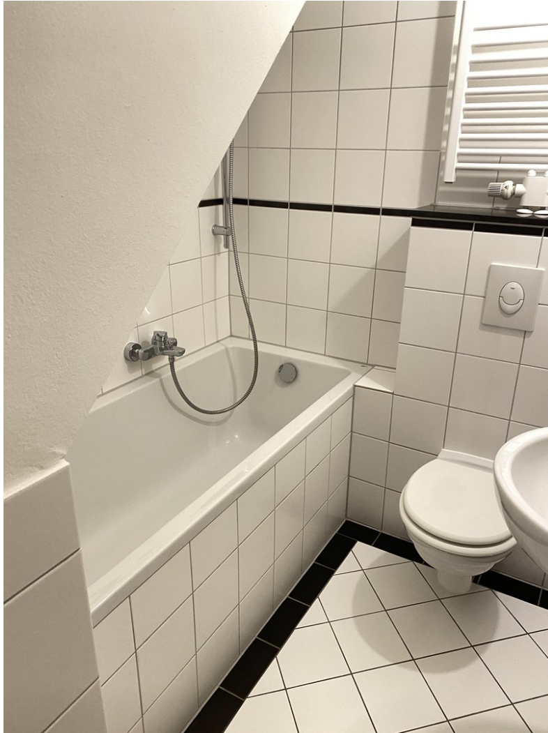
Bad fertig -Beispiel Bild