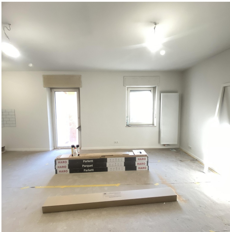
Wohnraum mit Küche