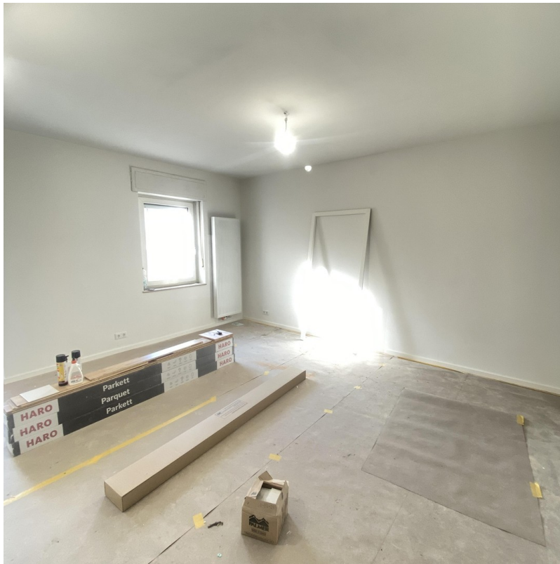
Wohnraum mit Küche