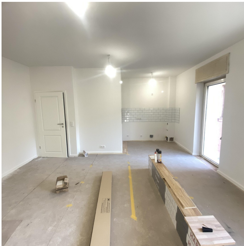
Wohnraum mit Küche