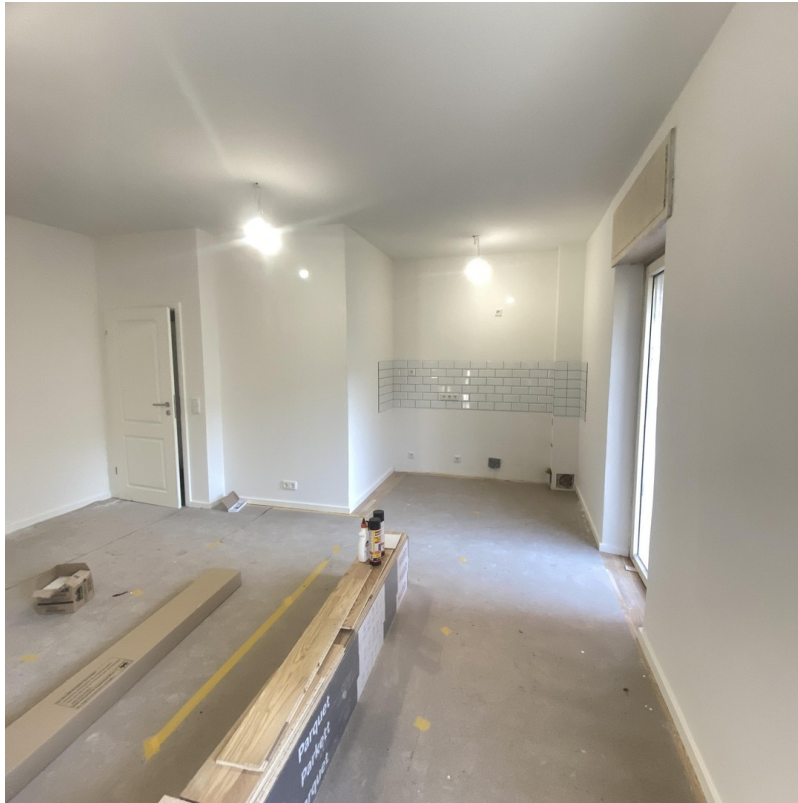
Wohnraum mit Küche