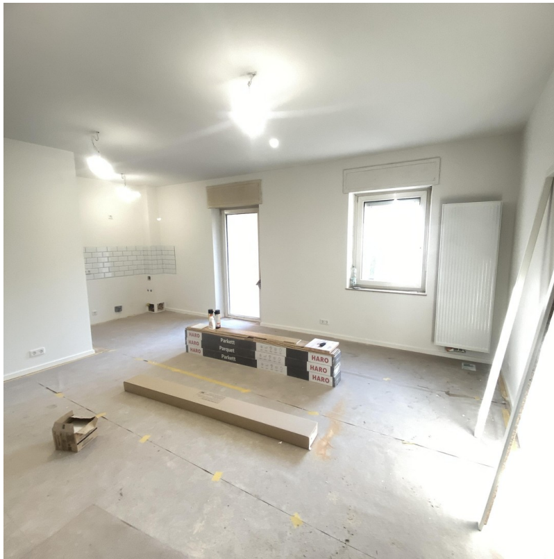
Wohnraum mit Küche