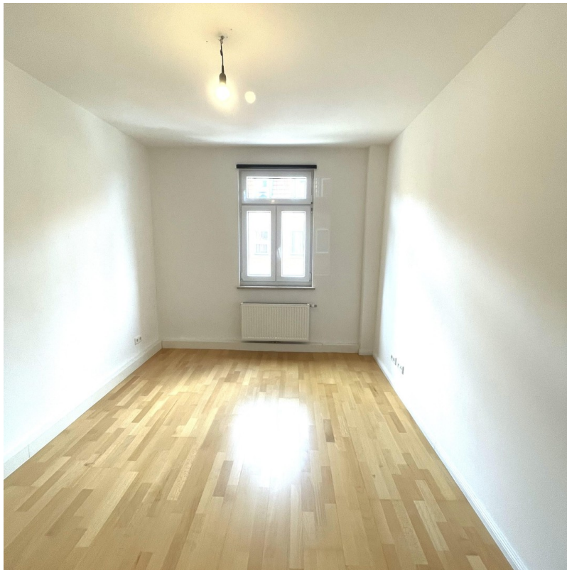
Boden-Parkett- Beispiel Bild