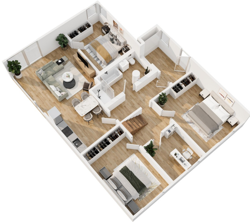
3D Grundriss Haus