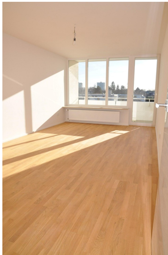
Wohnzimmer & Balkon