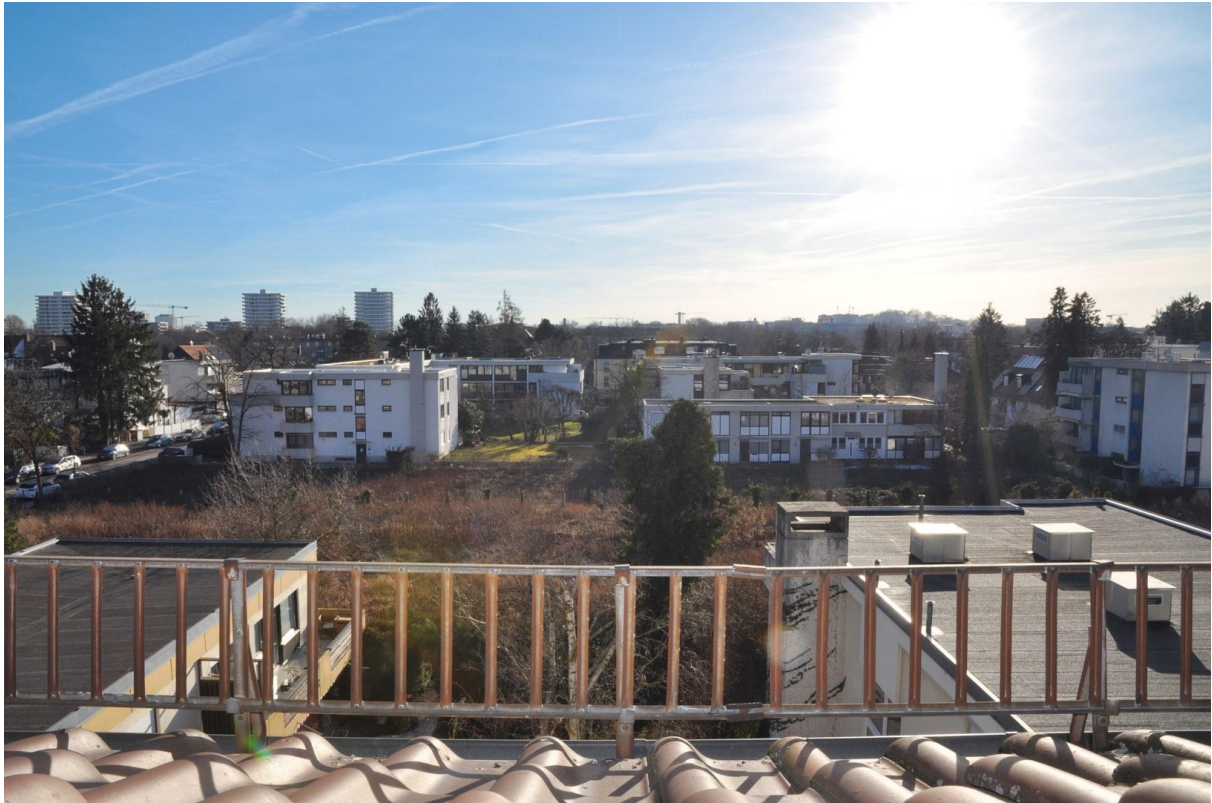
Blick aus dem Schlafzimmer