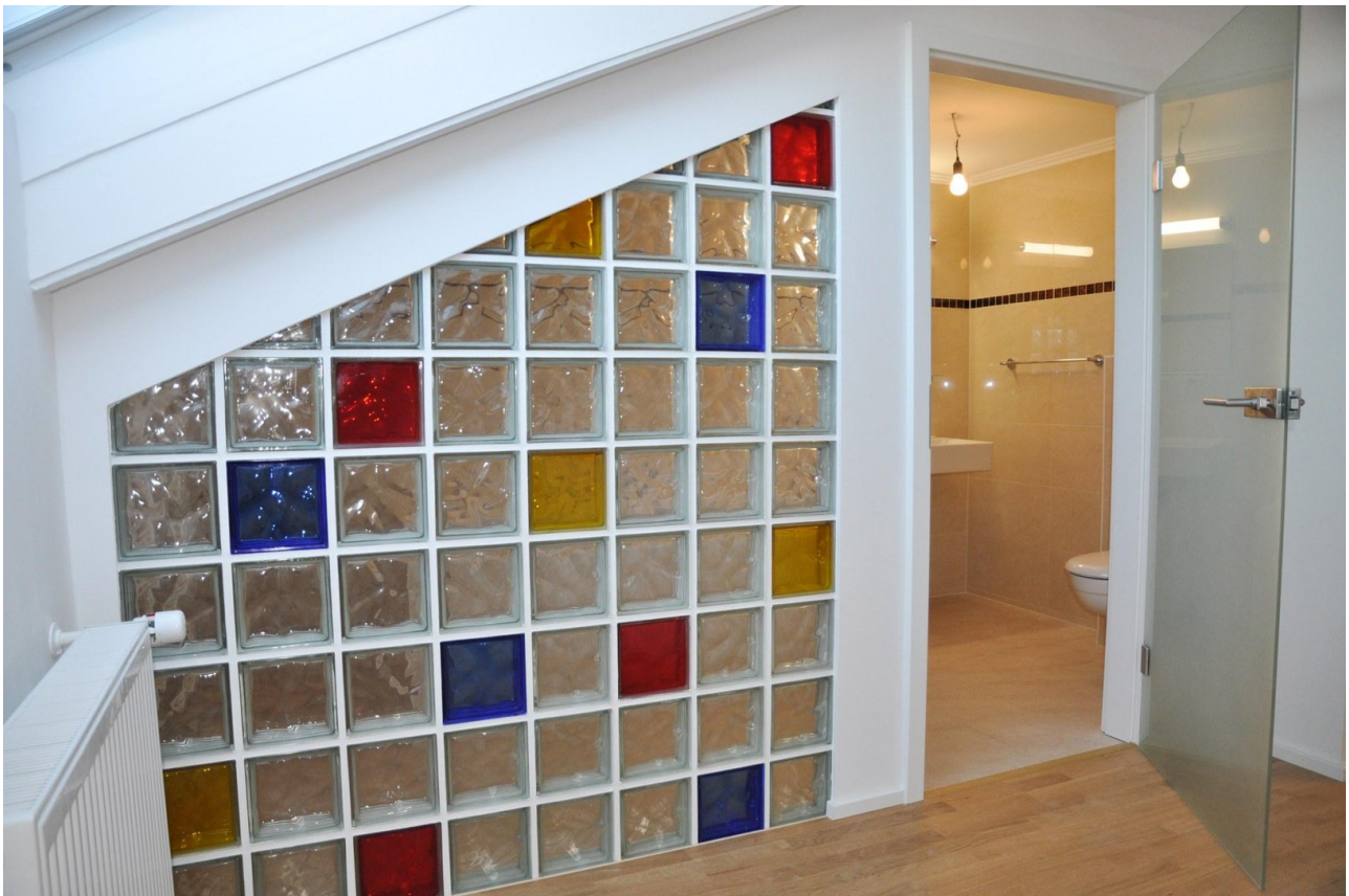
Blick in das Bad