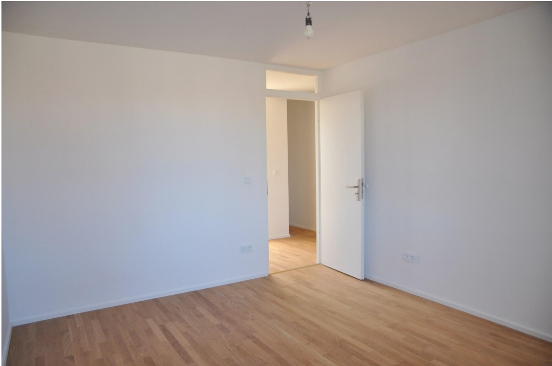
Blick aus 2. Schlafzimmer