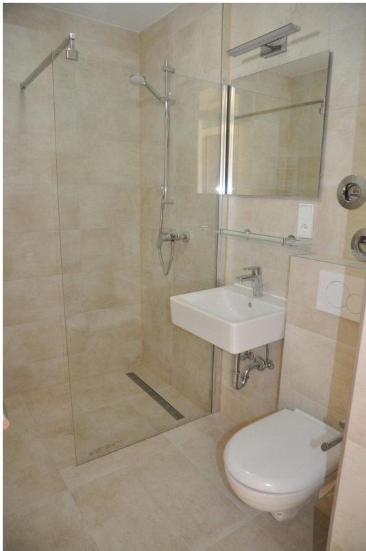
Bad mit begehbare Dusche