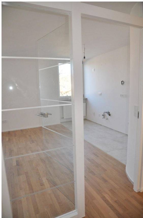
Blick in Wohnküche/Essbereich