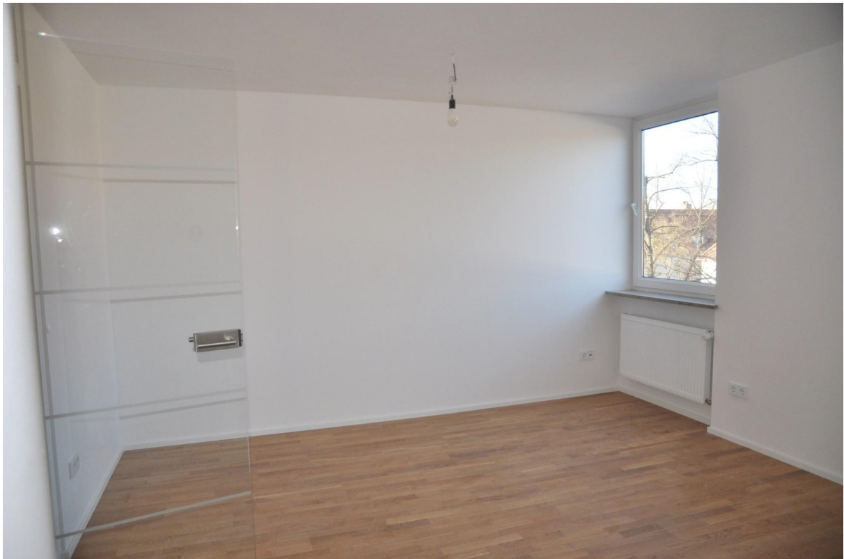
Essbereich in Wohnküche