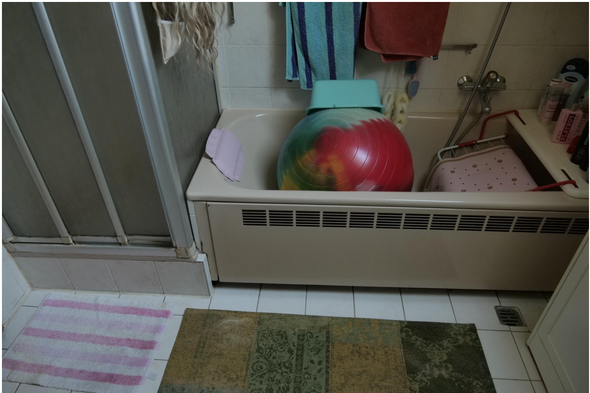
Badewanne mit Dusche