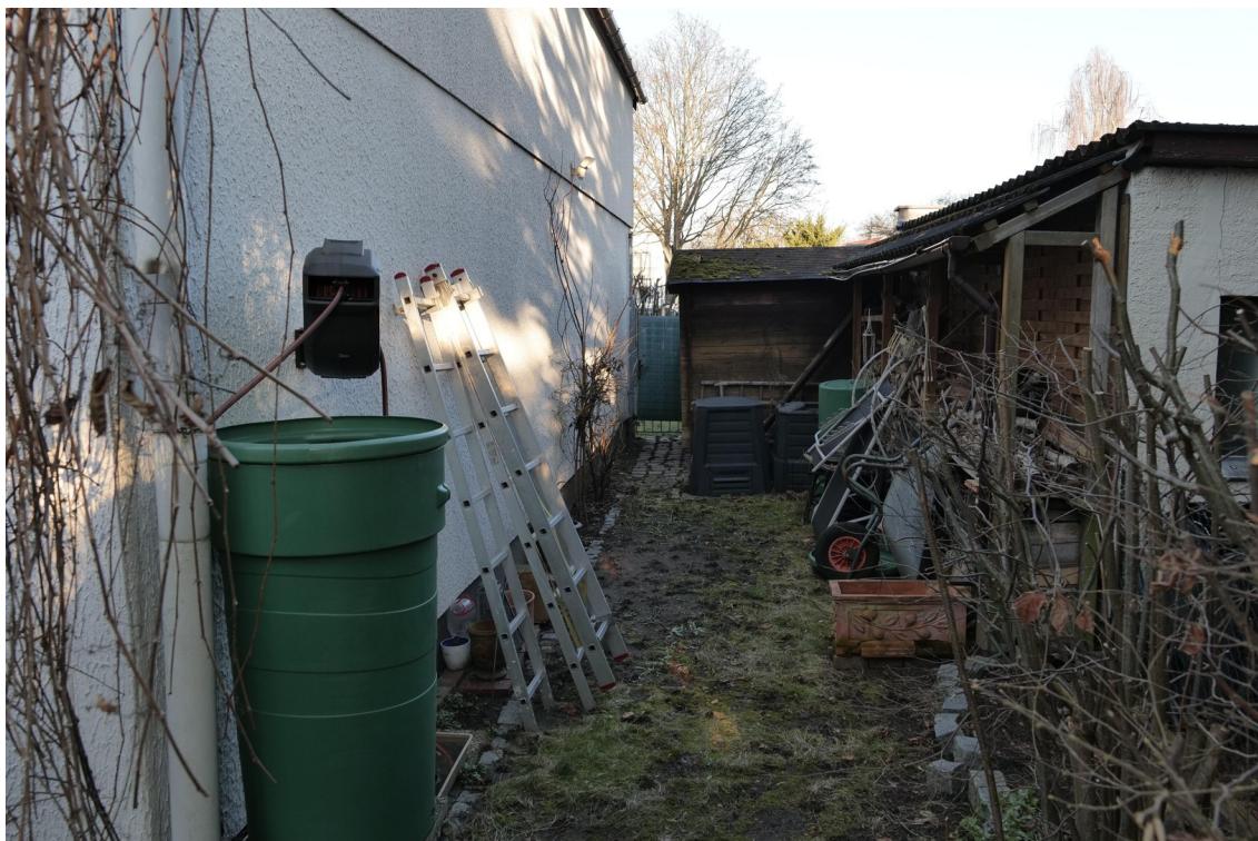
Garten an der Hausseite