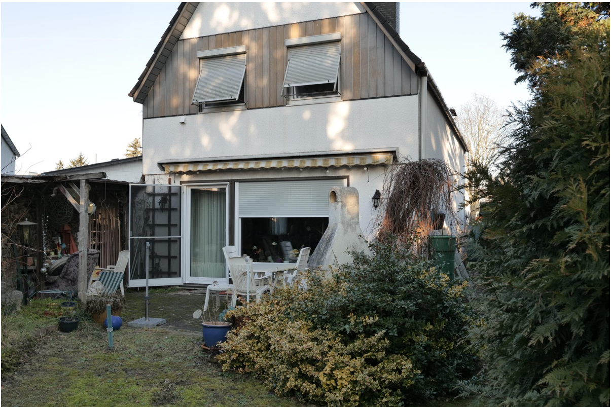
Rückseite vom Garten aus