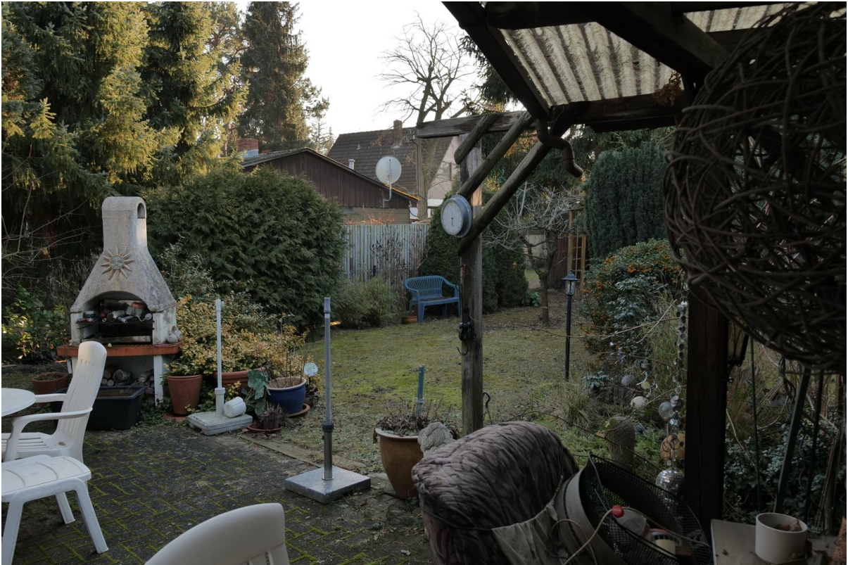
Gartenblick von der Terrasse