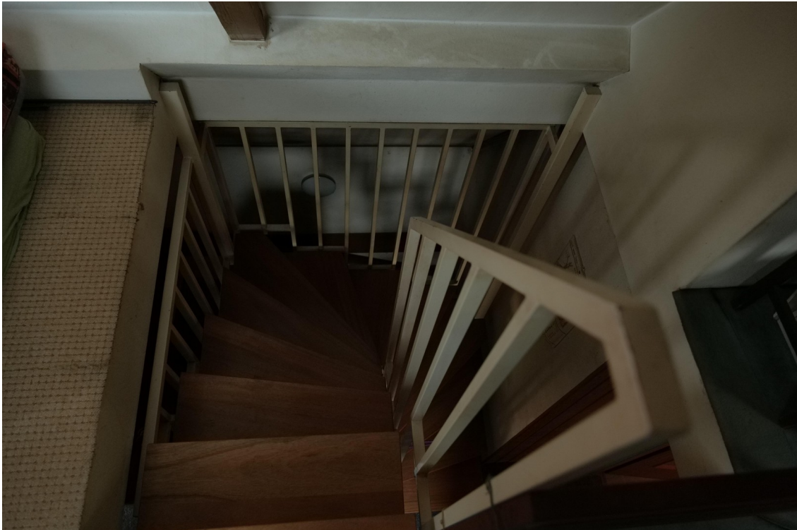
Treppe zum Dachboden