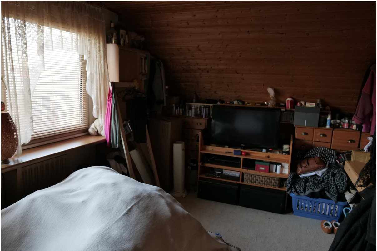
Schlafzimmer 1 -1.OG