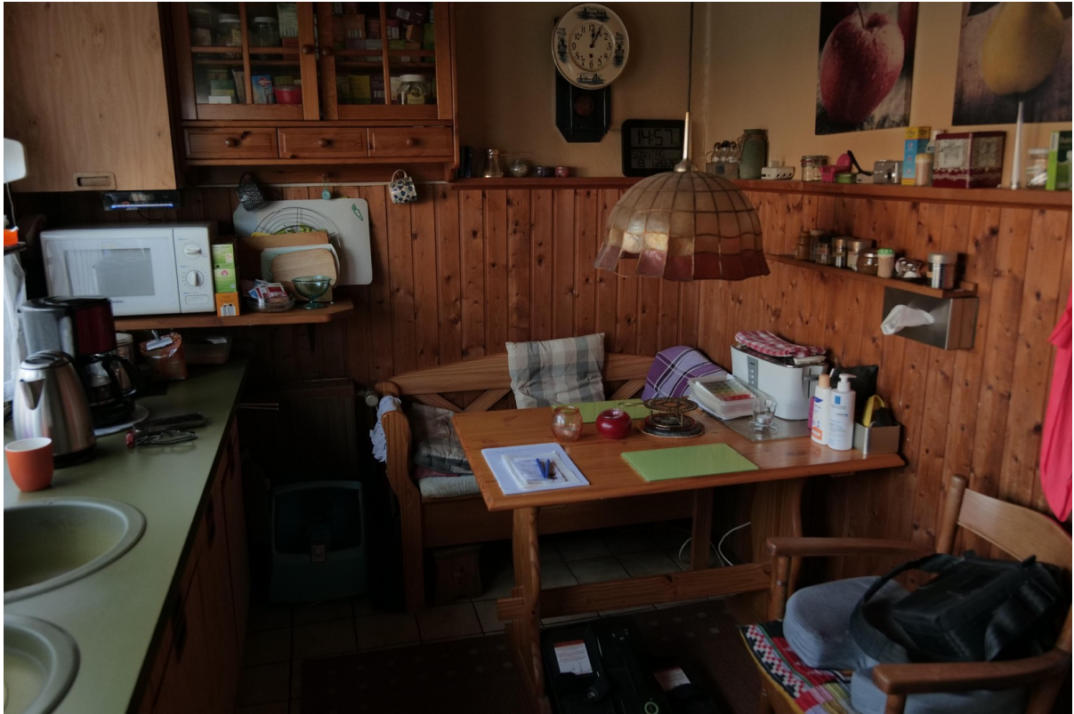
Essecke in der Küche