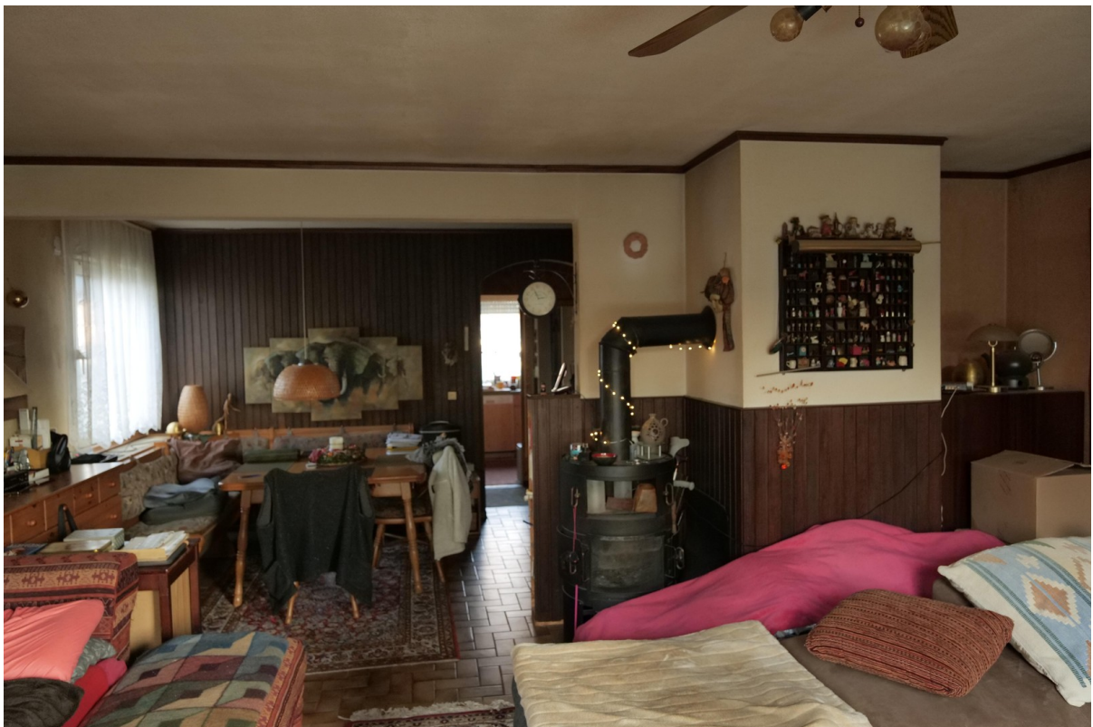
Wohnzimmer mit Holzkamin