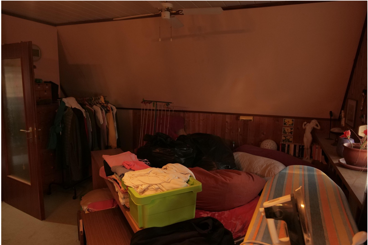
Schlafzimmer 2 -1.OG