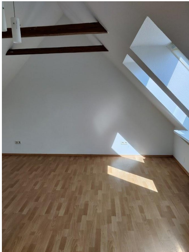
Zimmer im Dachgeschoss