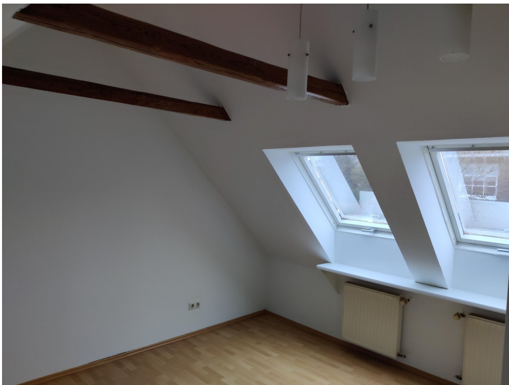
Zimmer im Dachgeschoss