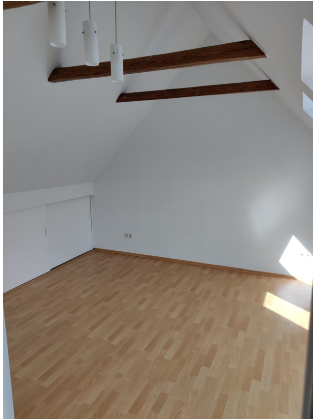
Zimmer im Dachgeschoss