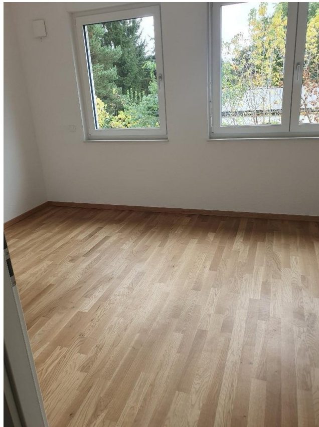
noch nicht möbliertes Zimmer