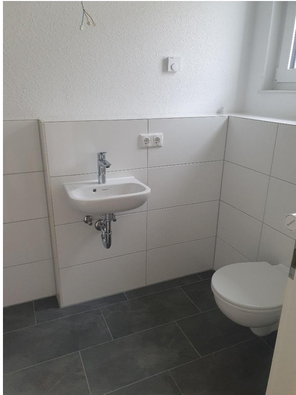
WC und Dusch