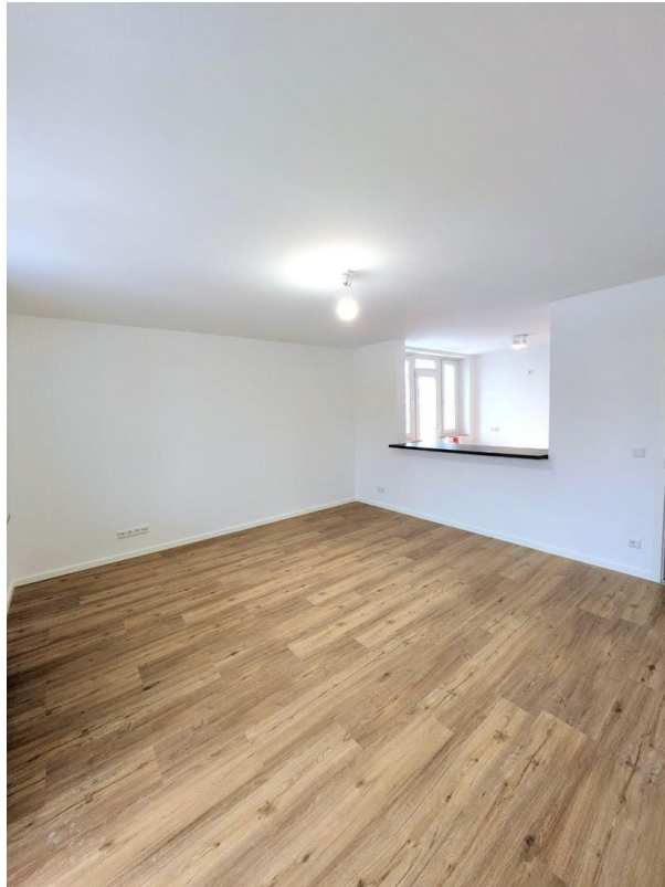
Wohnzimmer / Essbereich