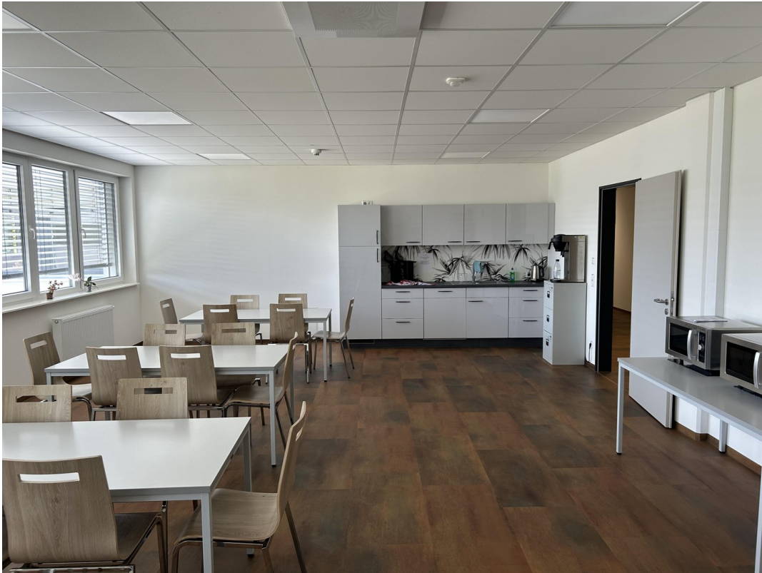
Aufenthaltsraum und Küche