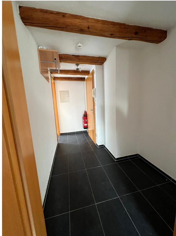
Flur / Eingangsbereich