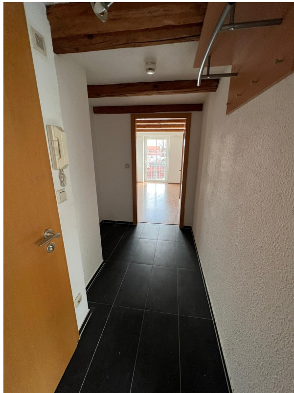
Flur / Eingangsbereich