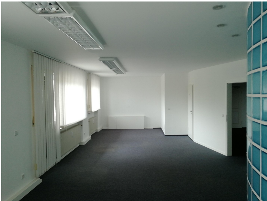
Büro Großraum für 6 - 8 Pers.