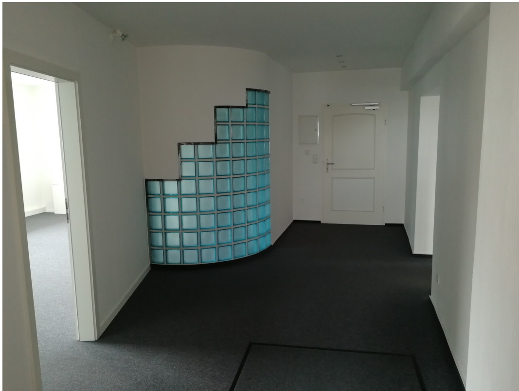
Flur mit Blick auf Büroeingang