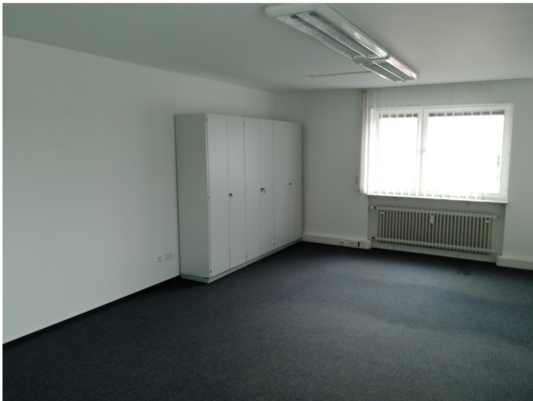
Büro für 4 Pers, Schulung/Besp