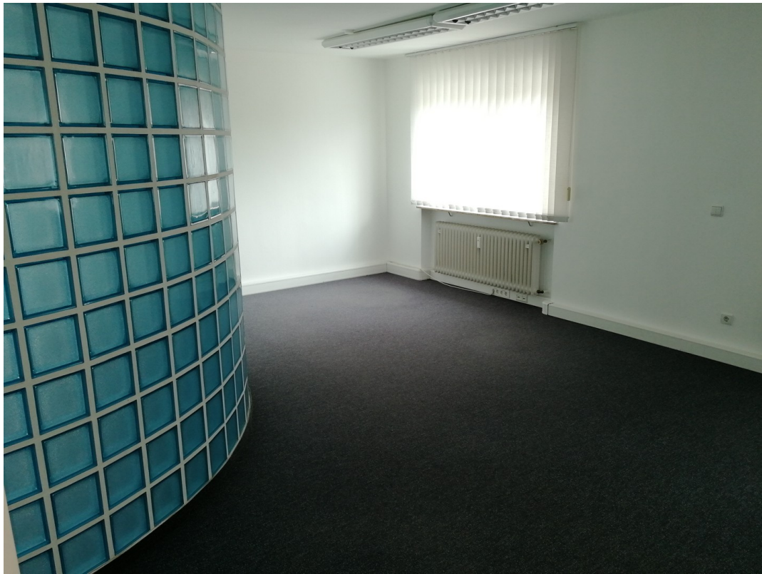
Büro Großraum für 6 - 8 Pers.