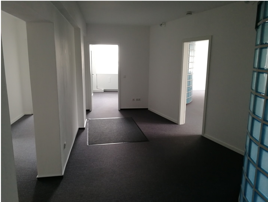
Flur vom Büroeingang