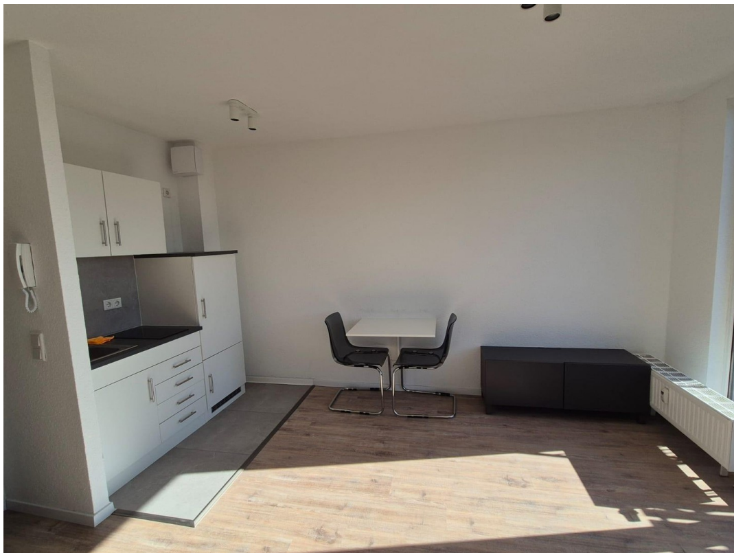
Koch- & Essbereich