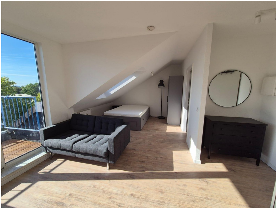
Wohn- & Schlafbereich