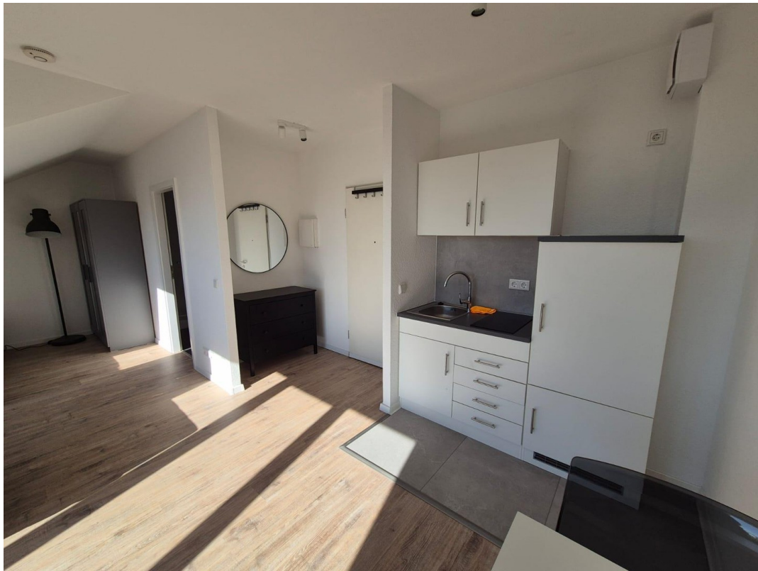
Koch- & Essbereich