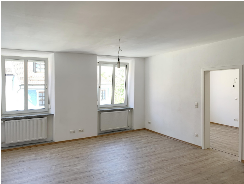
Wohnzimmer / Eingang Küche