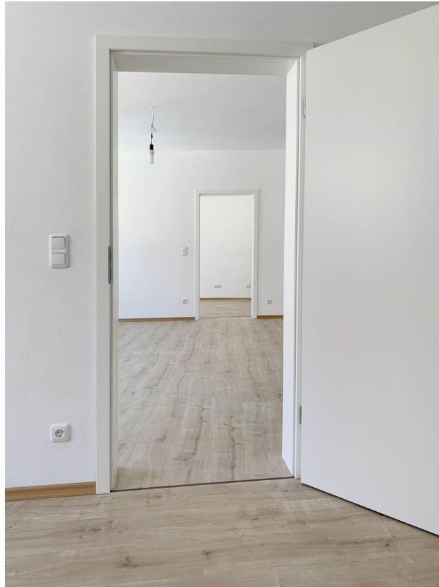
Blick Schlafen, Wohnen/Küche