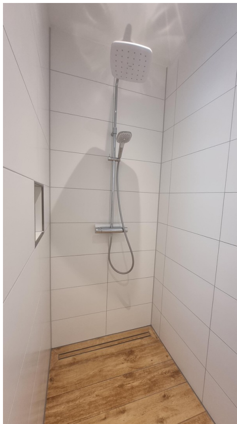
Dusche Bad OG