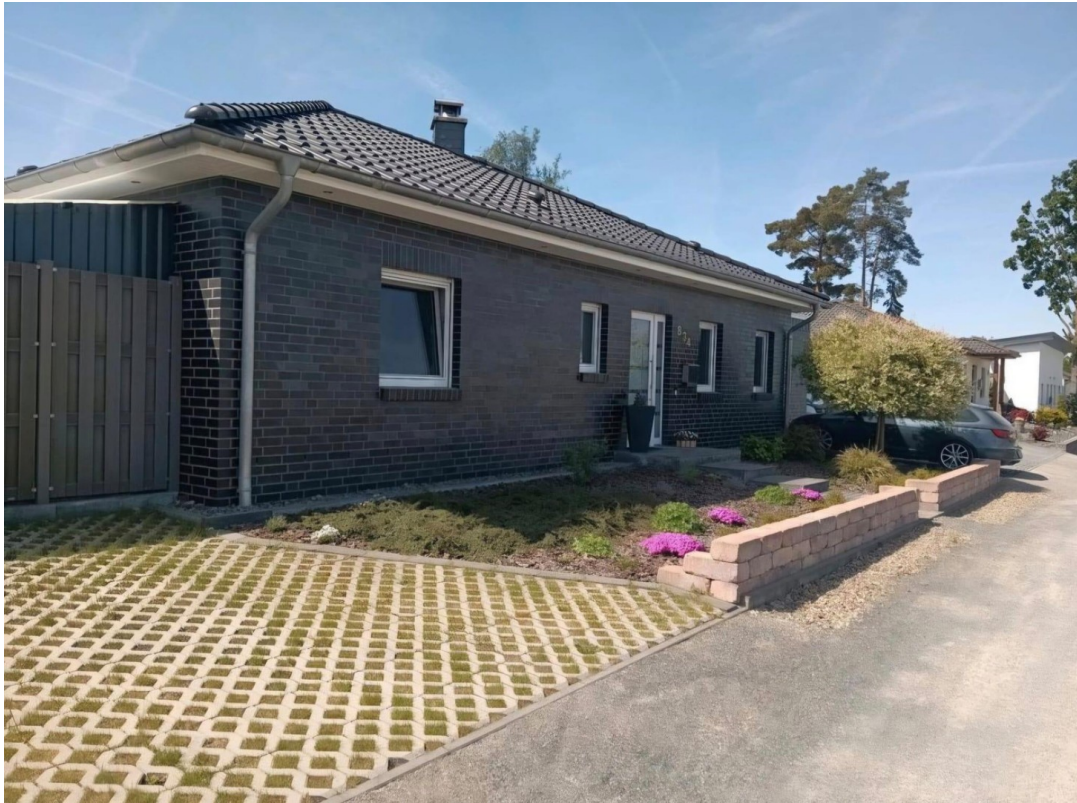
Hauseingang & Stellplatz