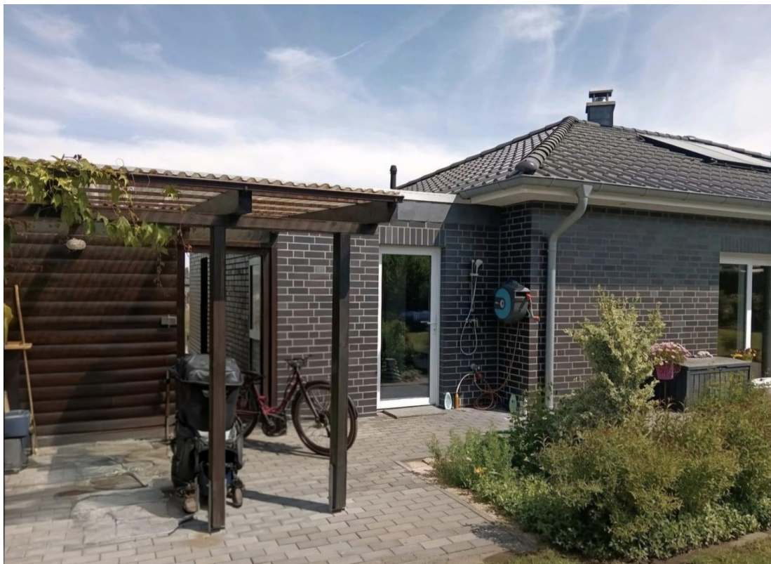
Terrasse mit Überdachung