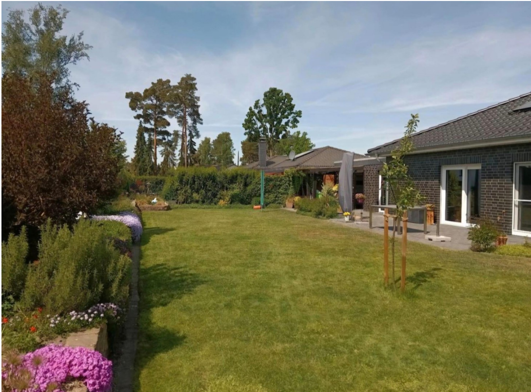
Garten & Terrasse