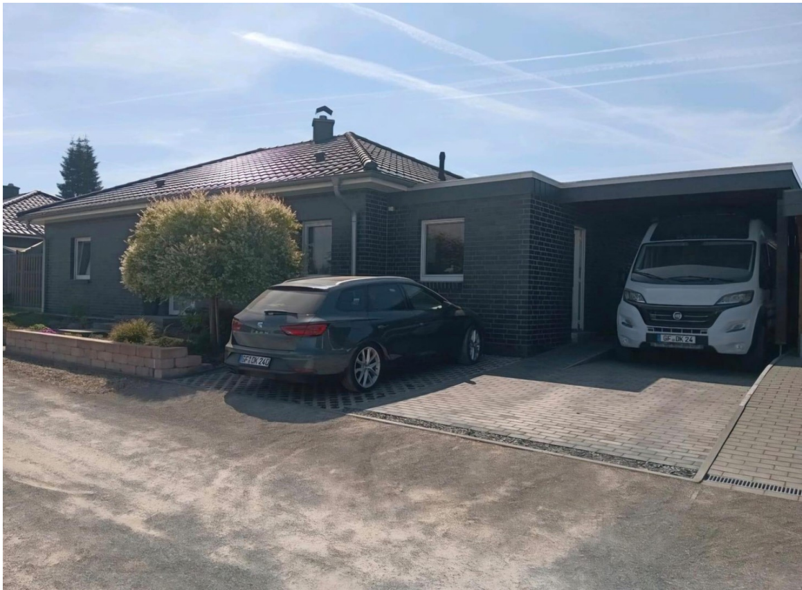
Carport & Stellplatz