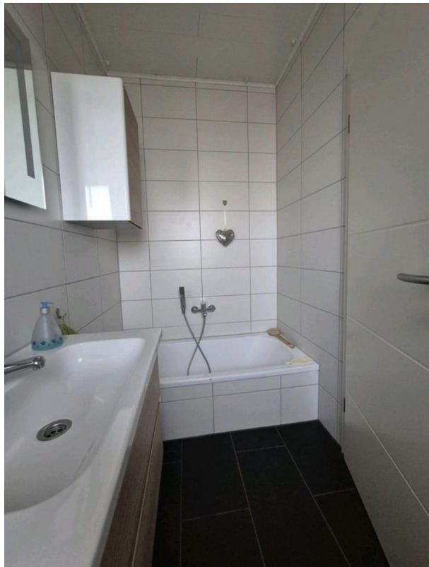
Gäste WC m. Badewanne