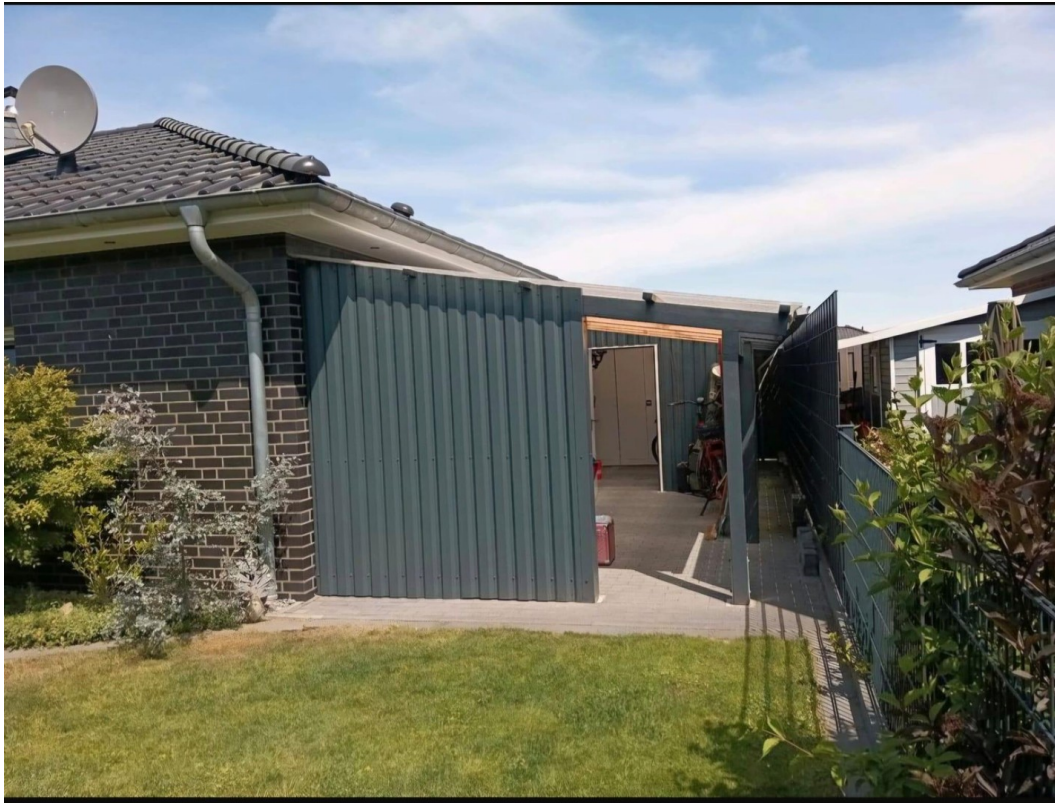
Schuppen offen & abschließbar