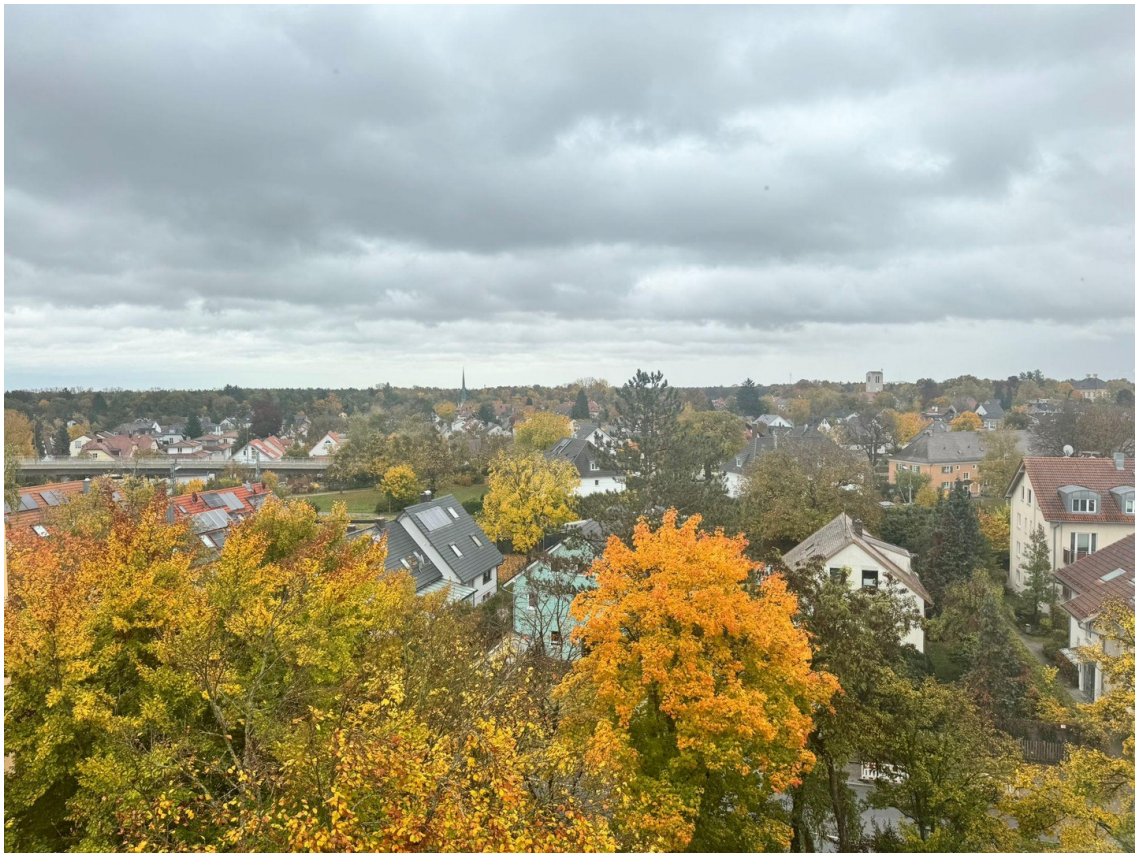
Ausblick aufs Schloss