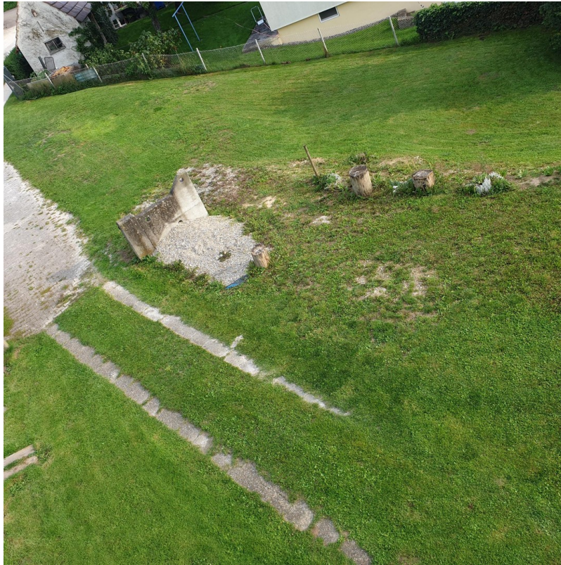
Blick nach SüdOst