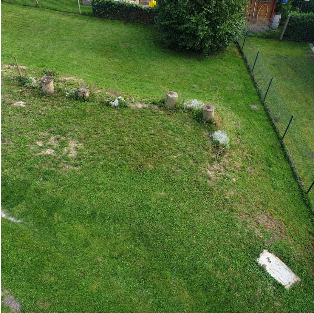
Blick nach Süd