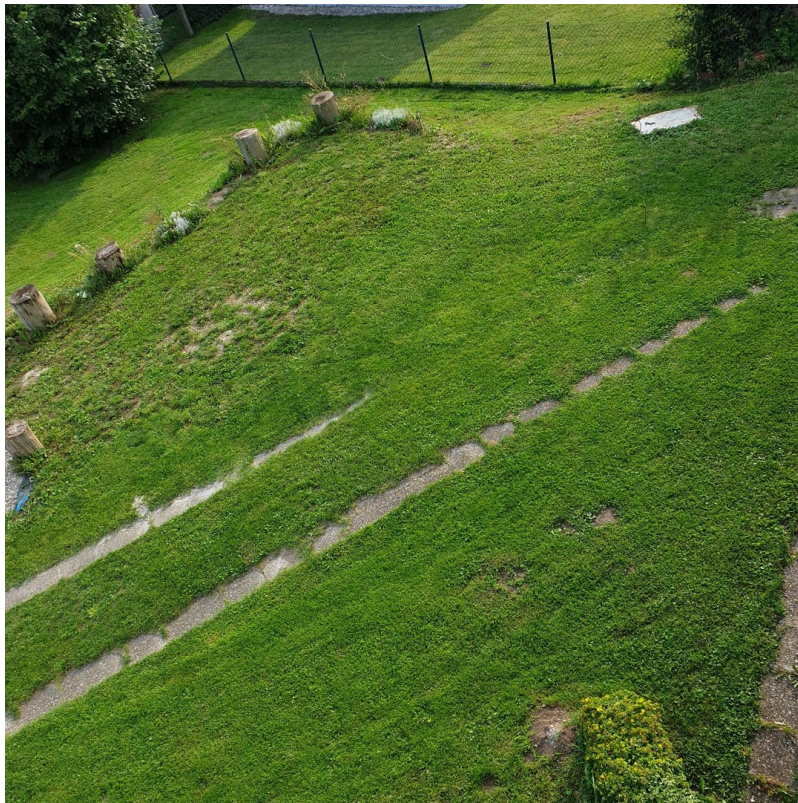
Blick nach West