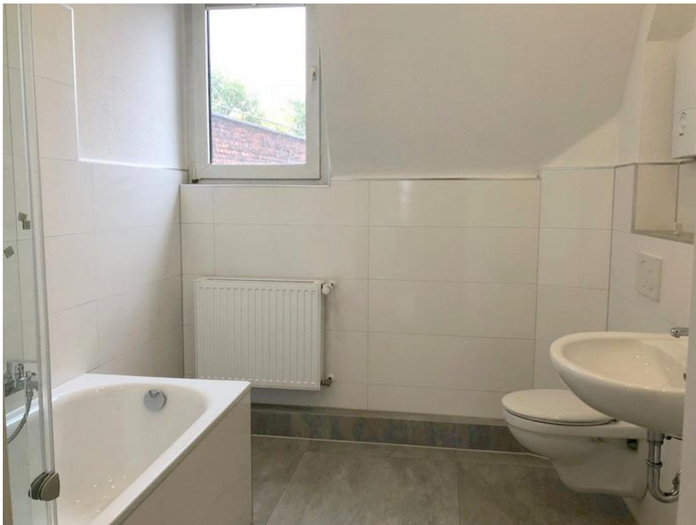
Bad mit Fenster