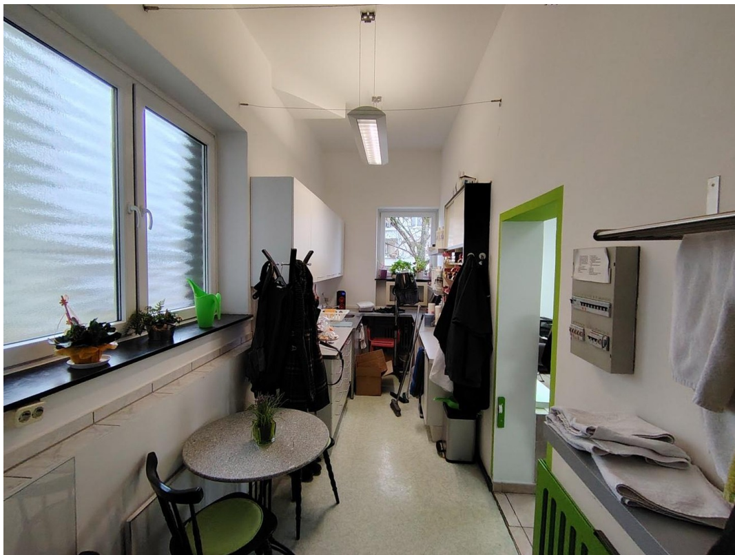
Blick in Küche / Lager