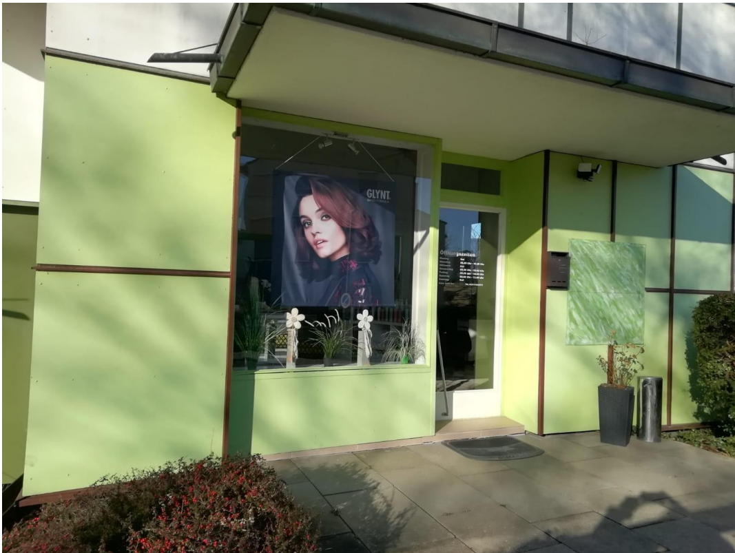
Eingang mit kl. Terrasse