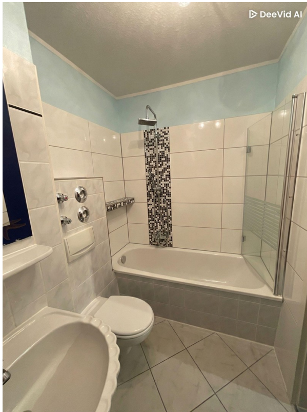
Bad (KI gen. persönlich. Geg.)