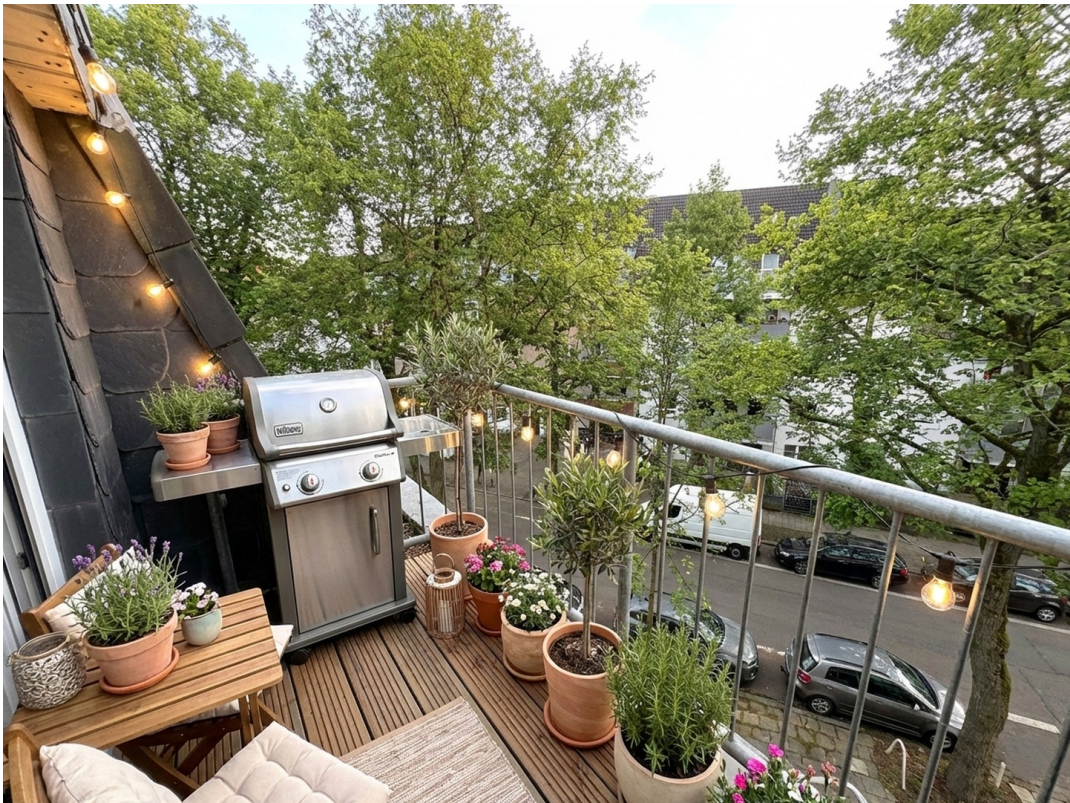
Balkon Küche (KI-möbliert)