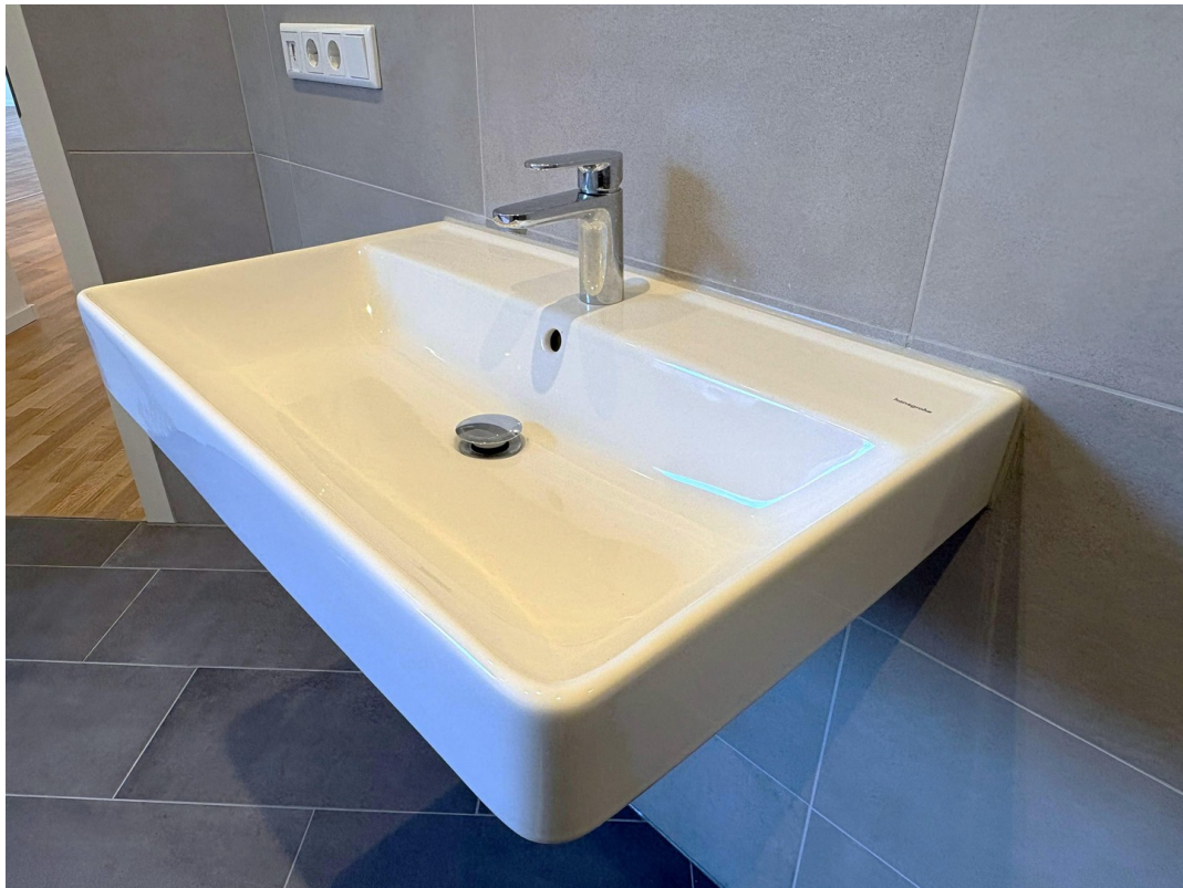
Bad - großes Waschbecken