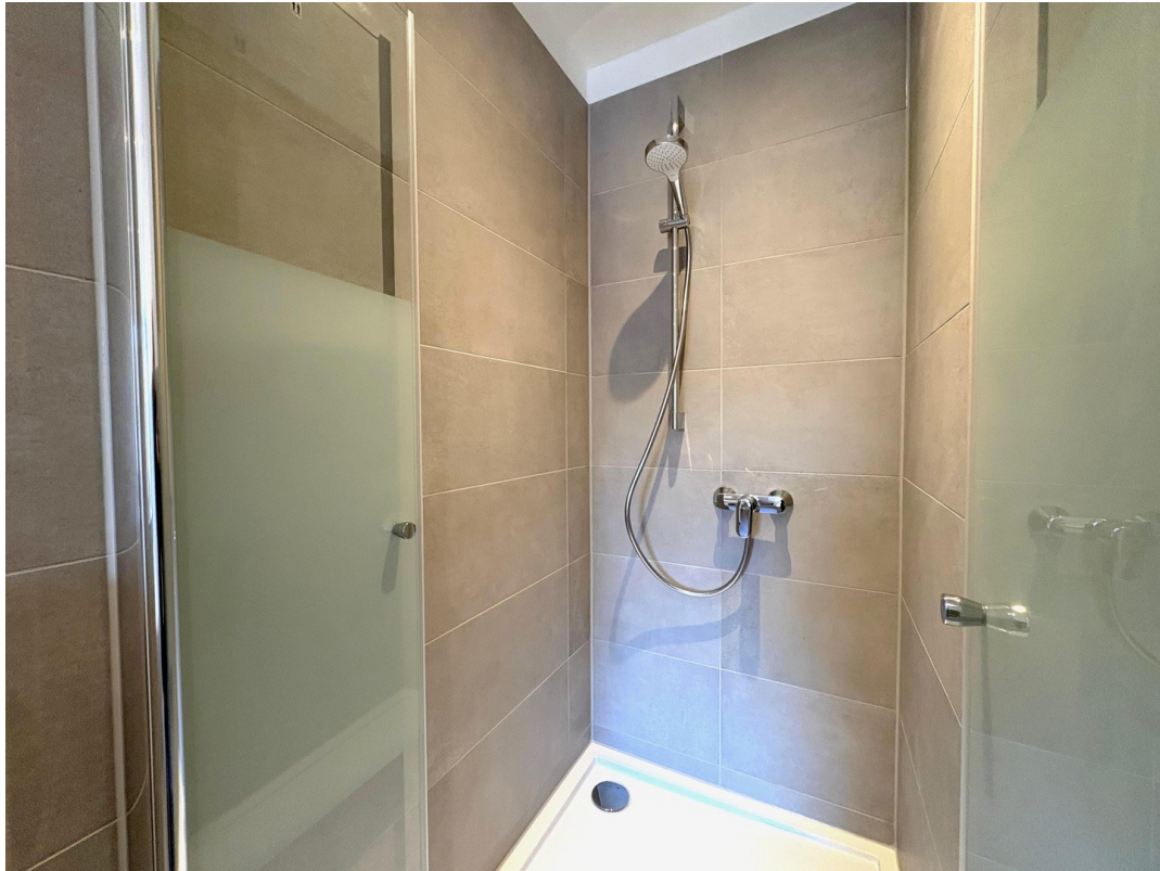
Bad - Dusche