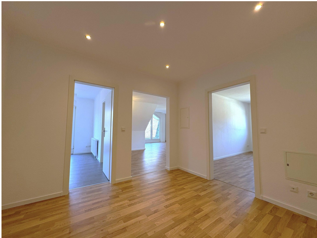
Flur > Küche, WZ, SZ2