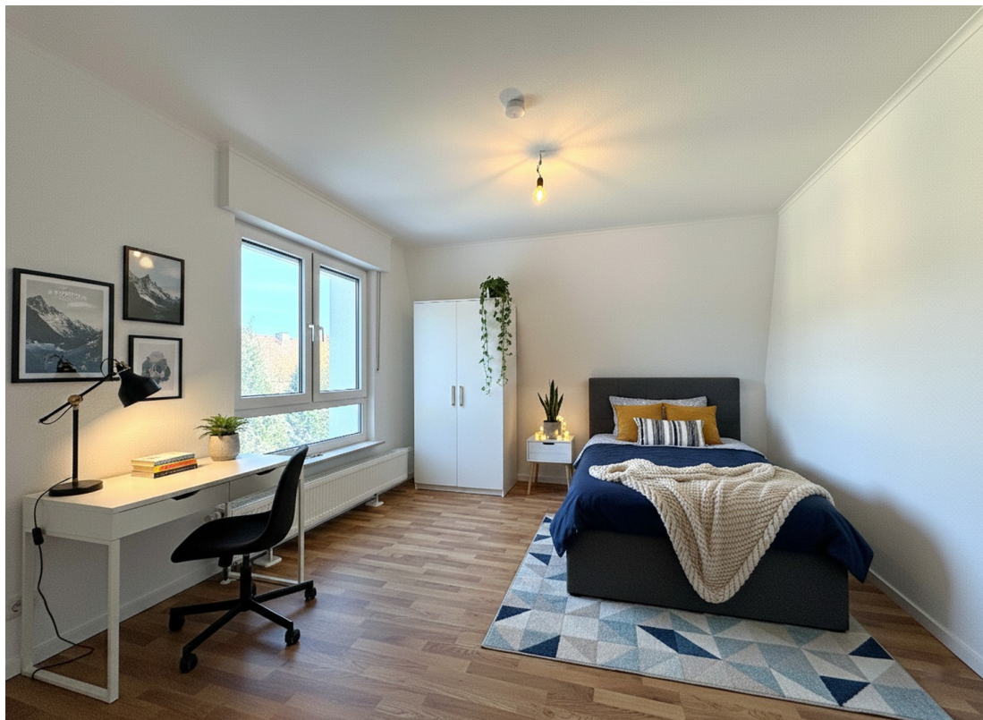
Schlafzimmer 1 (KI-möbliert)