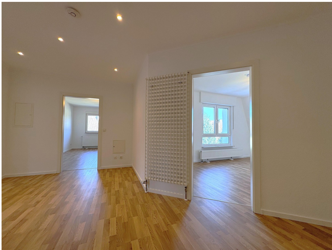
Flur > Schlafzimmer