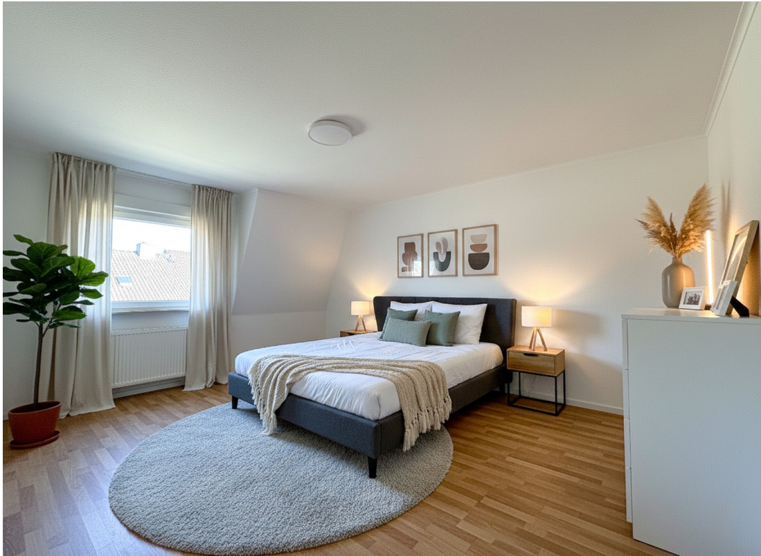
Schlafzimmer 2 (KI-möbliert)