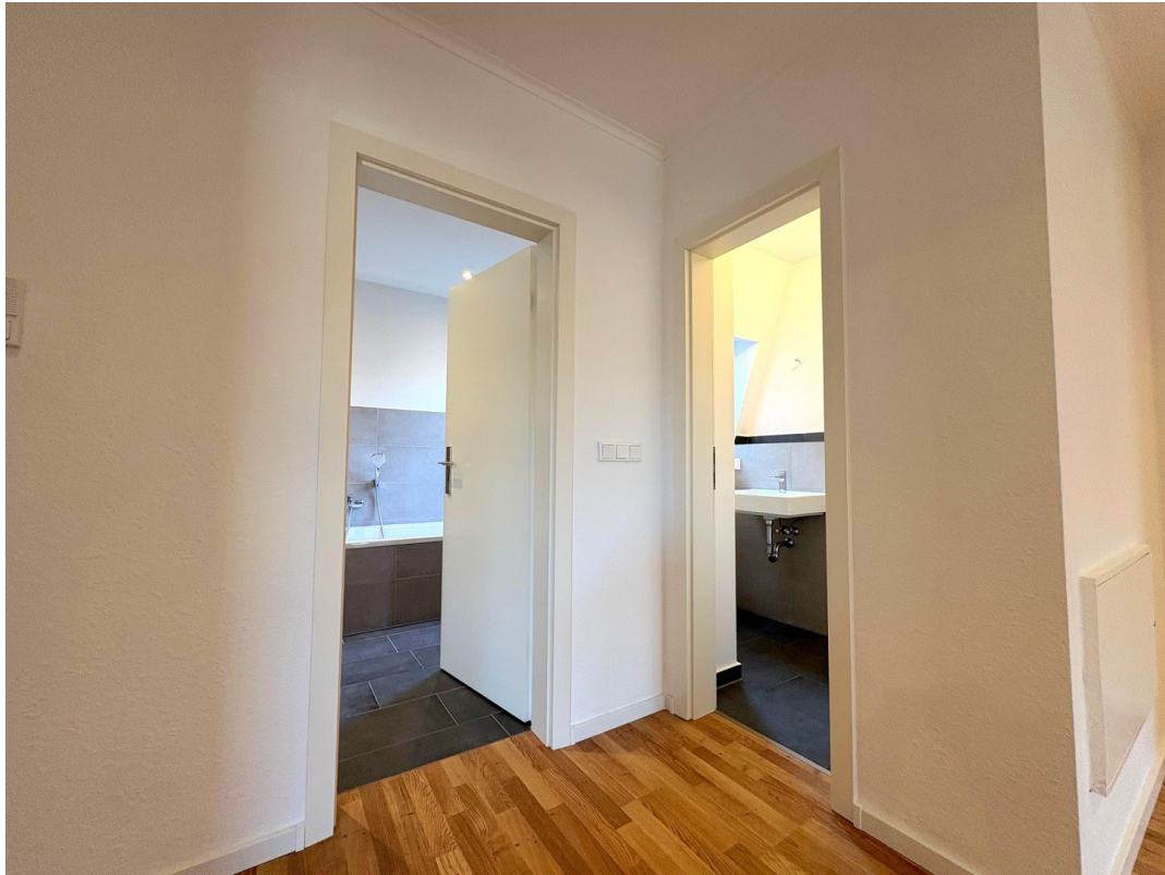
Flur > Bäder