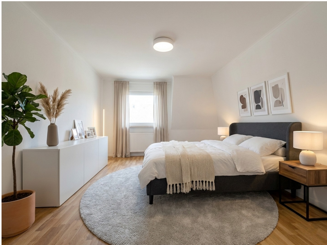
Schlafzimmer 2 (KI-möbliert)