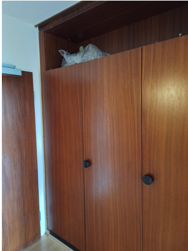
Einbauschränk im Flur