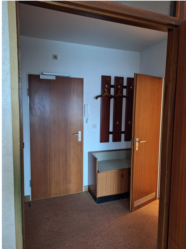
Flur und Eingangstür