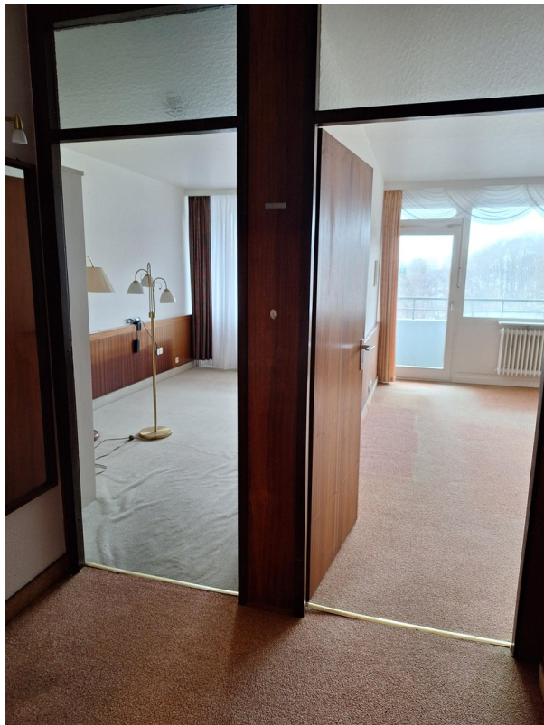
Blick vom Flur in die beiden Z