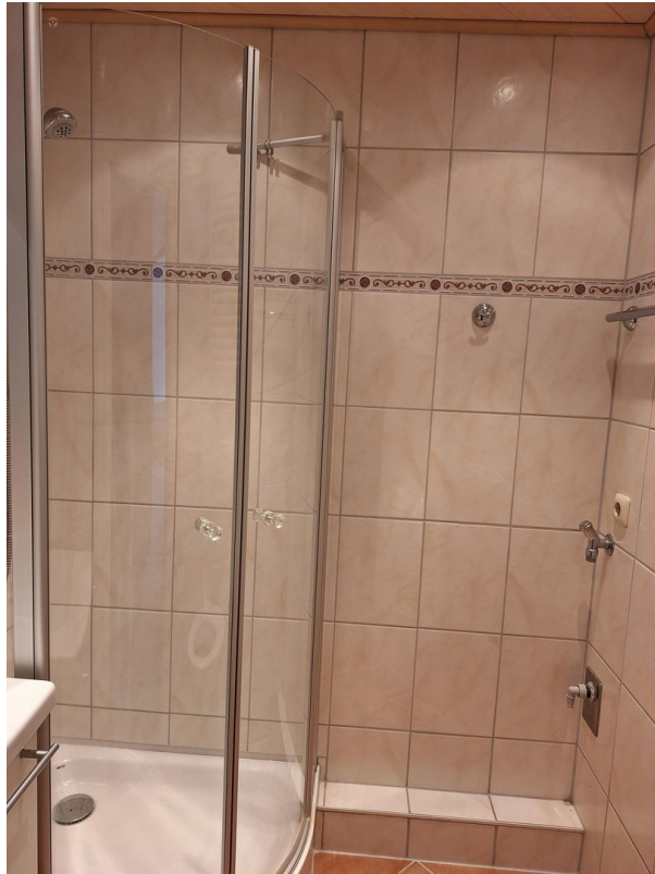
Badezimmer -Platz für Waschm