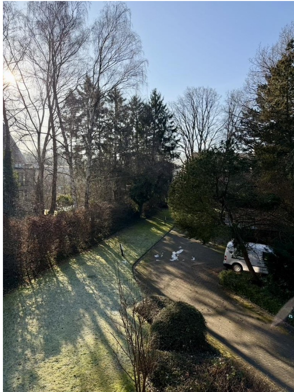
Aussicht vom Balkon