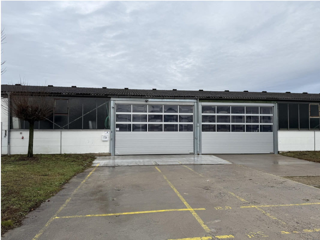
Zugang zu Storage Boxen