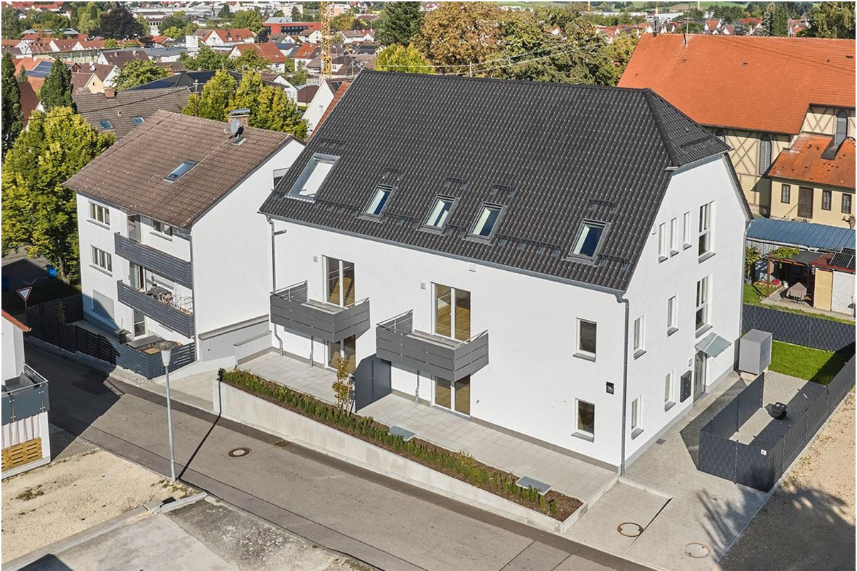
Neubau und Bestand