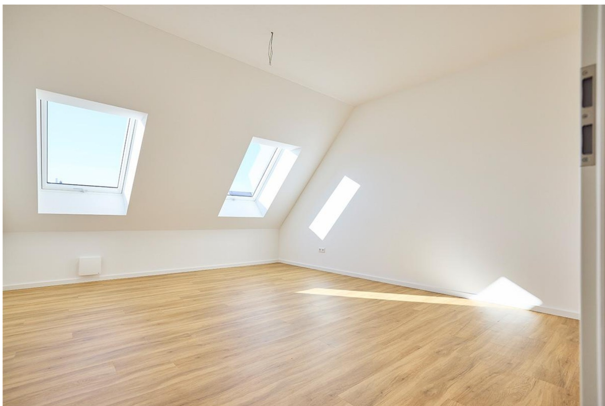
Schlafzimmer 2 / Büro