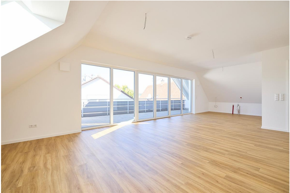
Blick in die Wohnküche