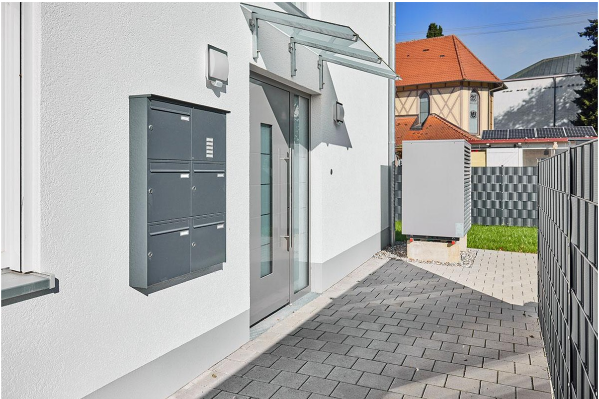
Eingang zum Neubau