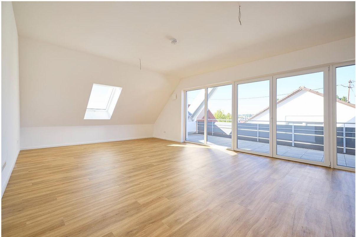
Blick ins Wohn-/Esszimmer