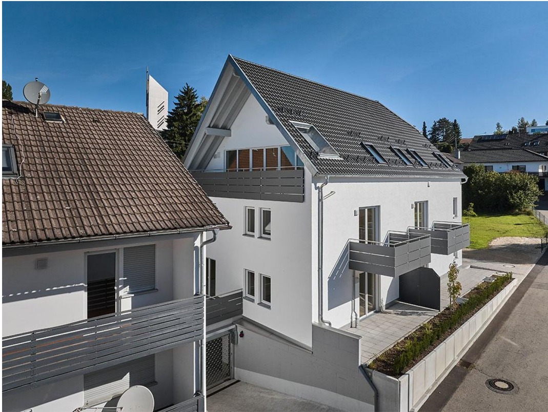
Mit großzügiger Loggia