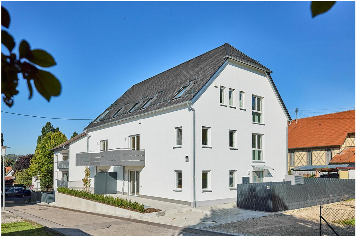
Blick auf den Neubau