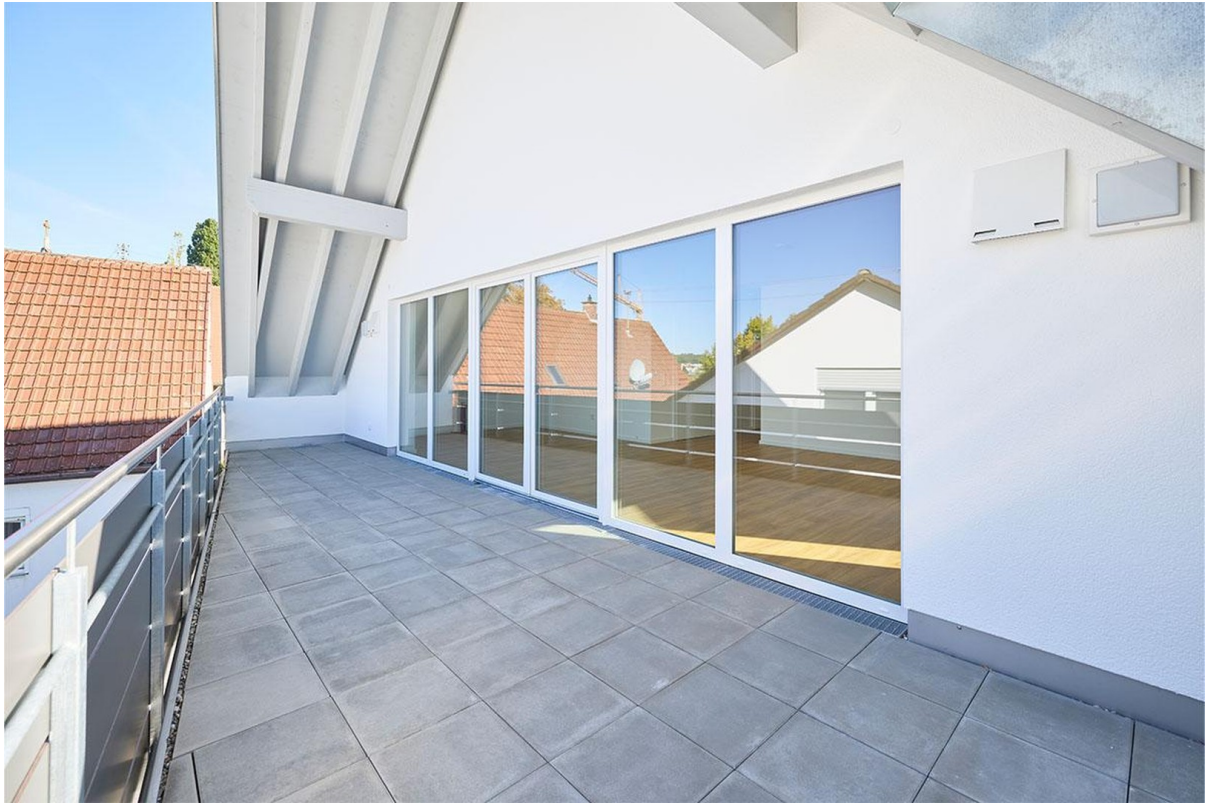
Loggia zum Grillen und Entspan