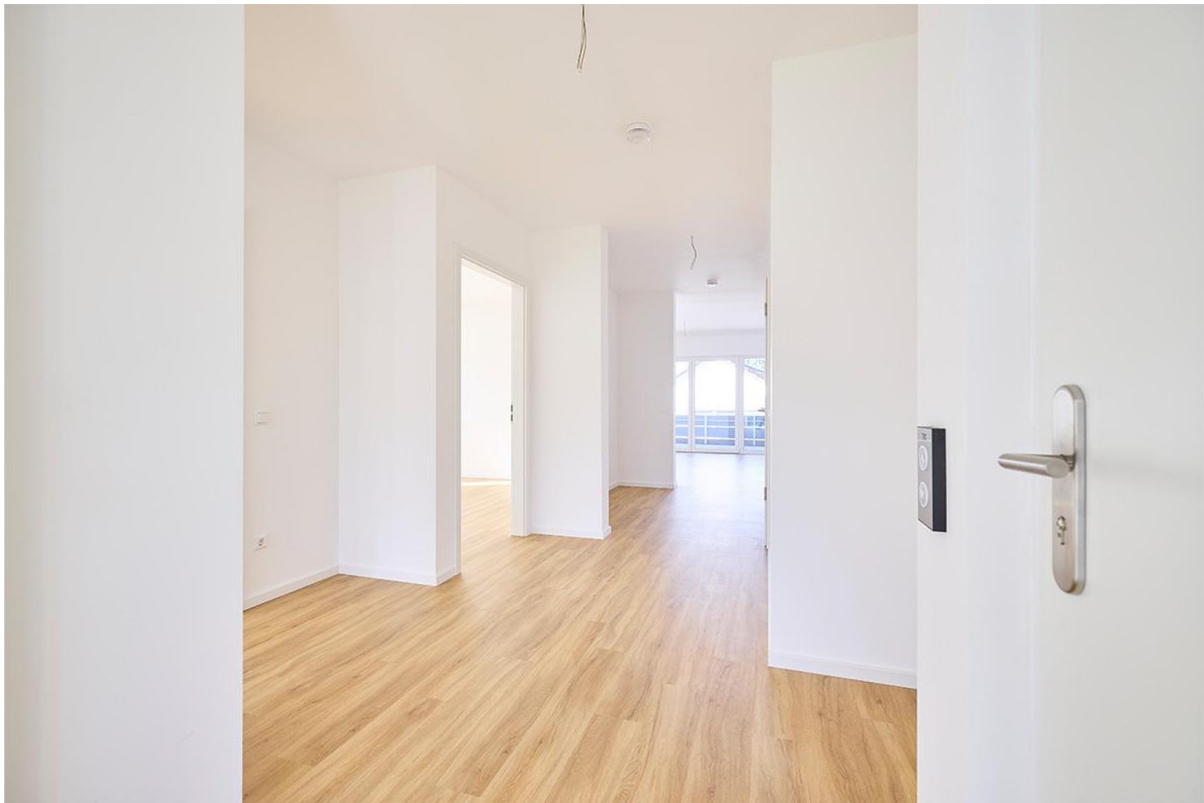
Eingang zur Wohnung