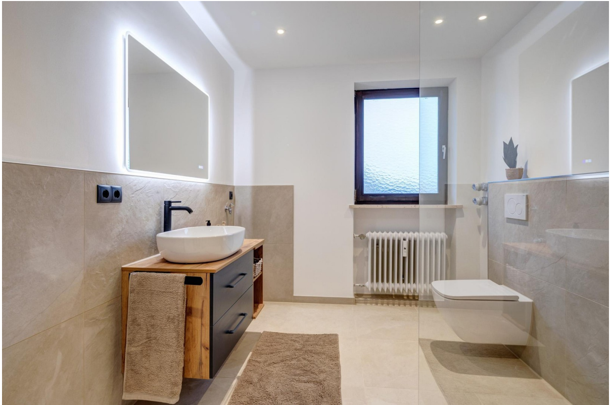
Bad mit Begehrer Dusche