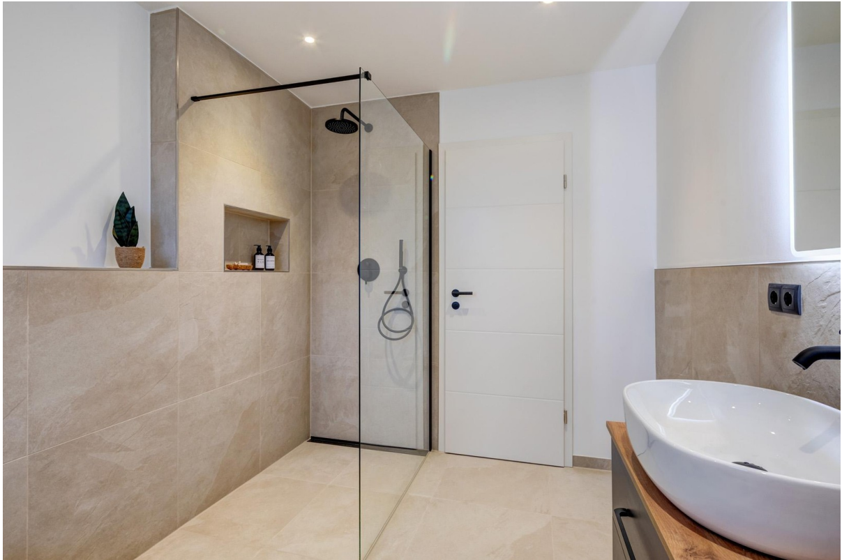
Bad mit Begehrer Dusche