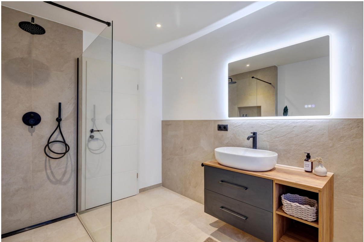
Bad mit Begehrer Dusche