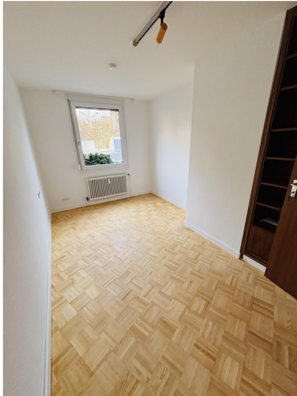
Büro / Schlafzimmer 2