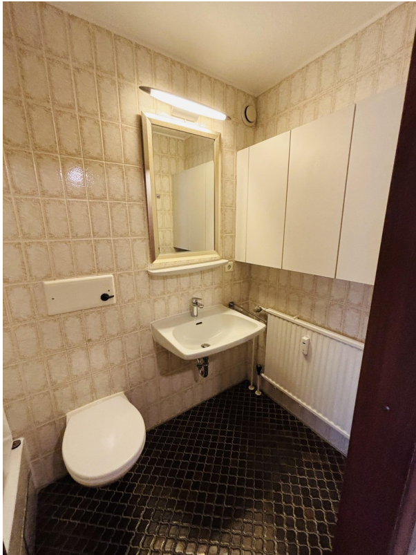
Duschbad mit WC