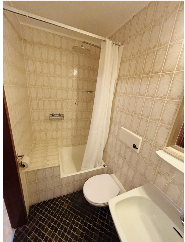
Duschbad mit WC