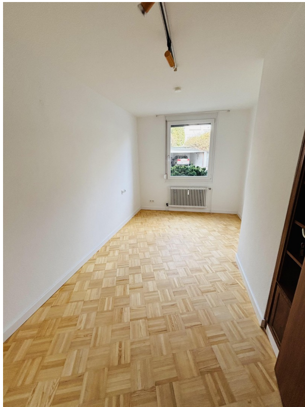
Büro / Schlafzimmer 2