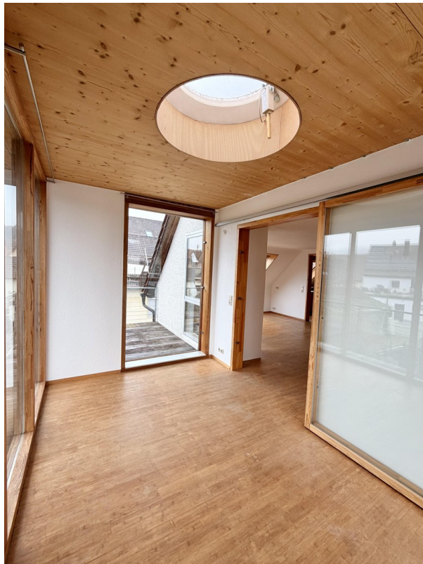
Blick auf den Balkon