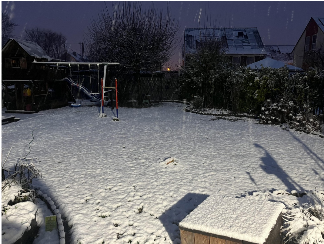
Garten im Winter