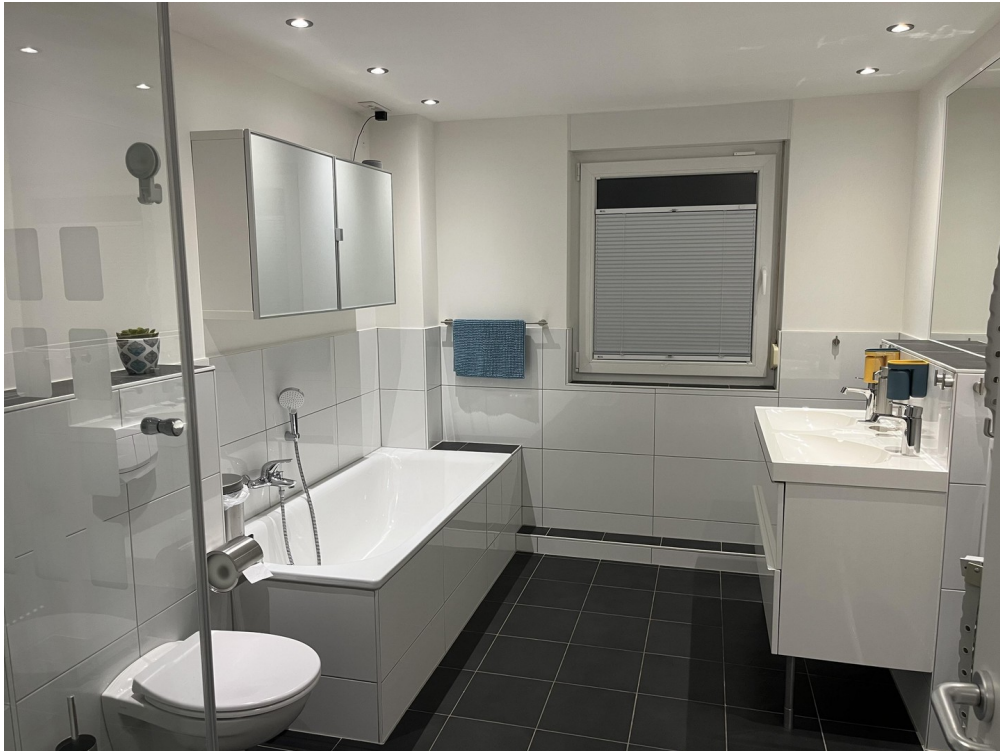
Bad 1. OG