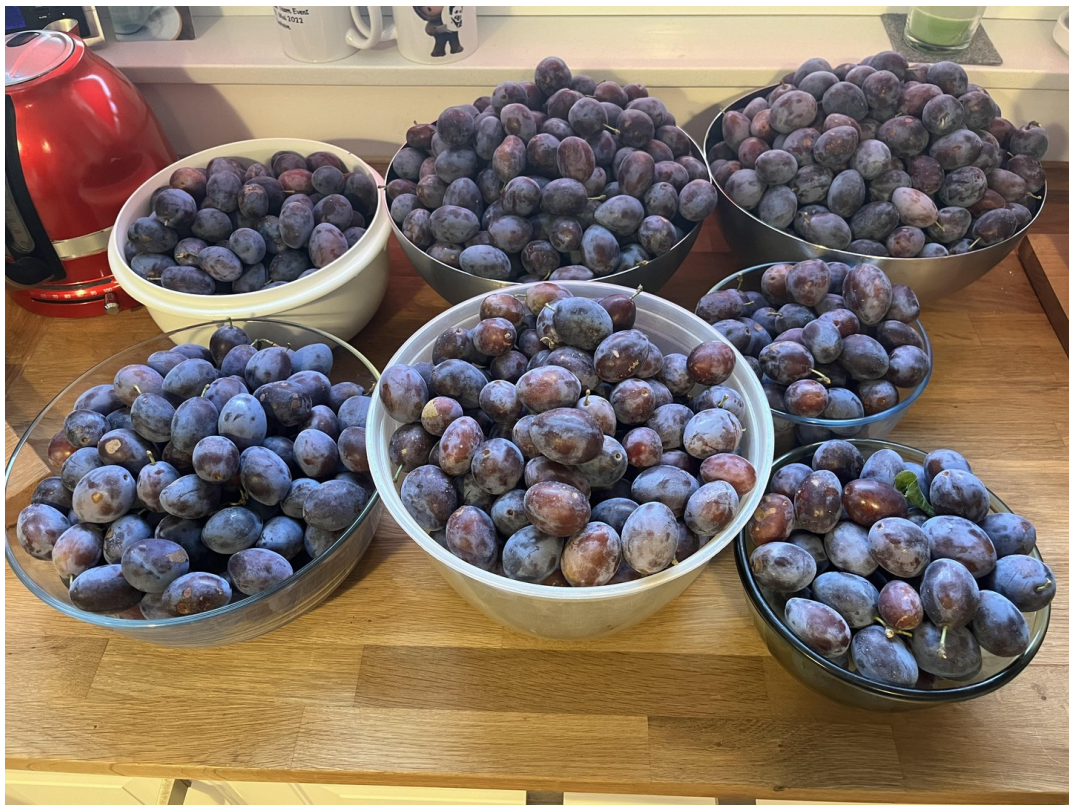
Pflaumen aus dem eigenen Garte