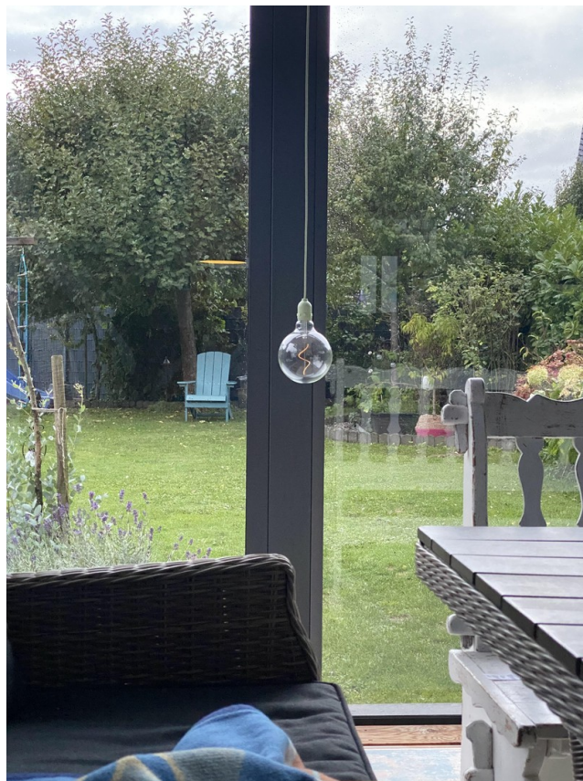
Blick aus dem Wintergarten