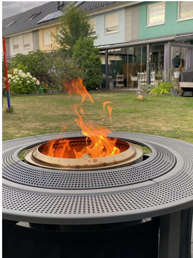
Stockbrot geht immer