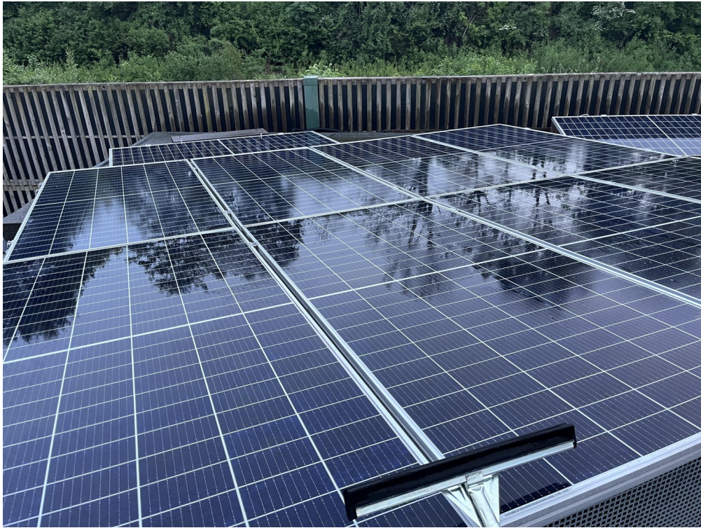
Solaranlage auf dem Gartenhaus