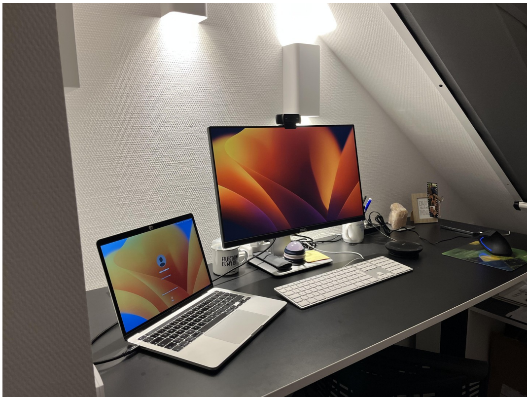
Kleines Büro im DG