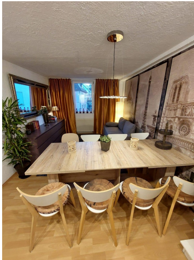
Küche und Wohnzimmer