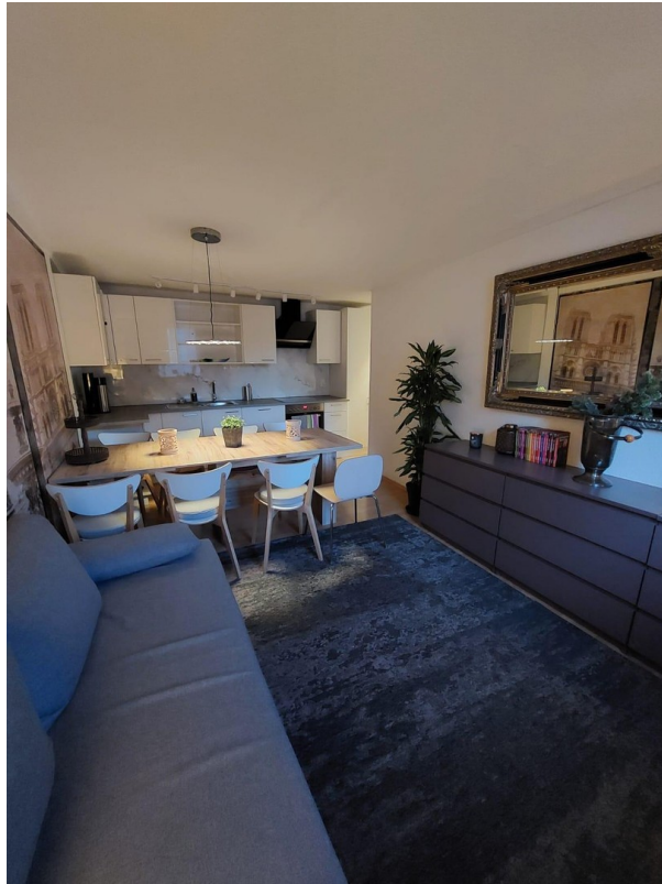
Küche und Wohnzimmer