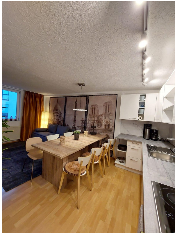
Küche und Wohnzimmer