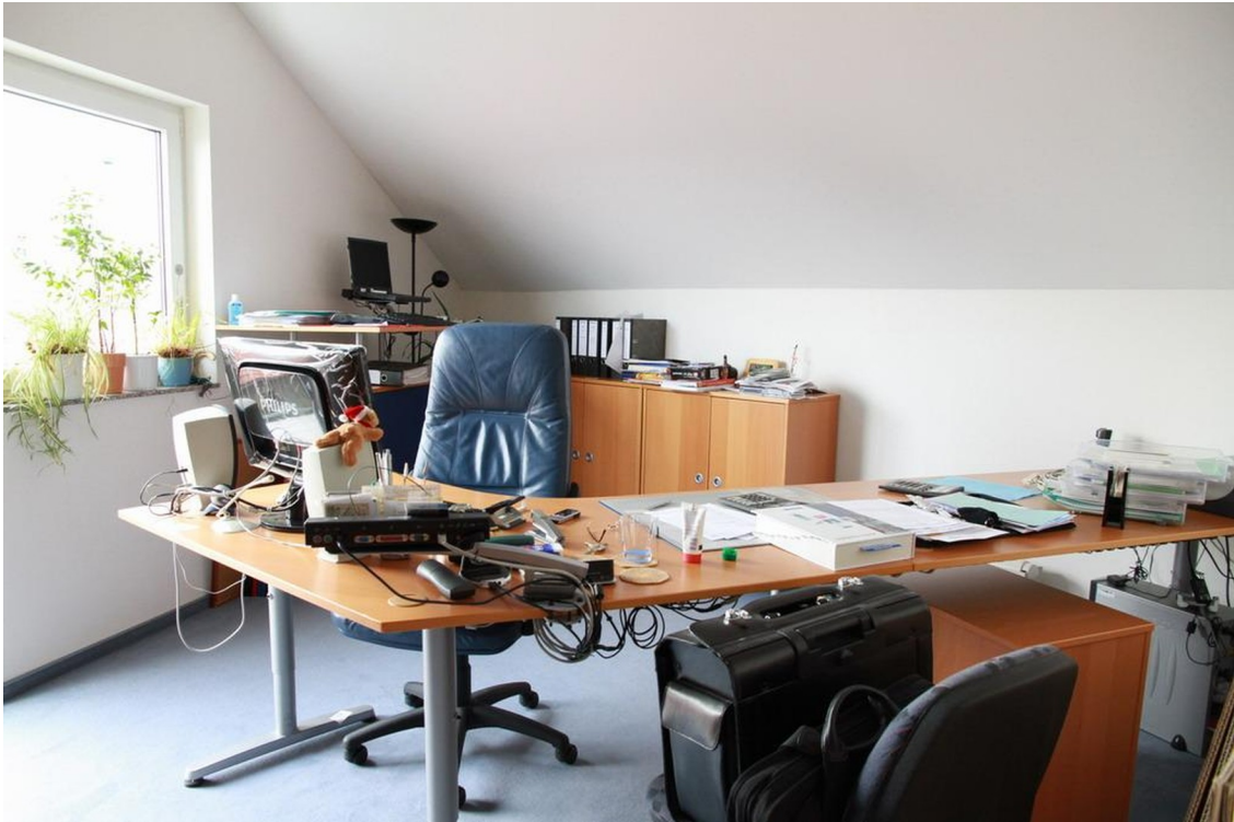
Raum 2 DG (Ausstattungsbsp.)