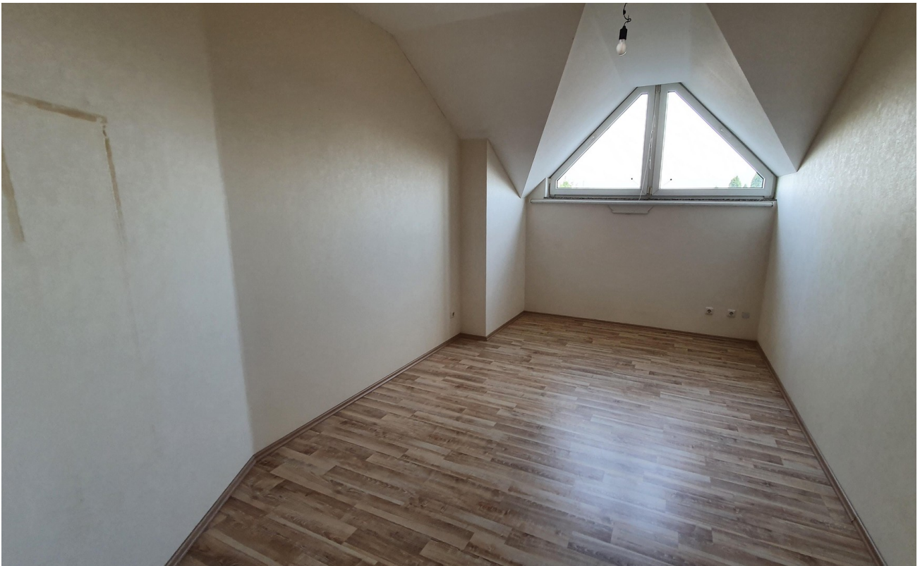
Raum 4 DG