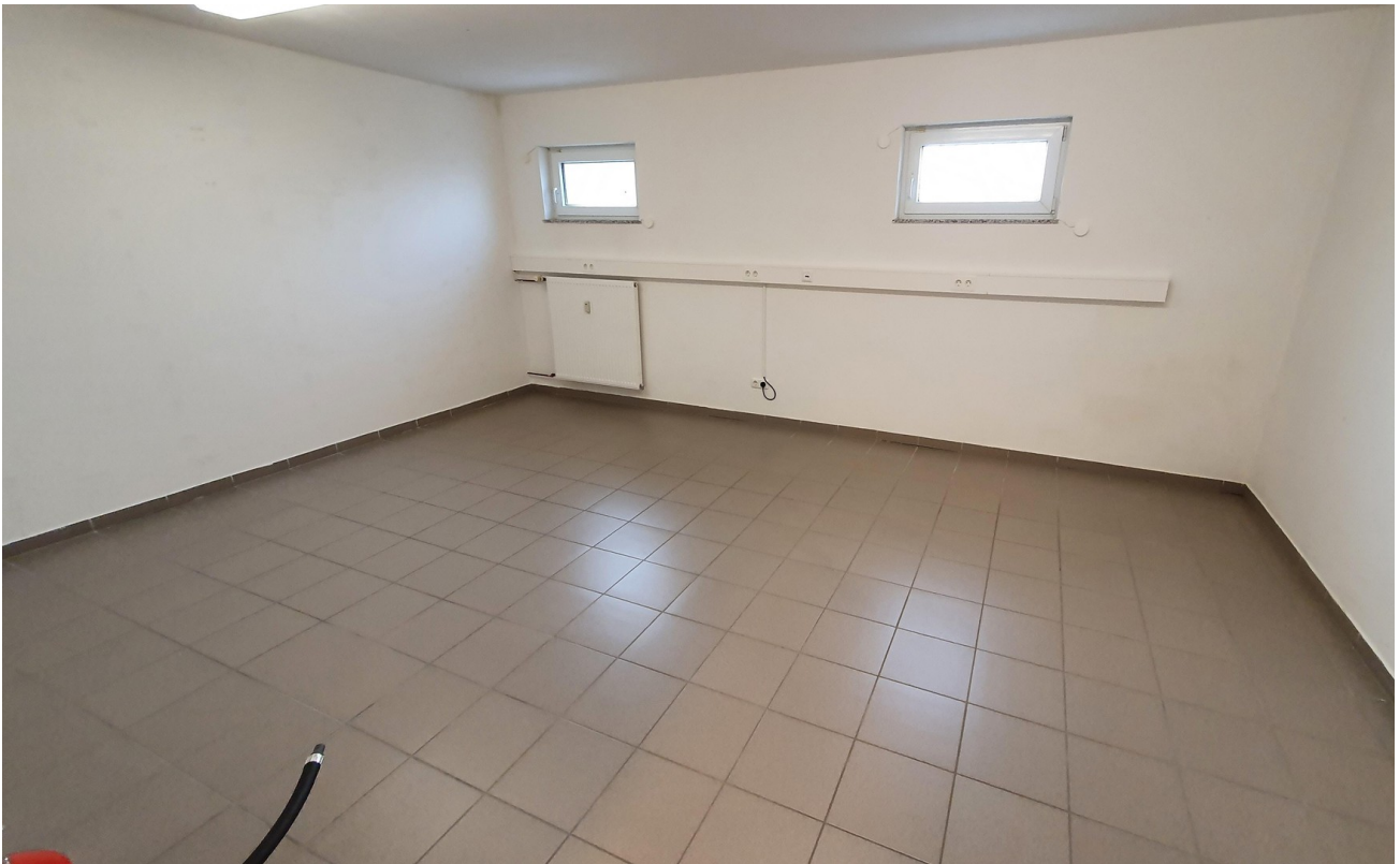
Lager Souterrain (optional)