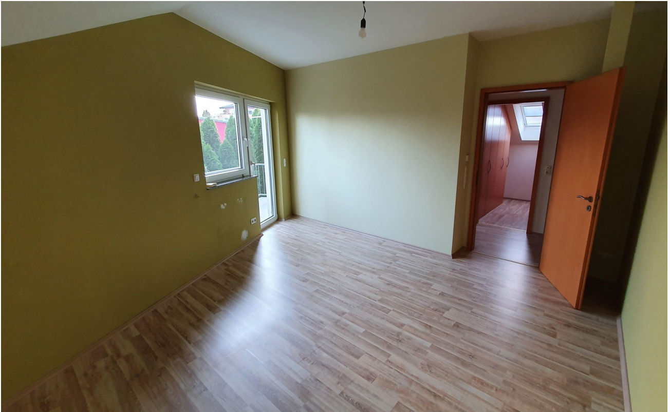
Raum 3 DG