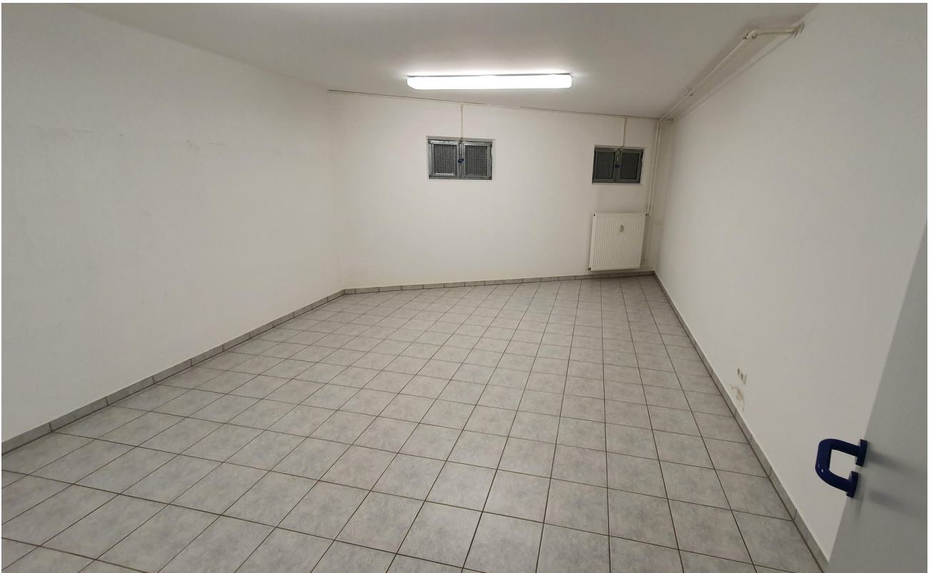
Raum 4 KG (optional)