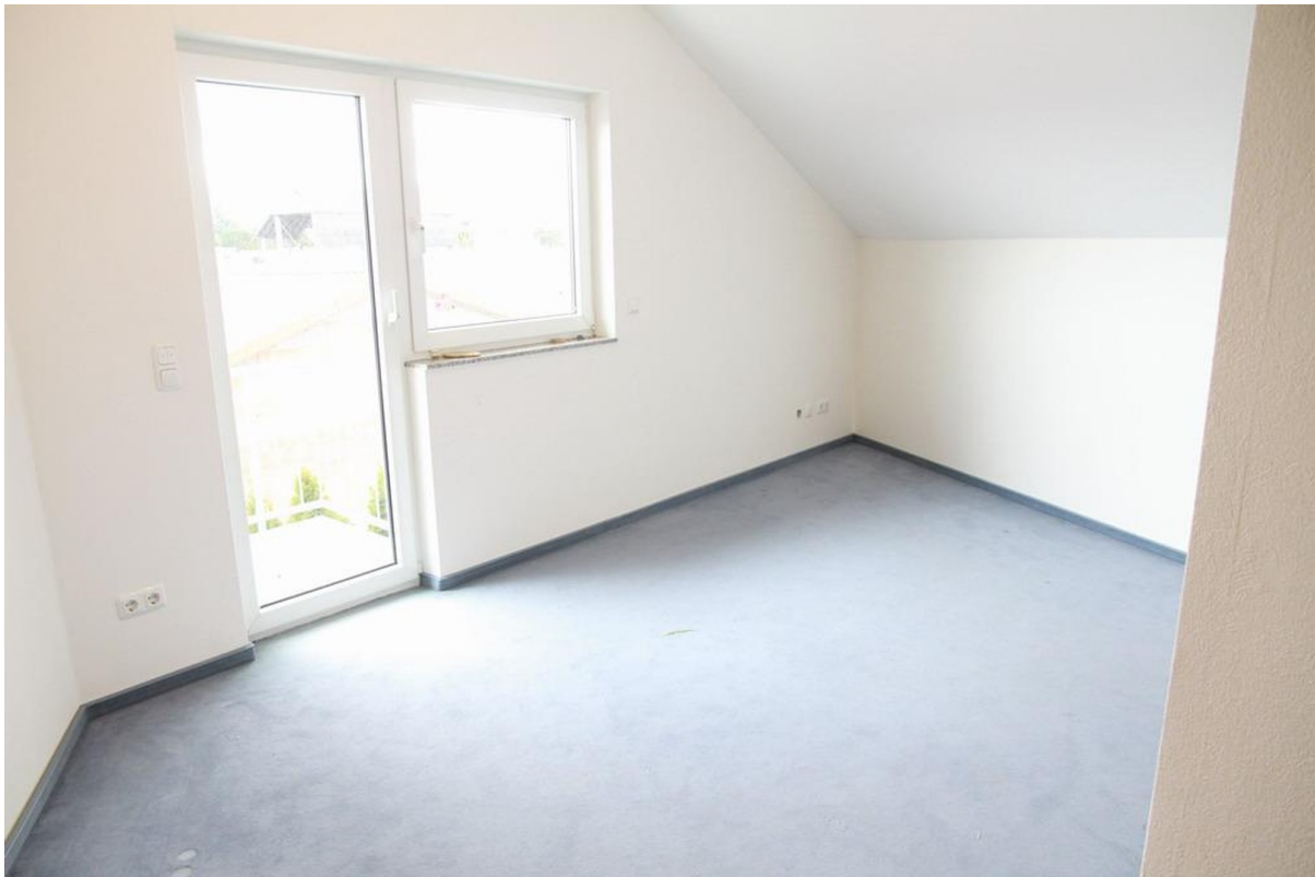
Raum 2 DG (Ausstattungsbsp.)