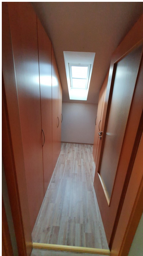
Raum 1 DG