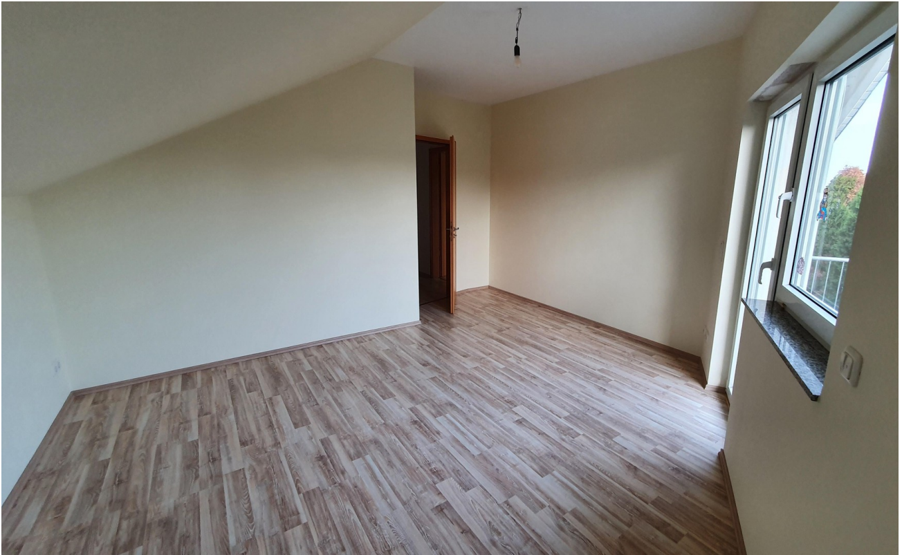
Raum 2 DG