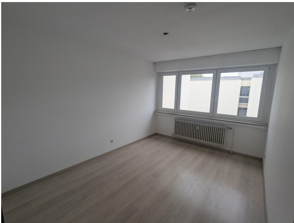
Schlafzimmer 2 / Kinderzimmer