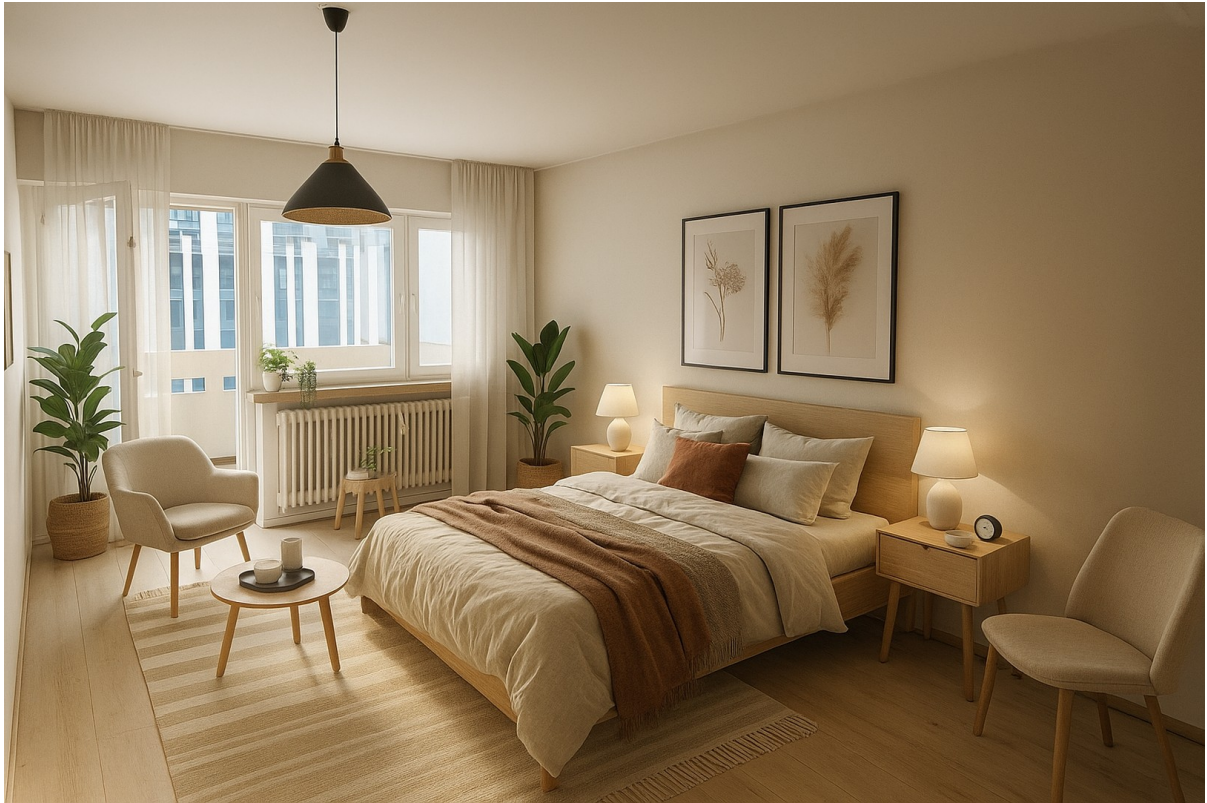
Schlafzimmer 1 Visualisierung