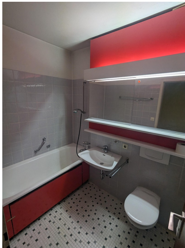
Bad mit Toilette