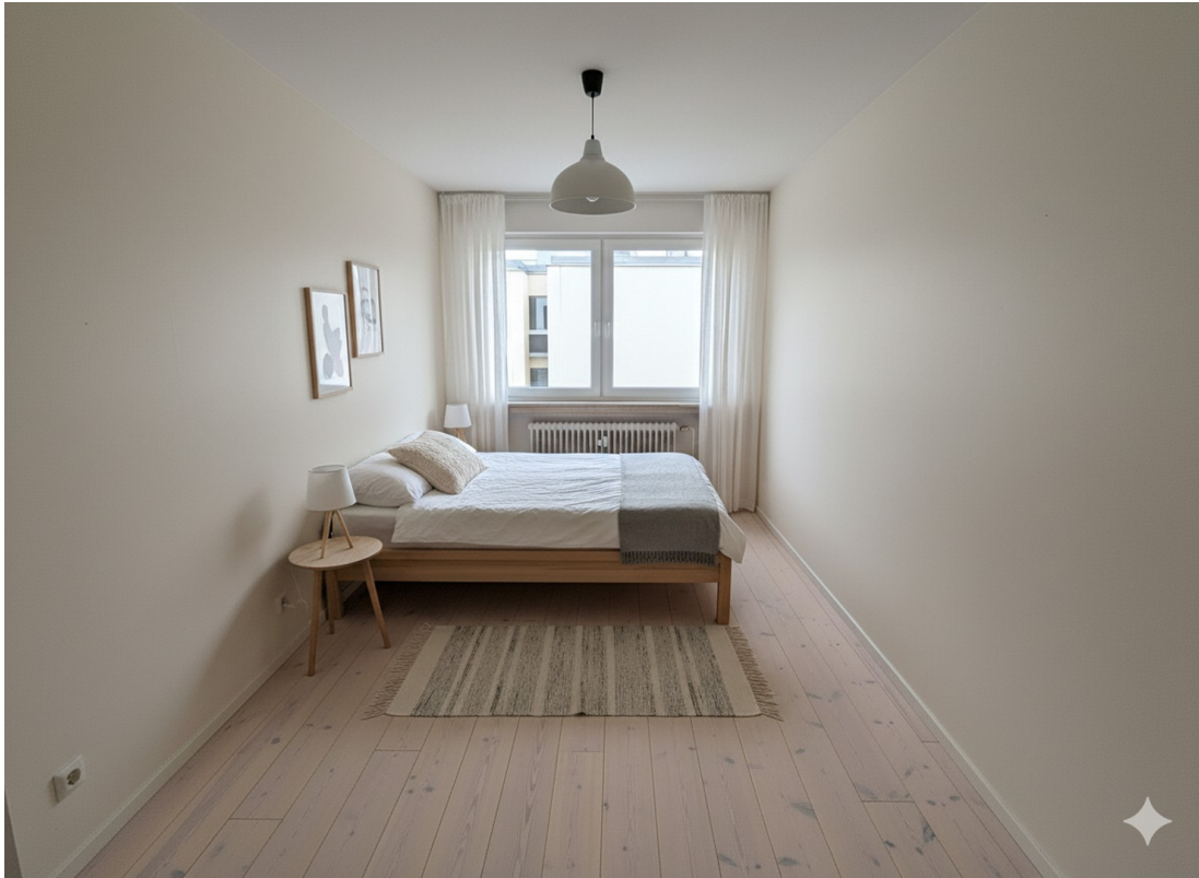
Schlafzimmer 3 Visualisierung