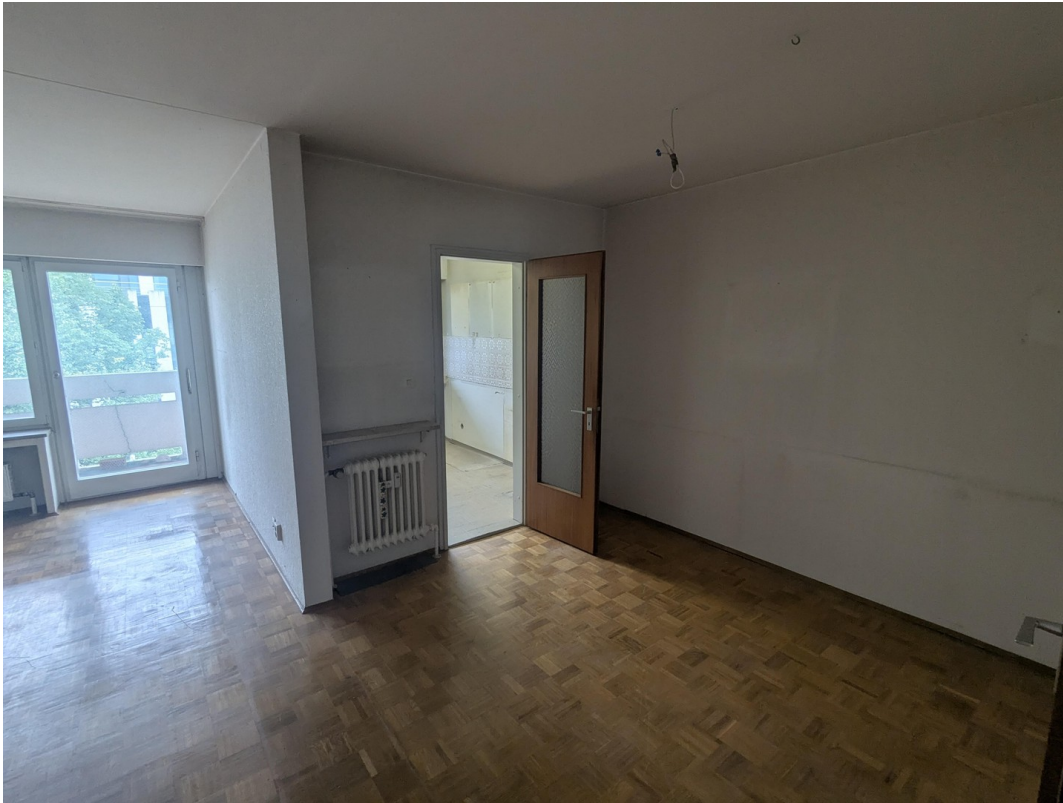
Essecke im Wohnzimmer