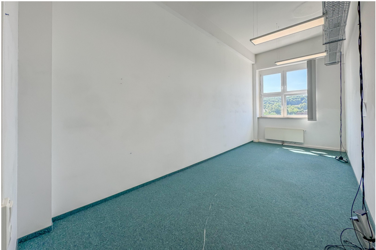
Lagerfläche / Einzelbüro