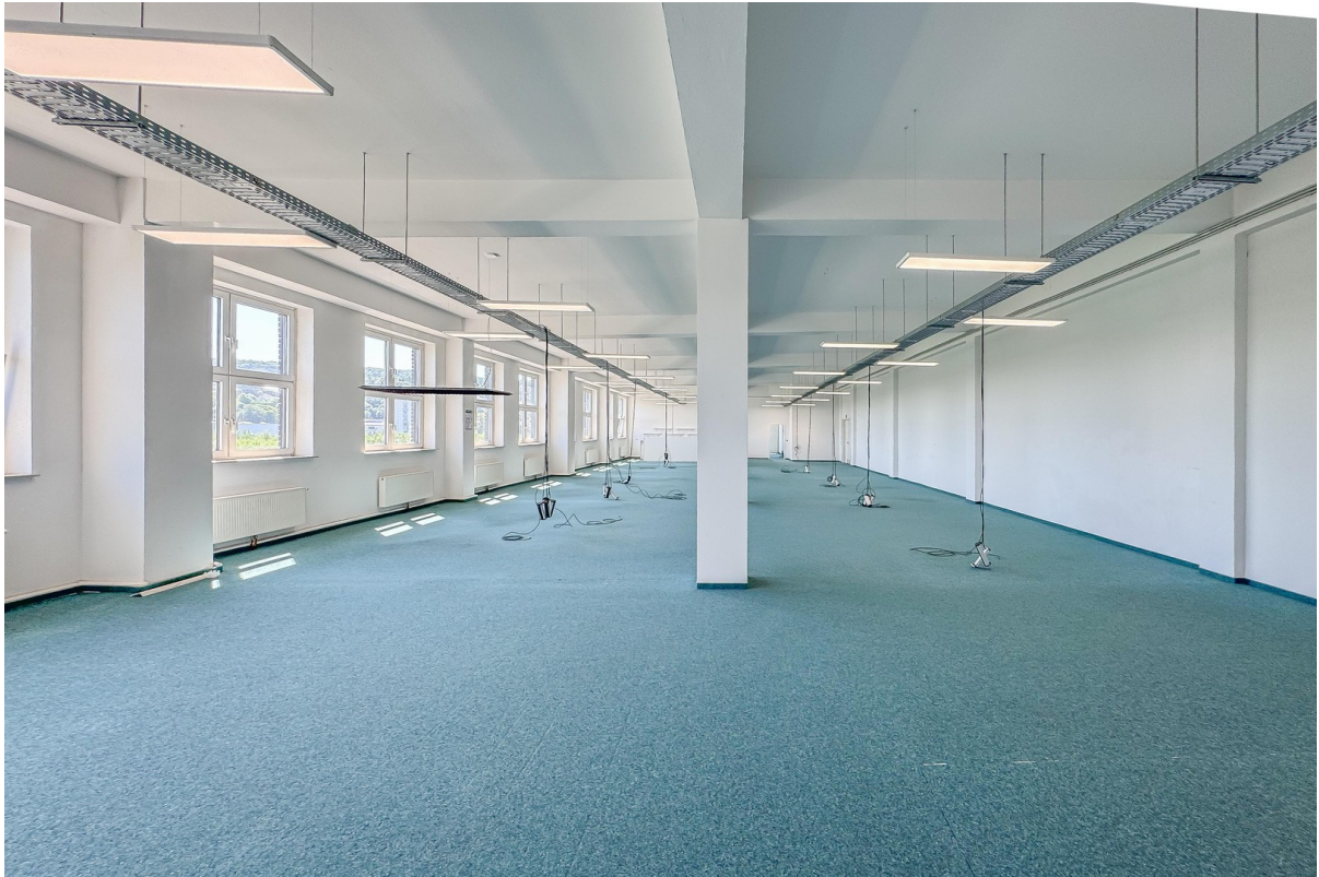
Lagerfläche (Beton u. Teppich)