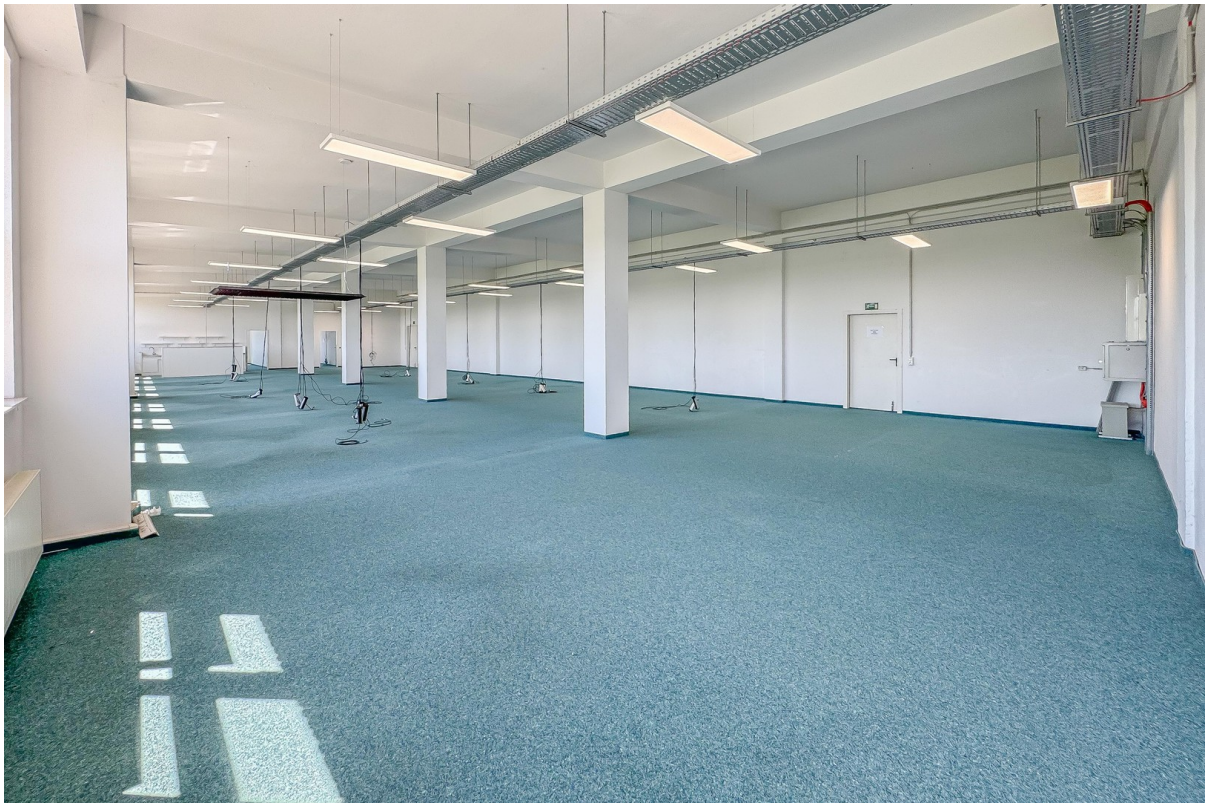
Lagerfläche (Beton u. Teppich)