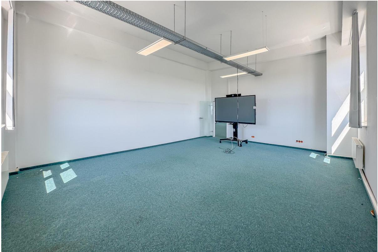
Lagerfläche / Einzelbüro