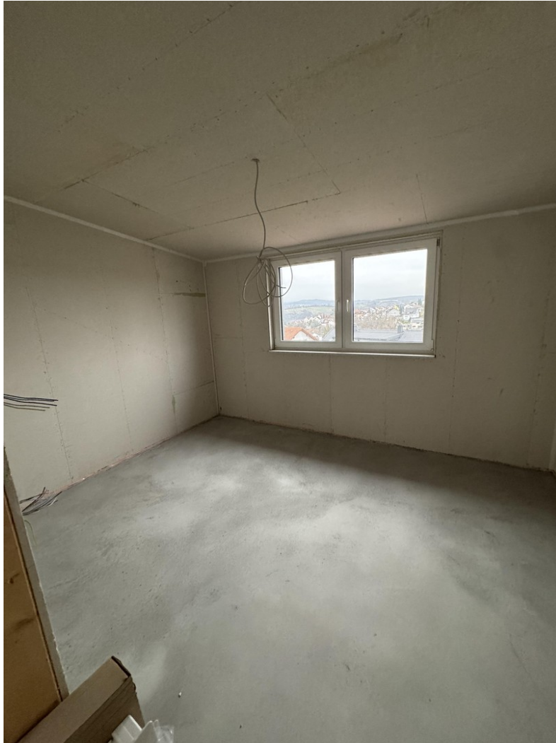
Schlafzimmer - im Innenausbau