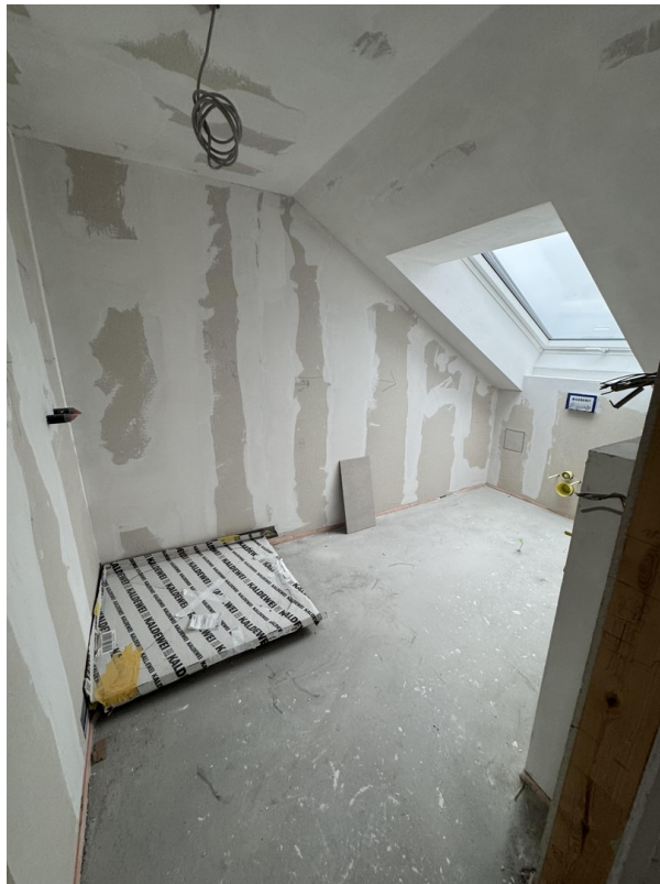
Bad - im Innenausbau