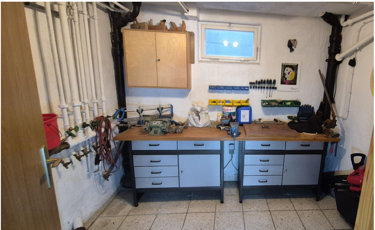
Werkstatt im Keller