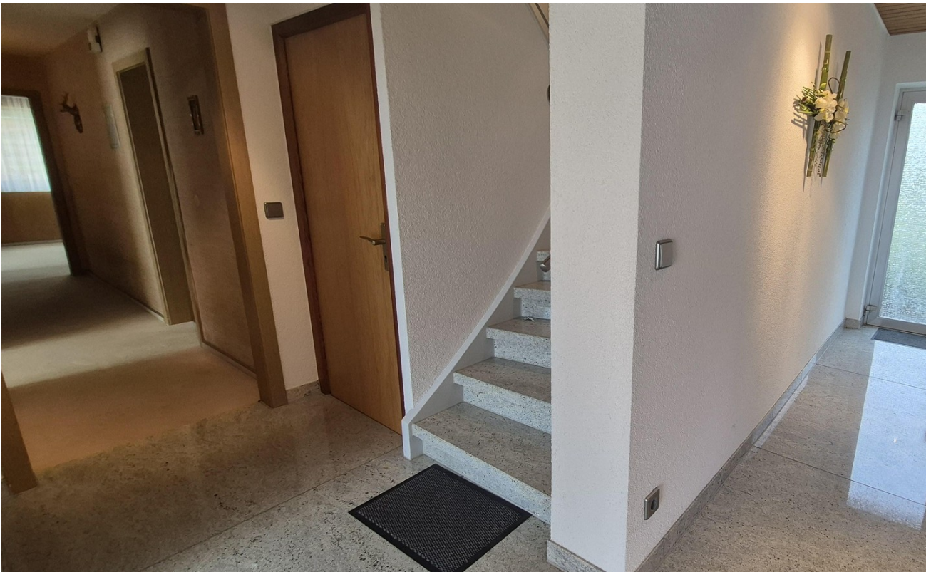
Eingangsbereich mit Gartenzug