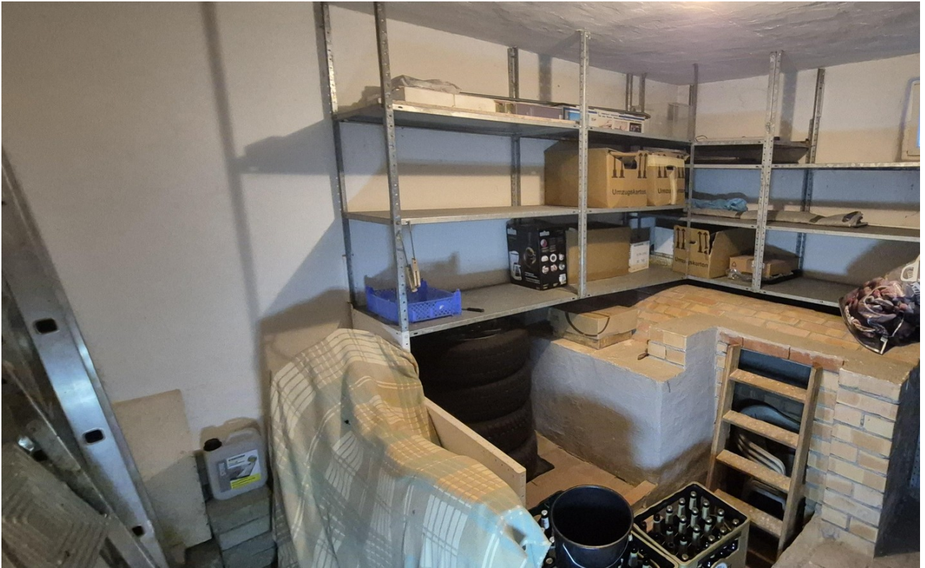
Kellerraum mit Kartoffelkeller