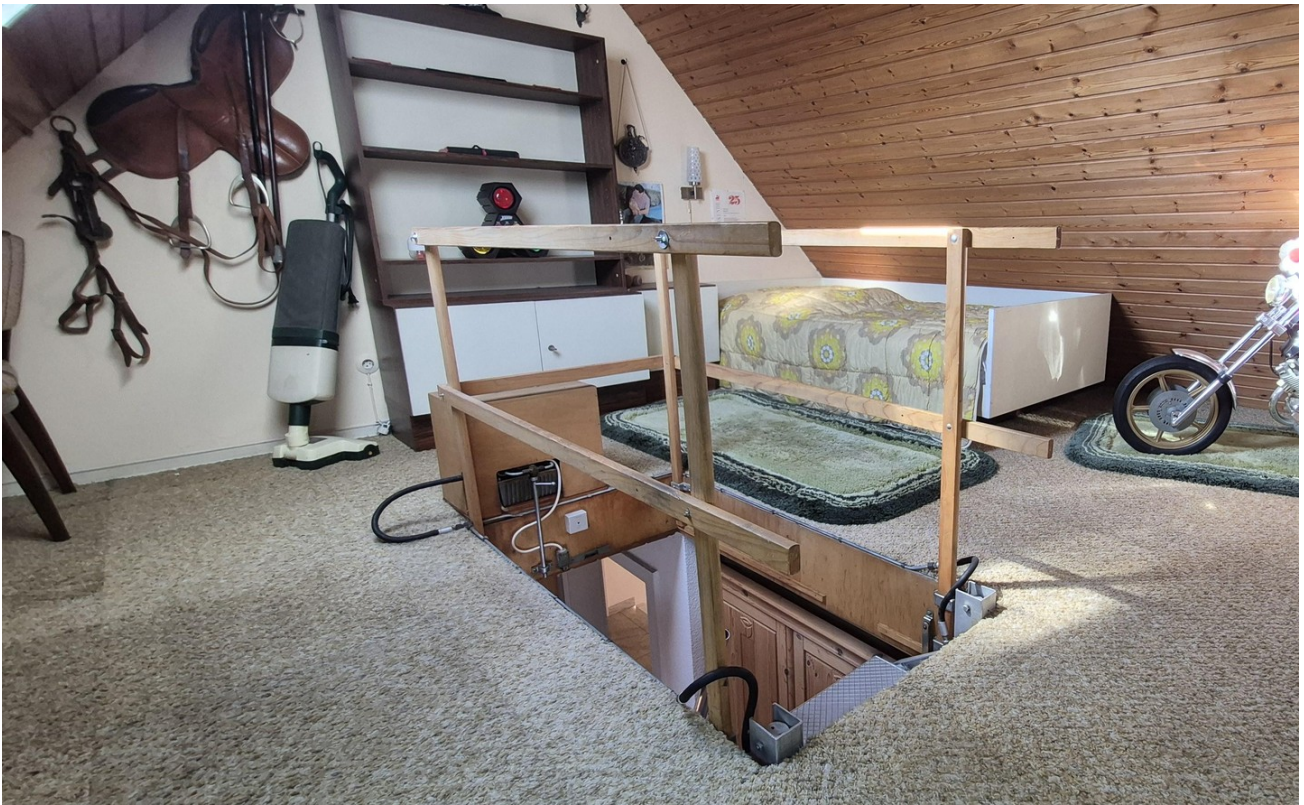
Kinder - Spielzimmer