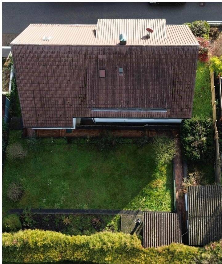
Hausansicht Vogelperspektive 2