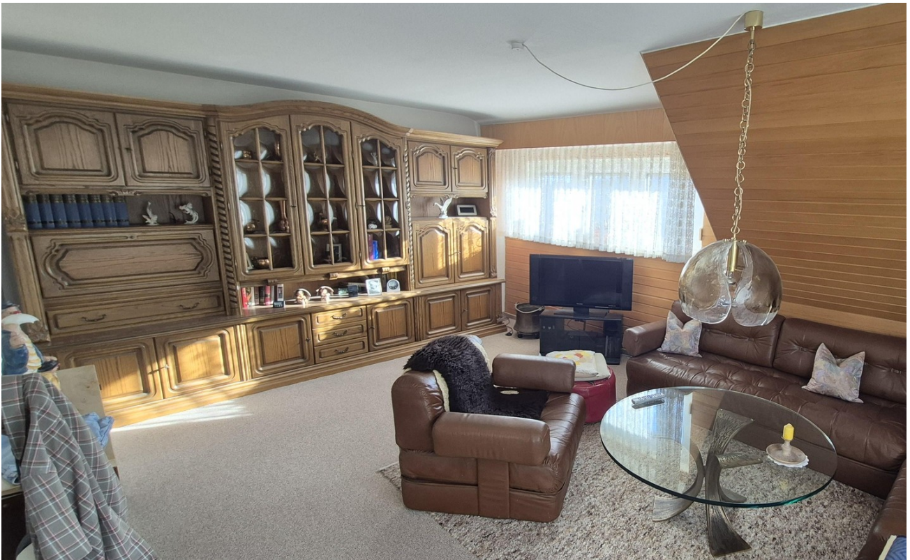
Wohnzimmer OG 2