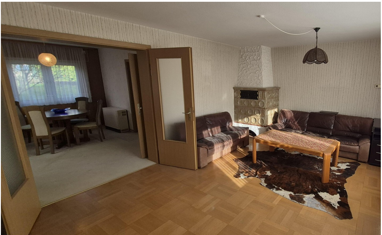
Wohnzimmer EG mit Kamin