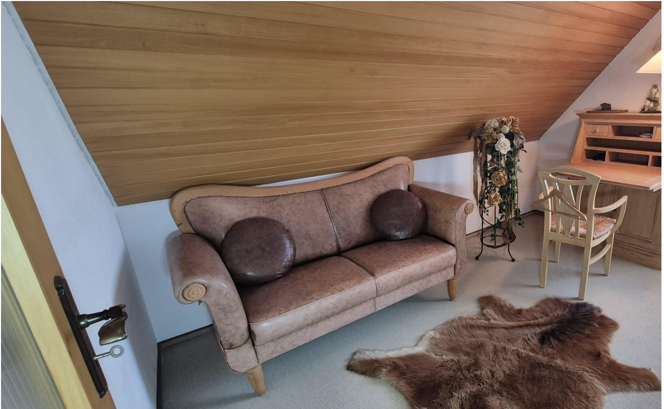
Zimmer Anbau OG