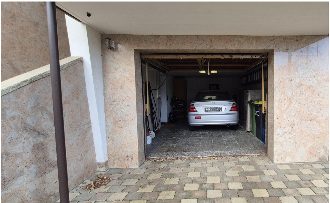
Garage + Stellplatz