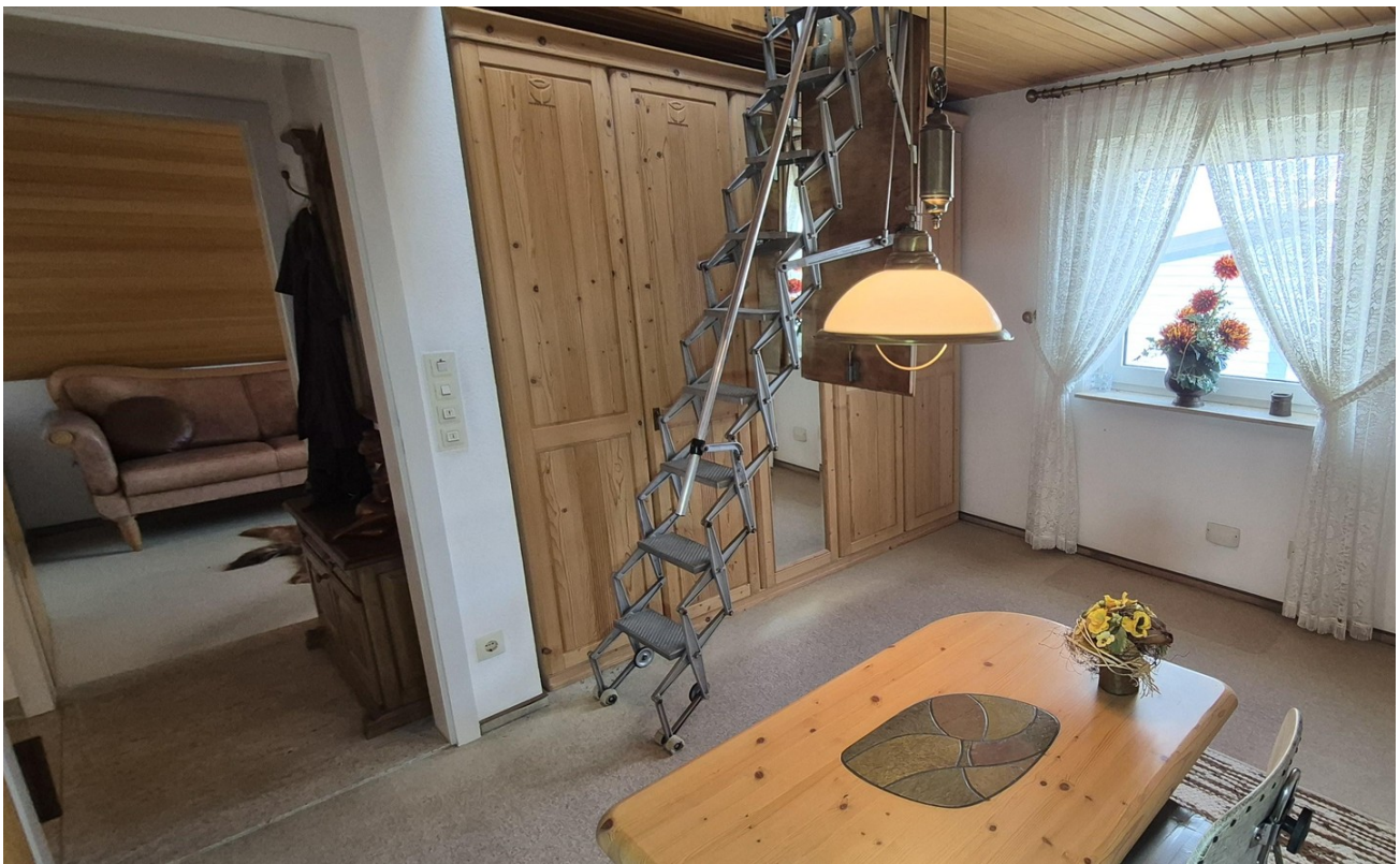
Zimmer Anbau OG 2