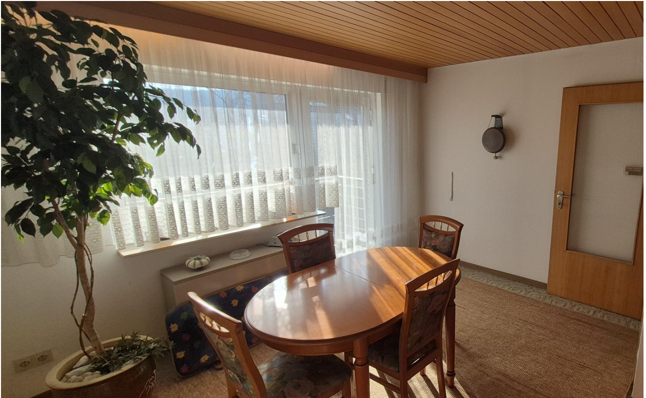
Zimmer Anbau mit Balkon