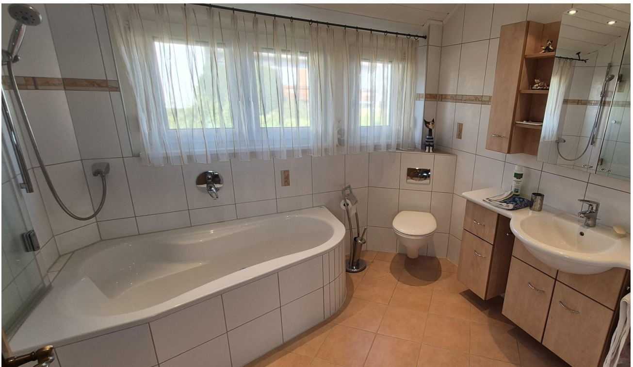
Tageslichtbadezimmer OG 2