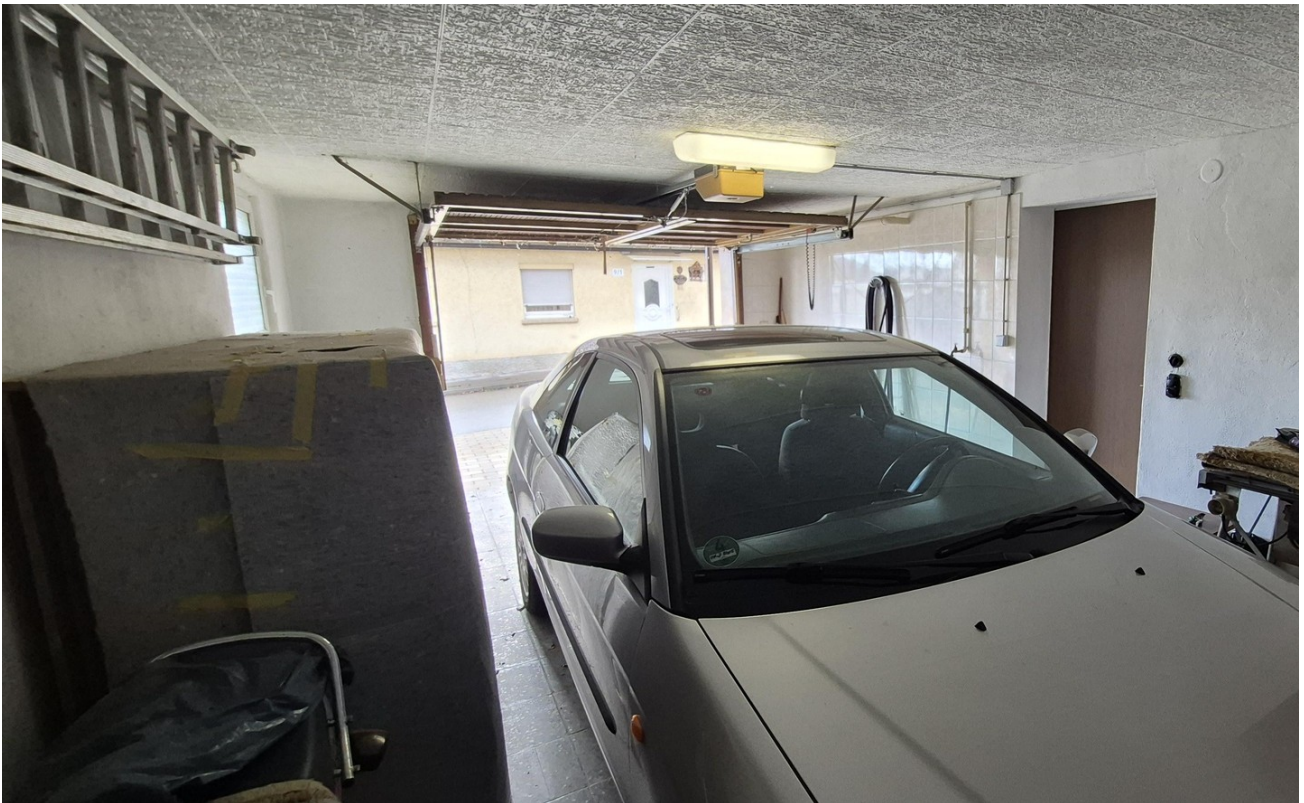
große Garage 2