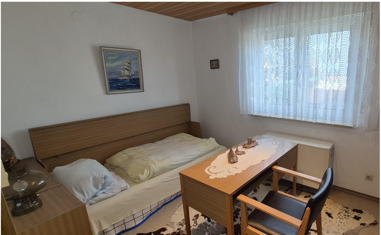
Zimmer Anbau EG