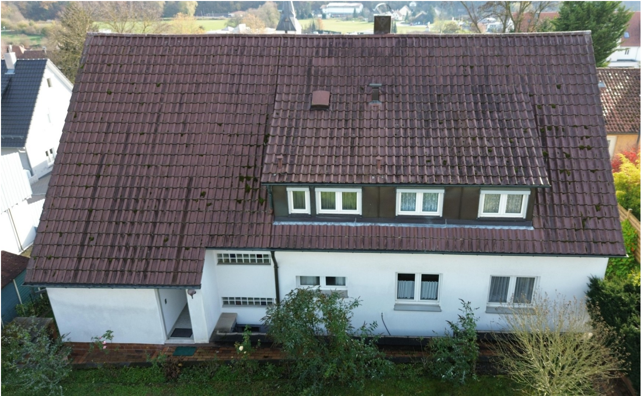
Hausansicht vom Garten