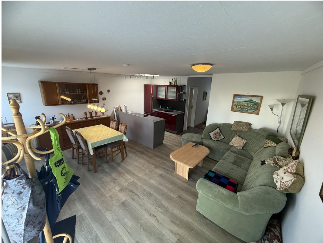
Hobbyraum Garten Lounge