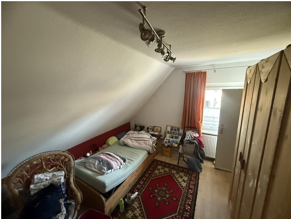
DG Schlafzimmer 1