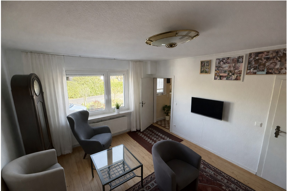
Wohnzimmer nach auszug