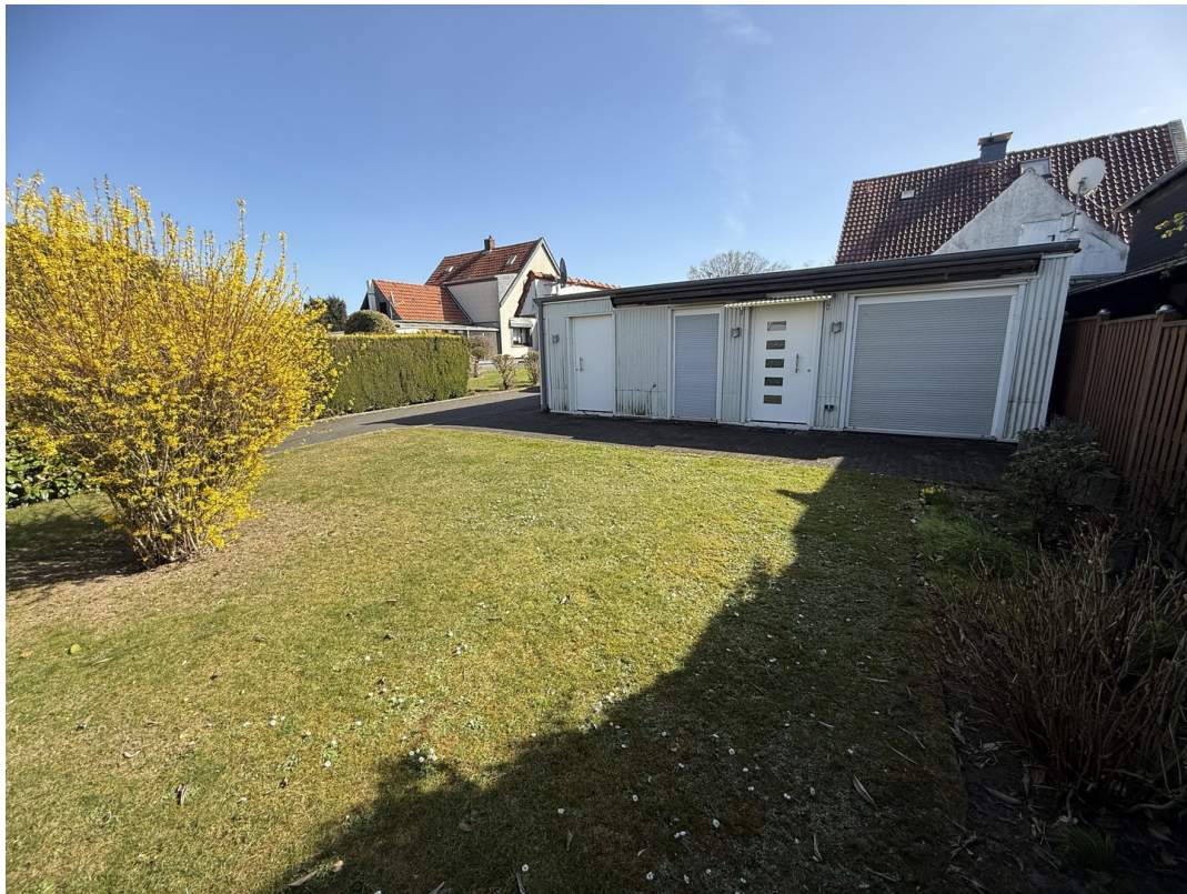
Garten und Hobbyraum Zugang