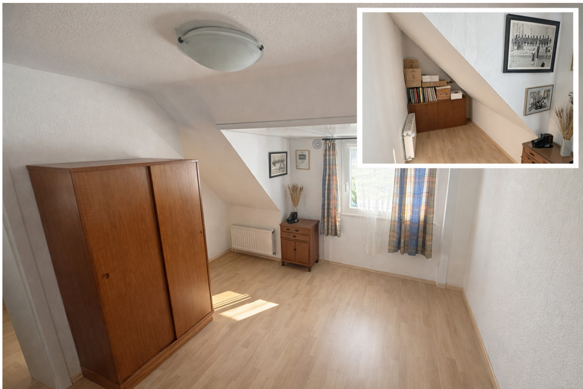
DG Schlafzimmer 2