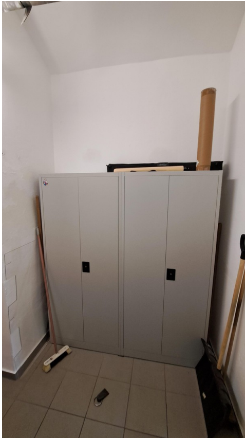
Flur zum Nebeneingang