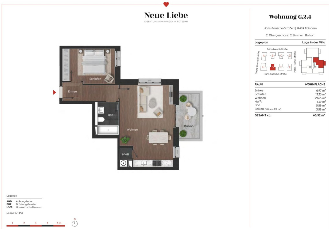
Grundriss der Wohnung