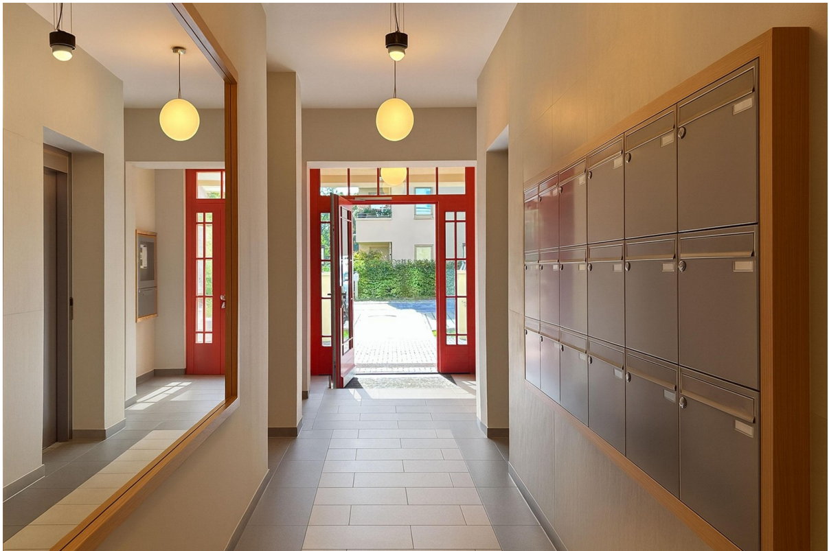
Flur im Eingangsbereich