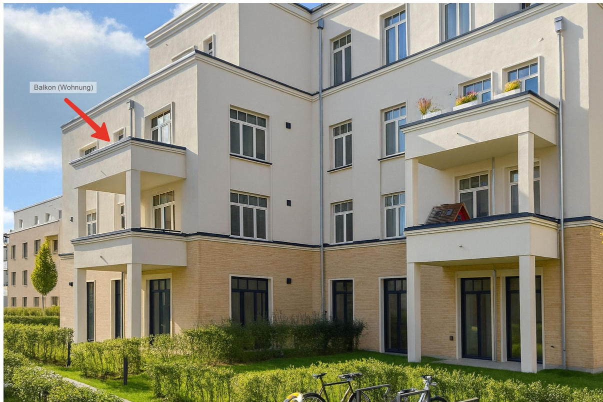
Position des Balkons