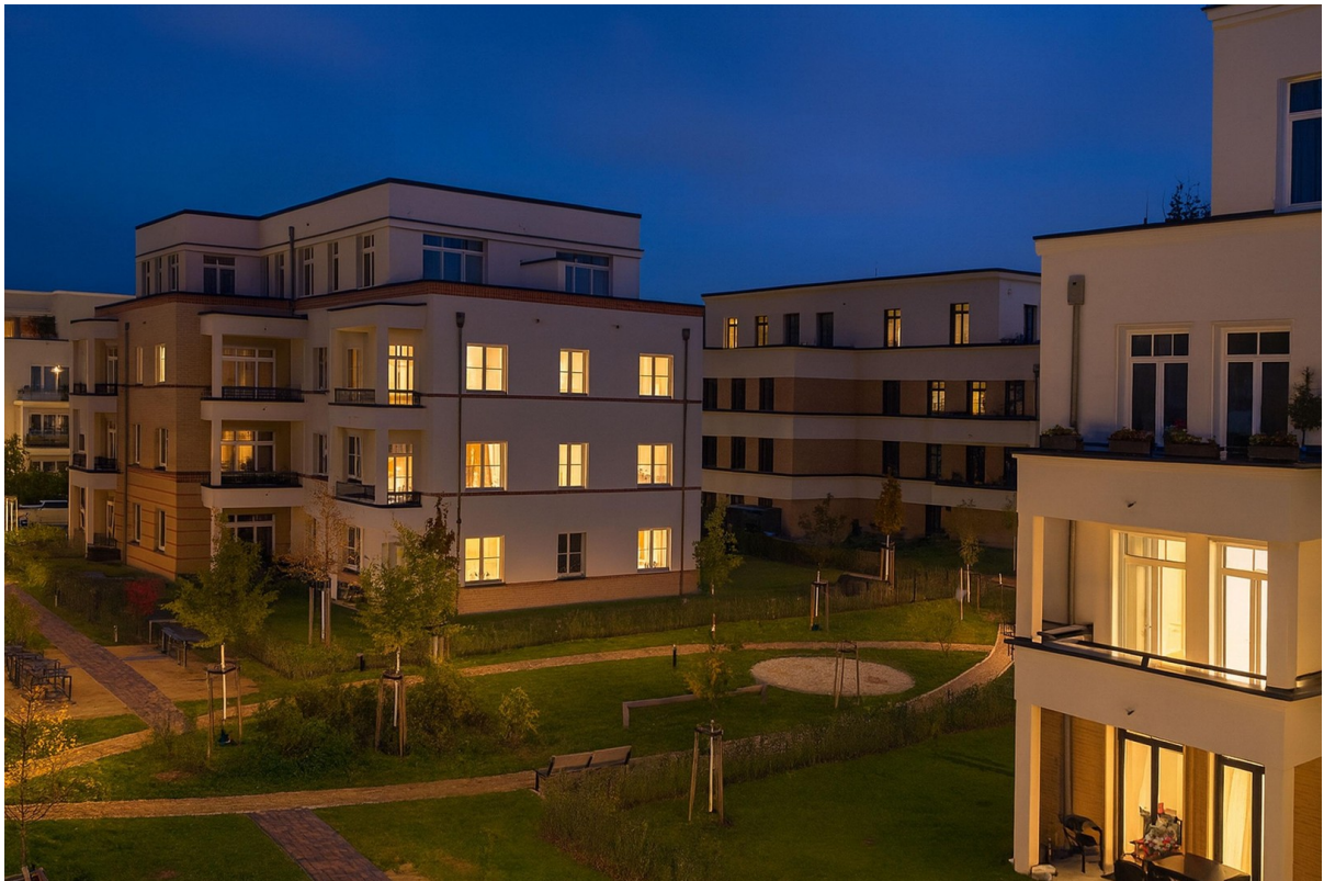
Ausblick am Abend