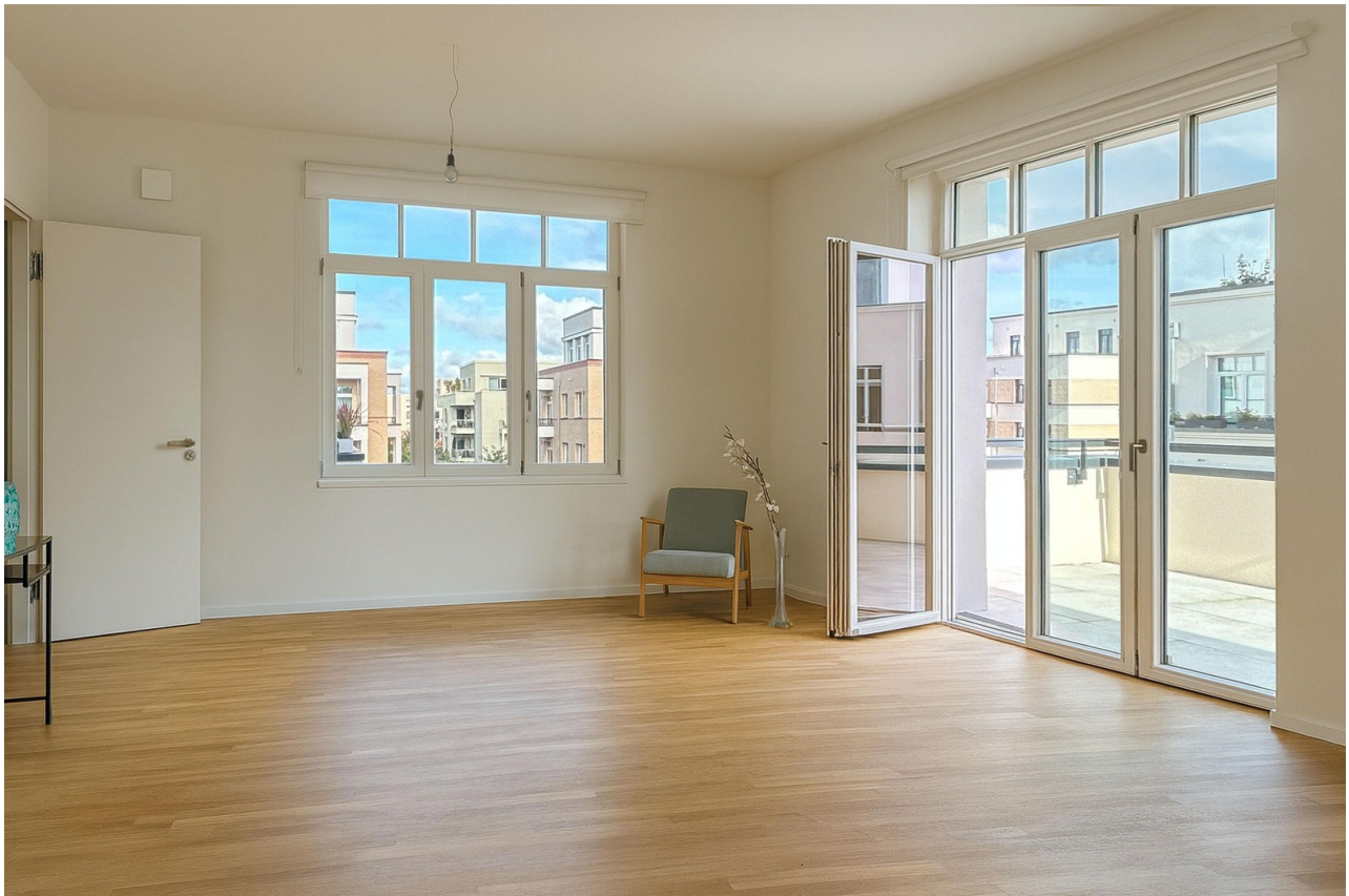
Wohnzimmer mit Balkonzugang