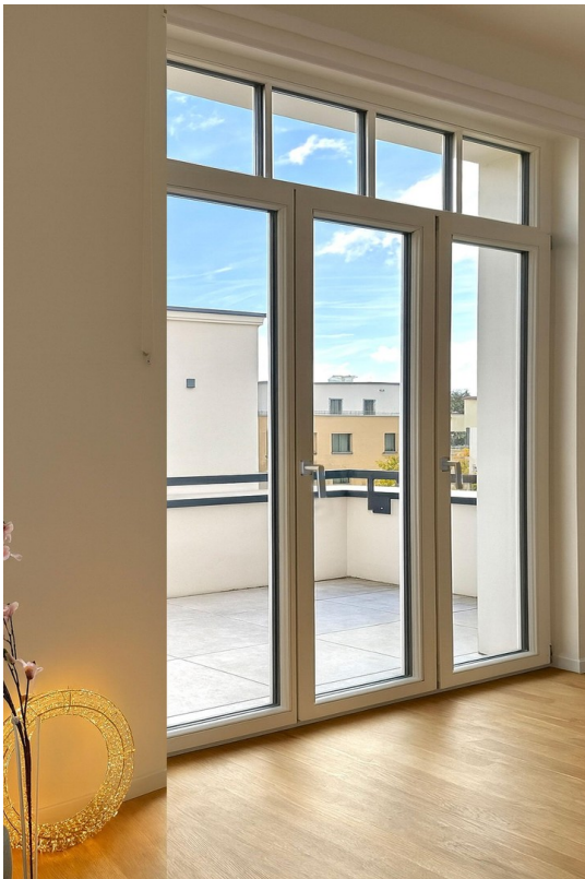
bodentiefe Fenster zum Balkon